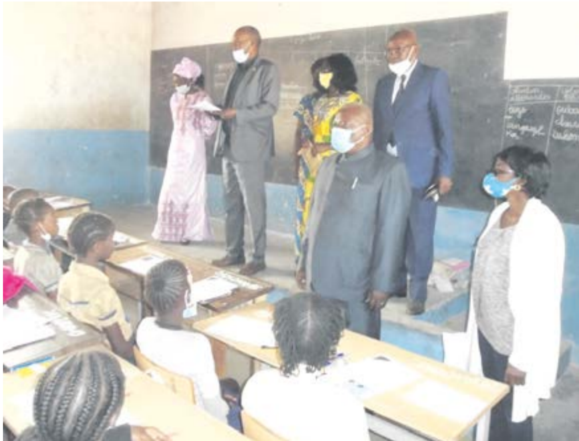
Lancement des épreuves écrites du CEPE à Pointe-Noire

Peu après le lancement des épreuves, il n'a pas caché sa satisfaction. « Ici au centre de l'école du 31 décembre 1969, nous avons trouvé des candidats bien disposés dans leurs salles qui n'attendent que le lancement des épreuves. Nous avons déposé les sujets des mathématiques dans chaque salle. Tout est donc mis en