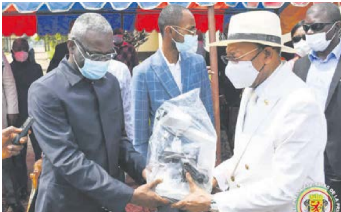
Le Premier remettant un kit au préfet de la Likouala