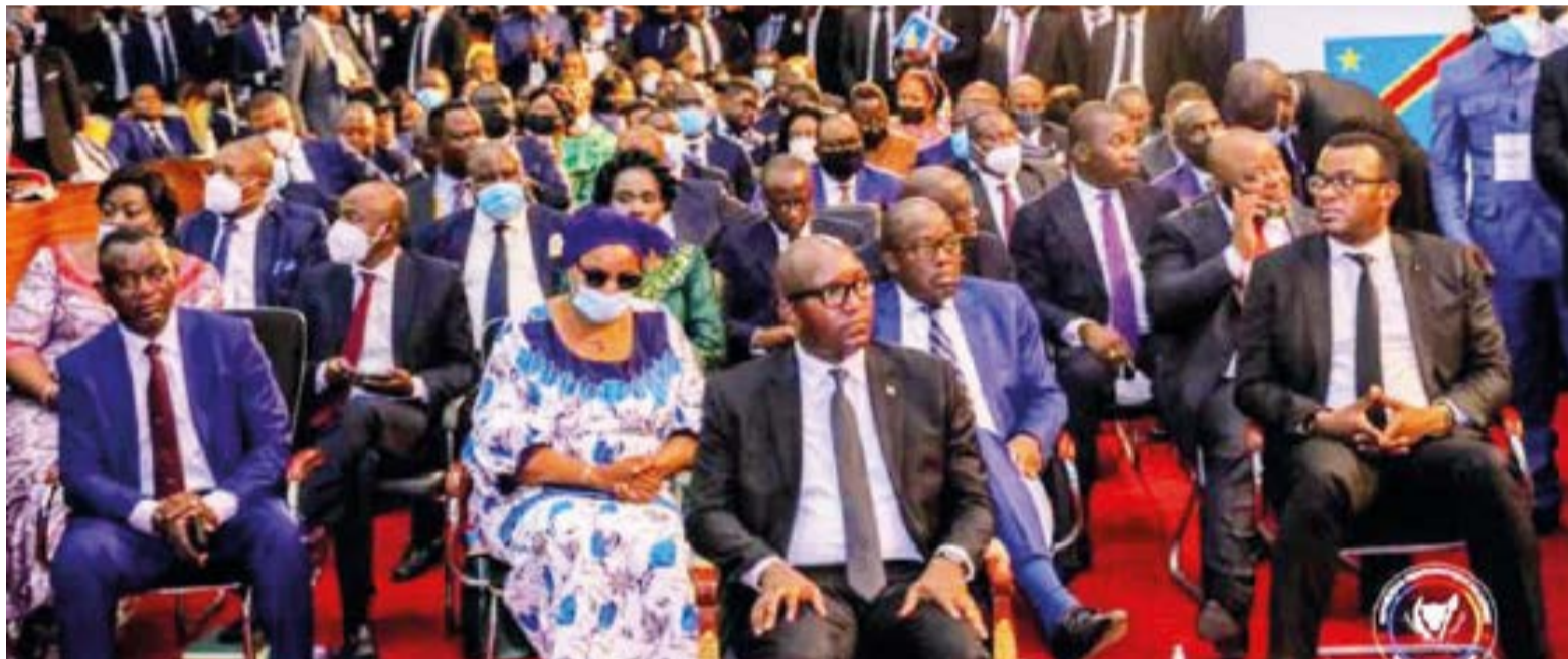
Le gouvernement Sama Lukonde lors de son investiture au Parlement

L'application de la couverture santé universelle et la situation de la pandémie sur l'ensemble du territoire national ont été parmi les points majeurs abordés du chapitre social au cours du dixième conseil des ministres que le Premier ministre Jean-Michel Sama Lukonde a présidé, le 2 juillet, par visioconférence.