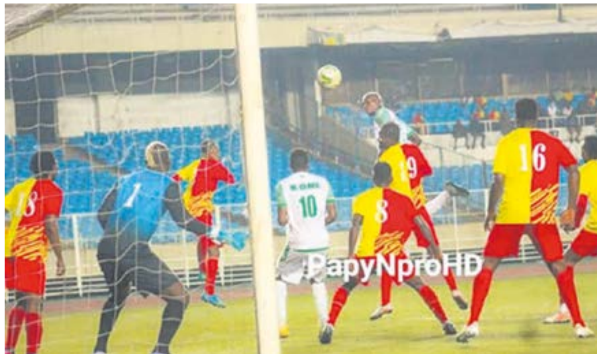
Vue de la finale de la 56e Coupe du Congo de football entre DCMP et Sanga Balende

Le club de Mbuji-Mayi s'appuie sur la mesure prise par la Fédération internationale de football interdisant au DCMP de recruter durant deux fenêtres de transferts. Pourtant, les deux joueurs cités sont arrivés chez les Immacu-