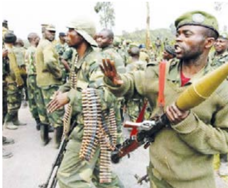
Des éléments des FARDC au front

Jean-Michel Sama Lukonde a attiré l'attention du conseil sur le recours à des tactiques terroristes à Beni pour monter la peur dans la population, attitude qui pousse le gouvernement à accroître son soutien aux forces armées et aux services de renseignement. Aussi l'exécutif national a-t-il décidé de poursuivre les opérations militaires en profondeur dans les zones rouges. Page 5