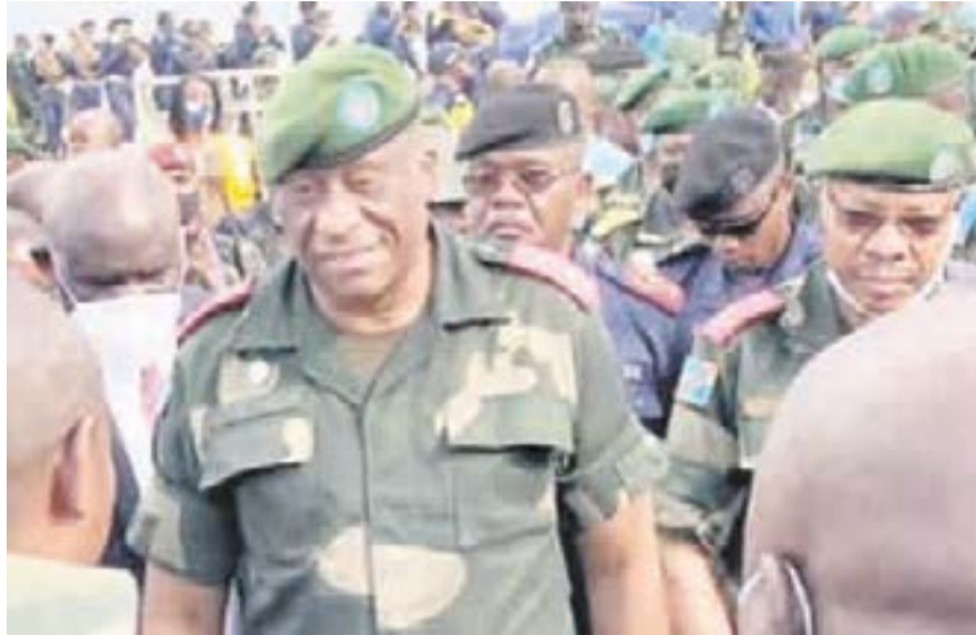
Le gouverneur militaire de l'Ithuri DR

Selon le ministre de la Défense nationale et Anciens combattants, Aimé Ngoy Mukena, le nouveau mode opératoire des terroristes à Beni dans la partie nord de la province du Nord-Kivu consiste à l'usage d'engins explosifs artisanaux dans des espaces publics. En réponse à ces nouvelles méthodes, le gouvernement a lancé un appel au renforcement de la vigilance des Forces de défense et de sécurité ainsi qu'à la collaboration de la population avec l'armée et la police en