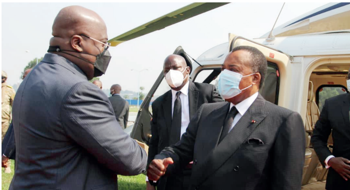
Denis Sassou N'Guesso accueilli à sa descente d'hélicoptère par Félix Antoine Tshisekedi Tshilombo