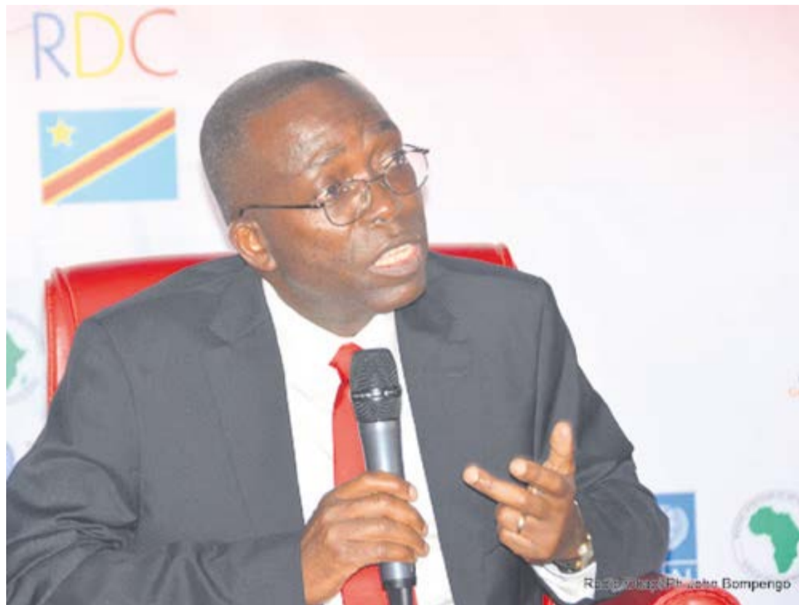
L'ancien Premier ministre Augustin Matata Ponyo

Dans la soirée du 14 juillet, le parquet général près de la Cour constitutionnelle a pris une autre décision pour an-