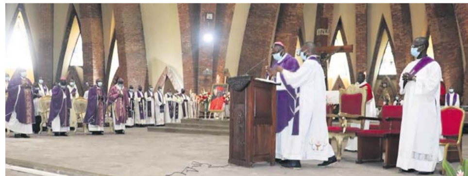
La célébration de la messe pour le cardinal Laurent Monsengwo Pasinya