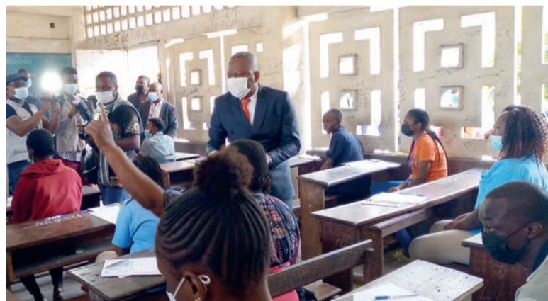
Lancement des épreuves par le ministre de l'Enseignement technique

Les épreuves écrites du Brevet d'études techniques (BET) ont été lancées le 20