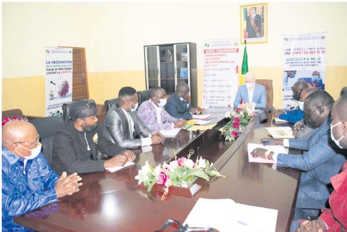
Le ministre de la Communication et des Médias en séance de travail avec le bureau exécutif national de l'UMC

parés. A cet effet, les artistes ont plaidé pour la promotion de la musique congolaise. L'UMC a sollicité que les médias congolais diffusent la musique dans les proportions suivantes : 90% de la musique nationale et 10% de la musique venue d'ailleurs comme l'instituait un arrêté ministériel par le passé. Le ministre Thierry Lézin Mougalla, tout en marquant son adhésion à cette légitime revendication, a évoqué le principe de l'offre et de la demande, tout en souhaitant ne pas y répondre sur la base de la proportionnalité des pourcentages suscités. Mais, il a instruit son cabinet pour faire face à cette demande pressante des artistes musiciens, d'initier une note circulaire à l'attention des médias publics congolais afin d'améliorer la fréquence de diffusion de leurs œuvres musicales en les favorisant autant que possible. « Nous allons assurer que les conditions de diffusion des œuvres musicales congolaises soient suffisamment claires et équitables avec la numérisation des régies d'antenne, après