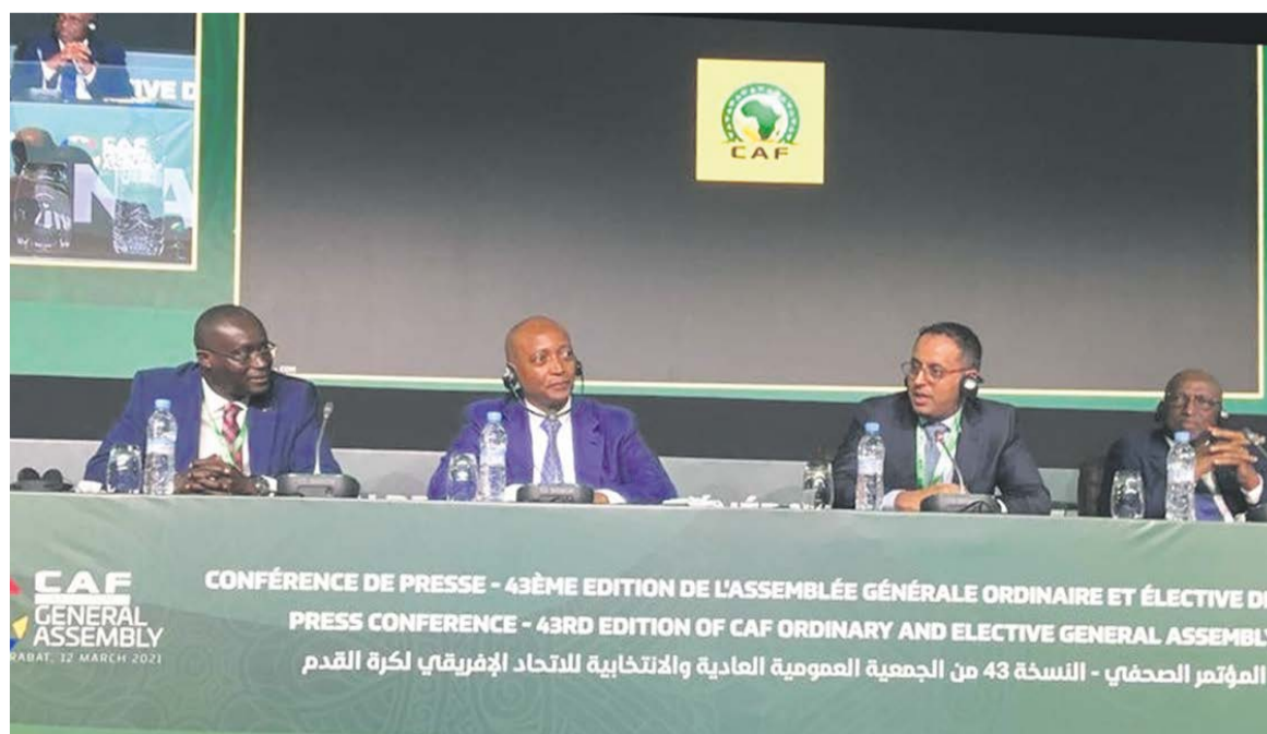
Des membres du comité exécutif/DR

Le point sur la bonne gouvernance et la mise en œuvre des