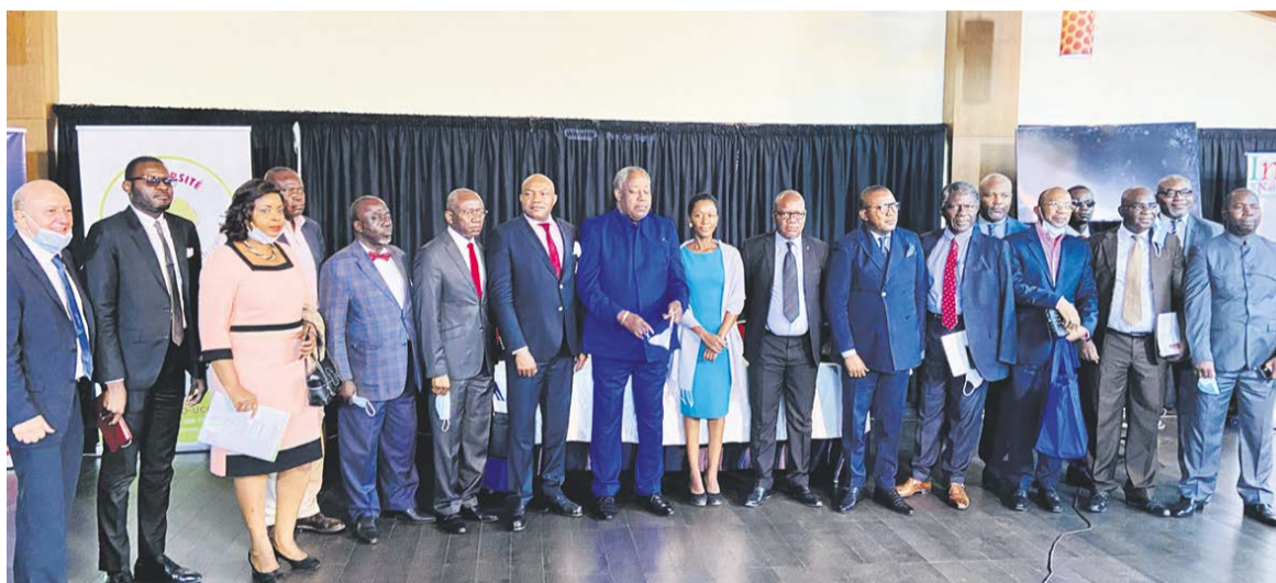
Les participants au lancement des matinales de l'intelligence économique

Pour cette première matinale ayant pour thème : « Comment faire face à l'encerclement cognitif en Afrique francophone ? Outils & Méthodes », il a été question d'enrichir les participants d'un savoir-faire en rapport avec l'« encerclement cognitif » et son fonctionnement. Au cœur de cette conversation stratégique, les effets di-