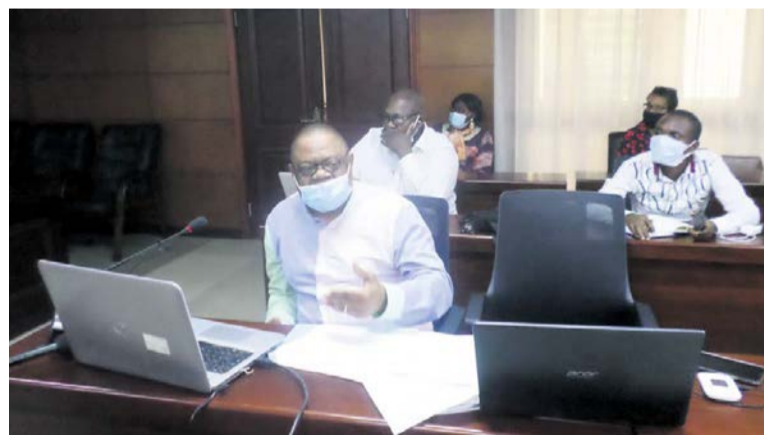
Les participants à la conférence

L'Observatoire congolais des droits de l'homme (OCDH) et d'autres organisations de la société civile ont procédé, le 20 juillet à Brazzaville au cours d'une conférence de presse, à la présentation du rapport des contributions déterminées au niveau national (CDN) dans le cadre de la lutte contre les changements climatiques.