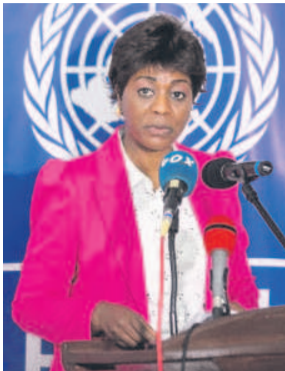
La ministre de l'Environnement, du Développement durable et du Bassin du Congo prononçant l'allocation de clôture de l'atelier

« Vos analyses, j'en suis sûre, vous ont permis d'établir un ordre de priorité des activités