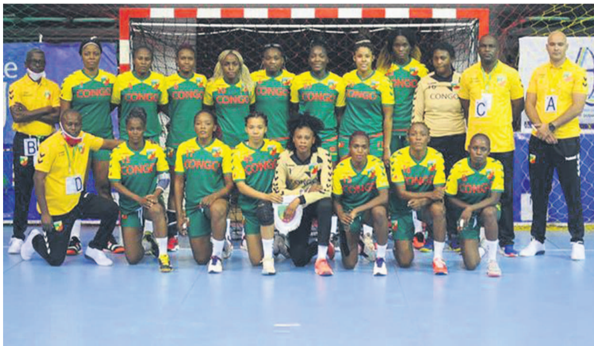
L'équipe nationale du Congo

Après plusieurs années d'absence, les Diables rouges seniors dames de handball marquent leur retour sur la scène internationale. Quatrième à la dernière édition de la Coupe d'Afrique, les filles du sélectionneur Younes Tatby vont devoir chercher à sortir tête haute du groupe F de cette plus grande compétition de la catégorie. Pour se faire, les Congolaises qui comptent cinq participations (1982, 1999, 2001, 2007 et 2009) sont invitées à doubler d'efforts et débiter d'ores et déjà les préparatifs afin de faire face au Danemark (2 e équipe en termes de participation, à savoir 21) et la Tunisie qui comptera neuf participations au coup d'envoi de la compétition. Le représentant asiatique qui complète ce groupe sera connu à la fin du tournoi