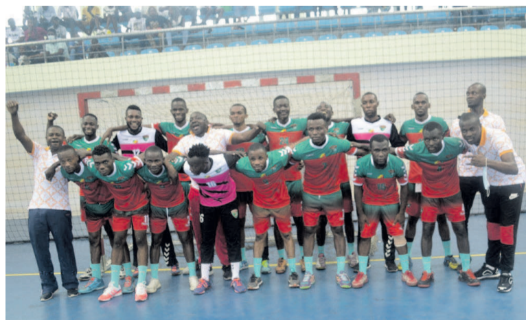
L'équipe de Caïman, championne de Brazzaville chez les hommes/Adiac

La finale des dames, pour sa part, a gardé son suspense jusqu'à la dernière minute. La DGSP, vice-championne de la précédente édition, a été secoué à la première mi-temps.