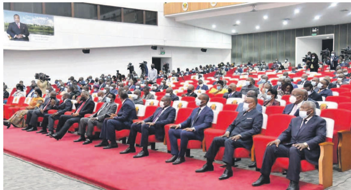
Les députés en plénière

Depuis la survenue de la pandémie de Covid-19 au Congo au mois de mars 2020 jusqu'à ce jour, le gouvernement a dépensé au moins 80 milliards FCFA pour la riposte. Ce montant dépasse largement