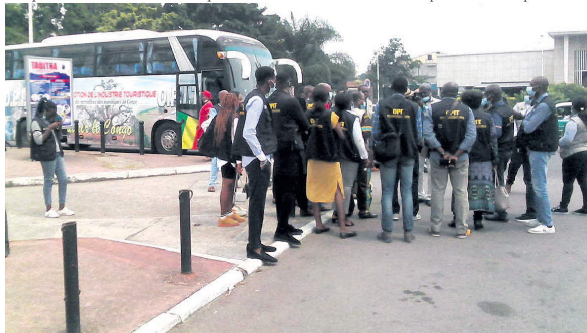
La gare centrale de Brazzaville était le point de départ de l'excursion