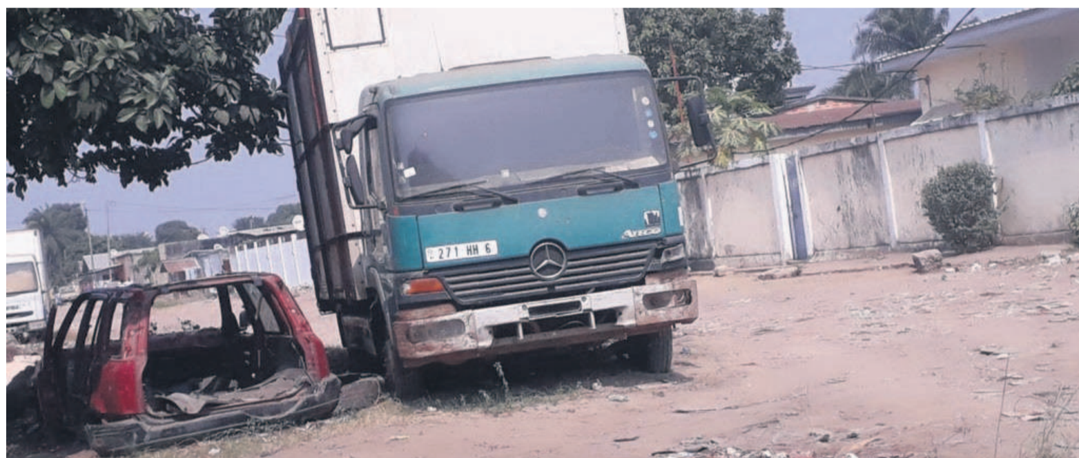
Des épaves de véhicules obstruent la circulation à Brazzaville

Le maire de Brazzaville, Dieudonné Bantsimba, a annoncé le 14 septembre au cours d'une rencontre avec les responsables des services de police et les administrateurs maires d'arrondissements l'organisation d'une opération destinée à désencombrer les voiries urbaines et à déguerpier les occupants illégaux du domaine public. Cette opération sera précédée par des actions de sensibilisation et de dissuasion. « Nous allons ensemble regarder par où faut-il commencer à mener les actions », a-t-il déclaré.