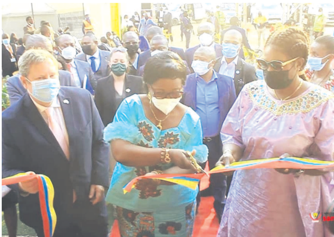
La vice- ministre de la Santé coupant le ruban symbolique

La vice-ministre en charge de la Santé publique a remercié le président de la République, Félix-Antoine Tshisekedi, qui fait du social et de la santé des Congolais une préoccupation majeure. Elle a, par ailleurs, remercié le Premier ministre «pour le dynamisme qu'il imprime à l'équipe gouver-