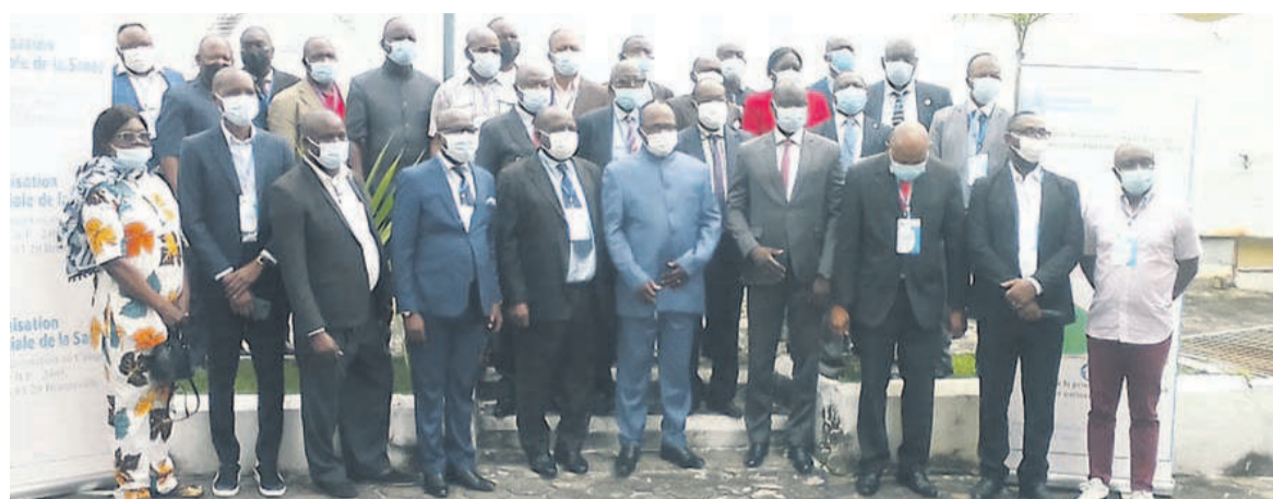
Les participants à l'atelier Adiac

Le ministre de la Santé et de la Population, en collaboration avec l'agence pays de l'Organisation mondiale de la santé (OMS), a ouvert, le 13 septembre à Brazzaville, un atelier de formation et d'harmonisation des contenus pédagogiques en prélude au recyclage des acteurs de quatre-vingt-treize aires de santé.