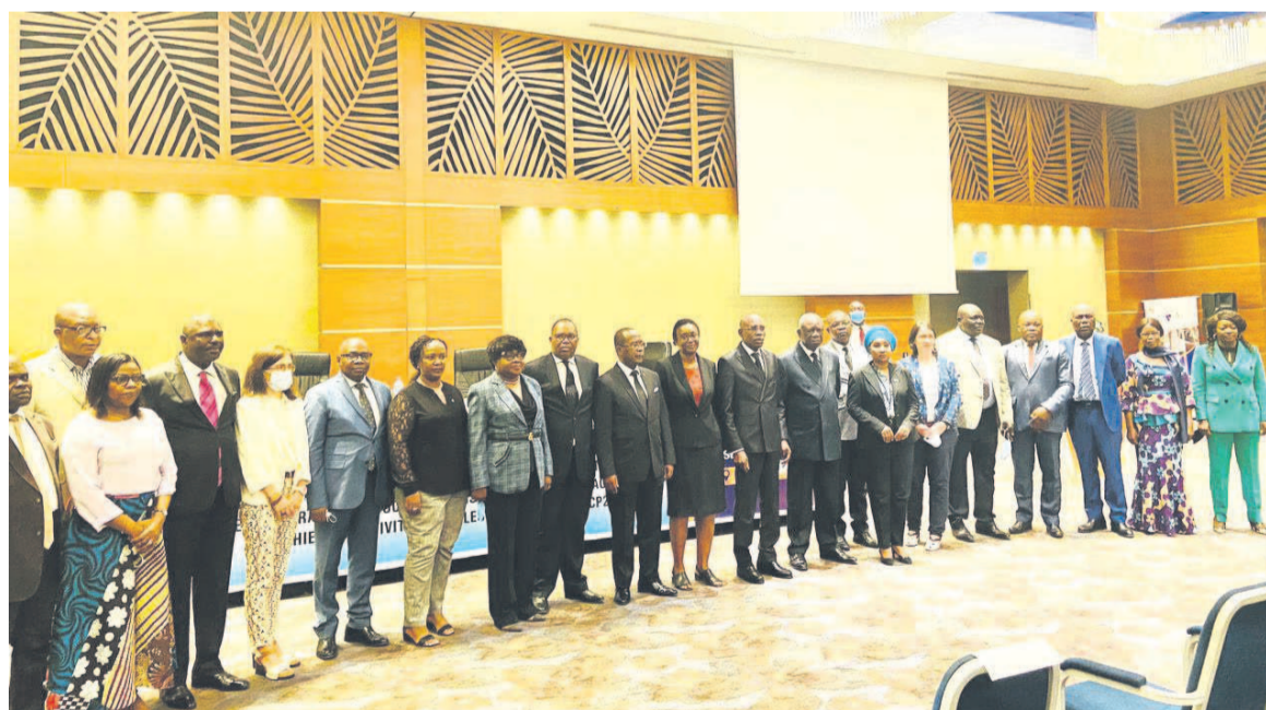
La photo de famille Adiac

cette nouvelle approche pédagogique, le Congo dispose désormais d'un cadre de référence dans lequel doivent s'encenser de façon harmonieuse et rationnelle toutes initiatives et actions pédagogiques destinées à soutenir le développement et à promouvoir le mieux-être des apprenants et de parents congolais.