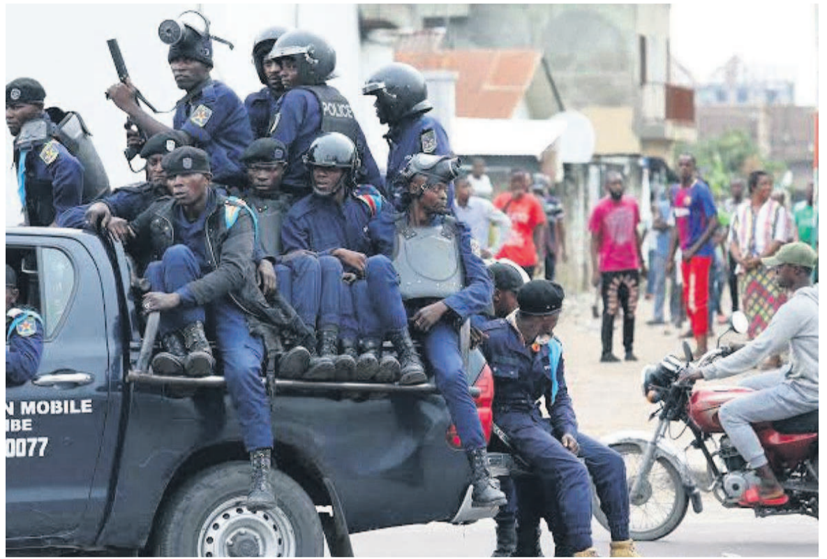
Une patrouille de la police