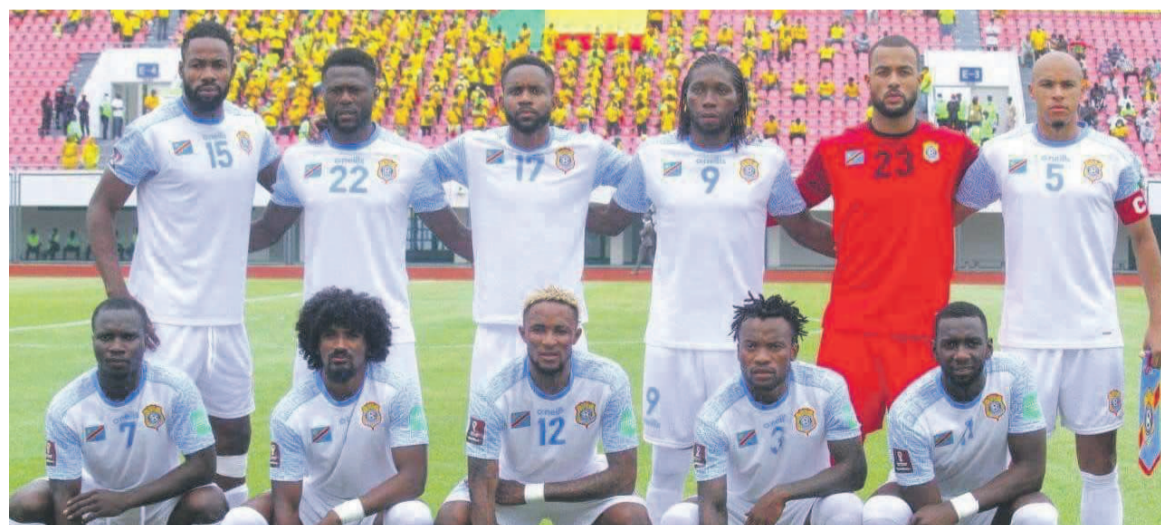
Les Léopards de la RDC avant d'affronter les Ecureuils du Bénin, le 6 septembre 2021, à Cotonou

On y retrouve six gardiens de buts, dix-sept défenseurs, treize milieux de terrain et dix-sept attaquants. Naturellement, cette liste sera réduite à une vingtaine de joueurs.