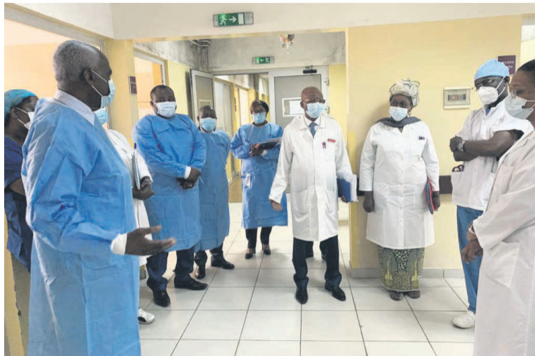
Le directeur général visitant les services du CHU