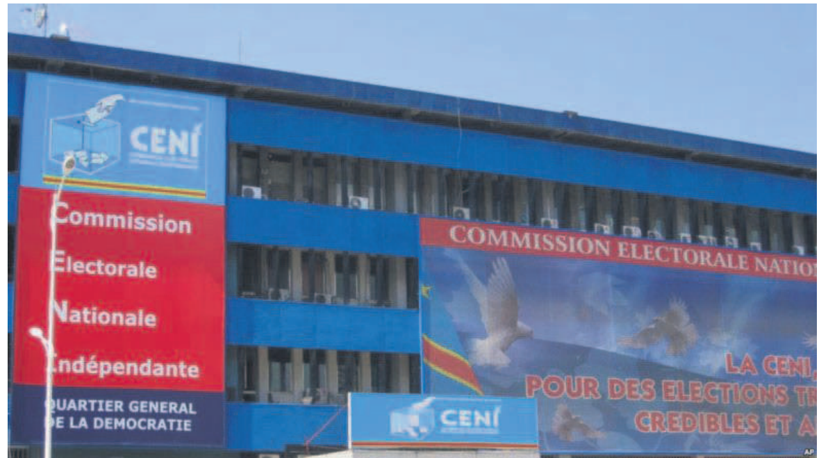
Le siège de la Céni