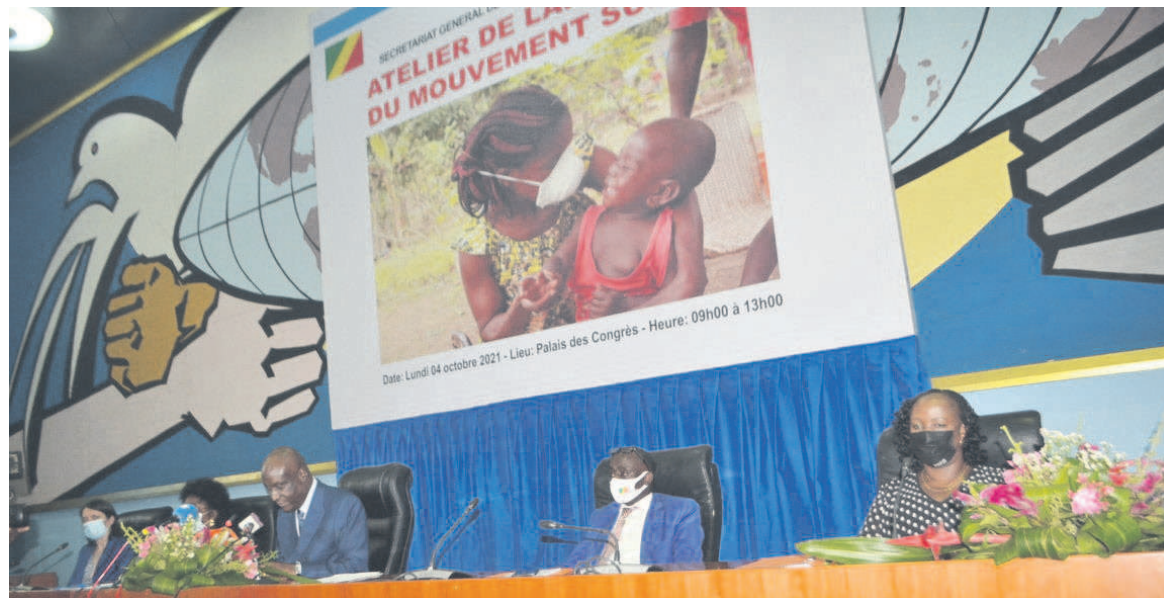
La tribune officielle lors du lancement du mouvement SUN 3.0/Adiac

« Au total, 10 200 ménages ont été enquêtés et 7 703 enfants âgés de 0 à 59 mois visités. On a noté l'insécurité alimentaire des ménages de 21 points au cours des cinq dernières années. Le retard de croissance chez les enfants s'est accentué de 6 points dans la même période, l'insuffisance pondérale s'est élevée de 3 points et