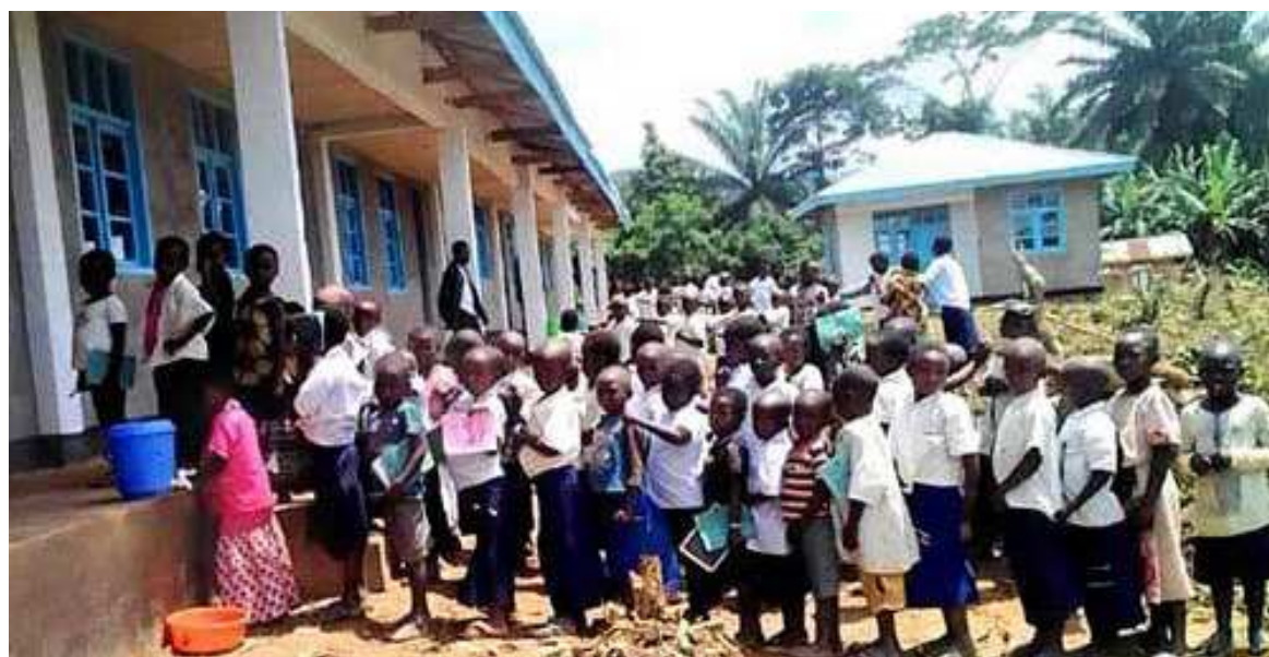
Des élèves à l'entrée des salles de classe

Près de deux millions d'élèves nouvellement inscrits vont intégrer, cette année scolaire, à la faveur du Programme de la gratuité de l'enseignement de base, le système éducatif national afin de bénéficier de ses avantages.