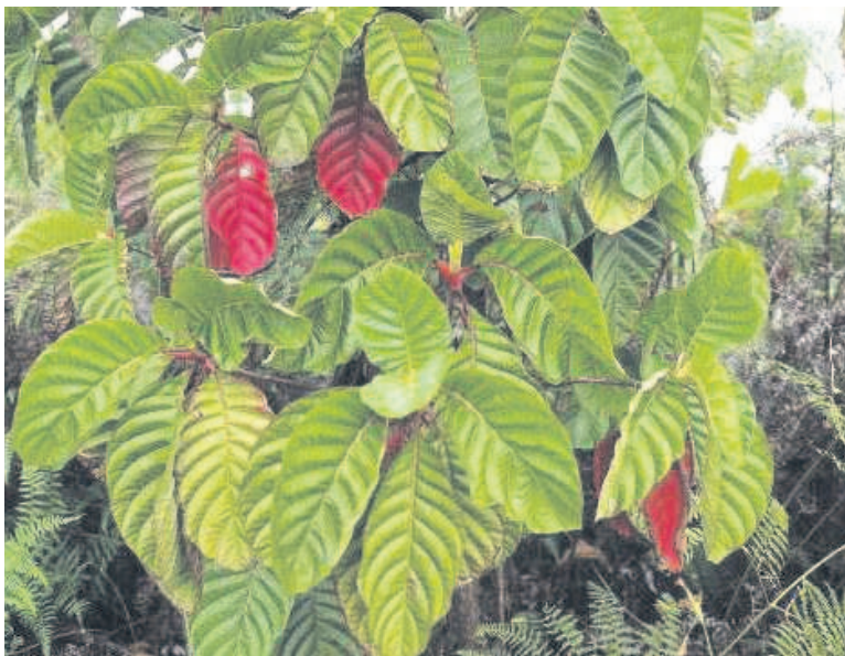
Le quinquina, un arbre précieux pour la médecine

Les milieux pharmaceutiques implorent la primature de protéger plus activement l'industrie locale pour tirer un meilleur profit du quinquina, un arbre dont les écorces permettent la fabrication de la quinine, un produit phare dans la lutte contre le paludisme. L'exploitation du quinquina bénéficie davantage à l'étranger faute d'une capacité nationale de transformation à la hauteur de l'immense potentiel disponible.