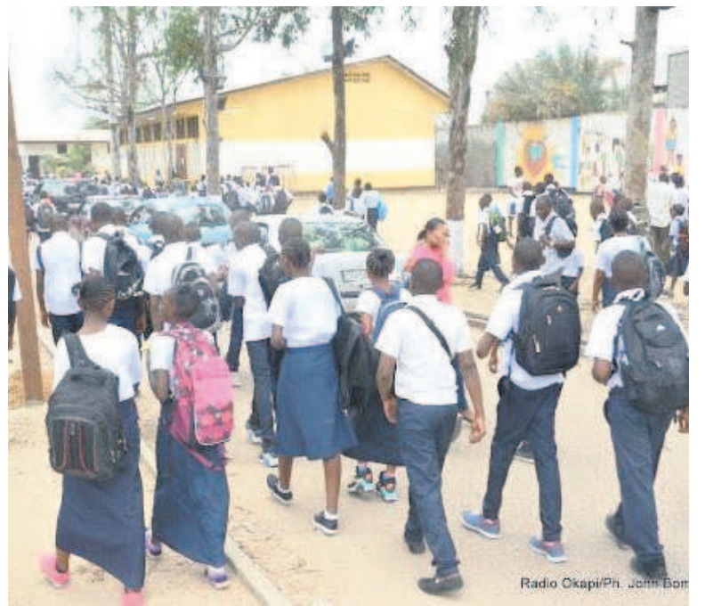
Des élèves à la sortie des classes