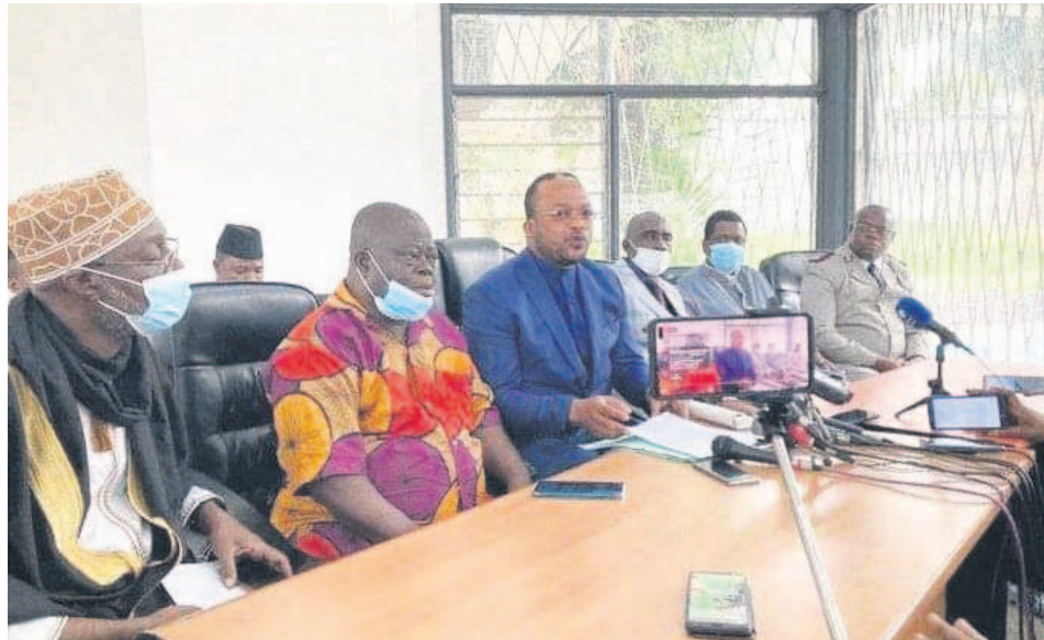
Des chefs des confessions religieuses en réunion