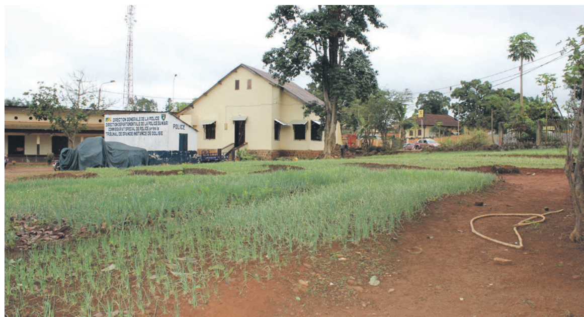
Des sillons de ciboule dans la cour du Palais de justice de Dolisie