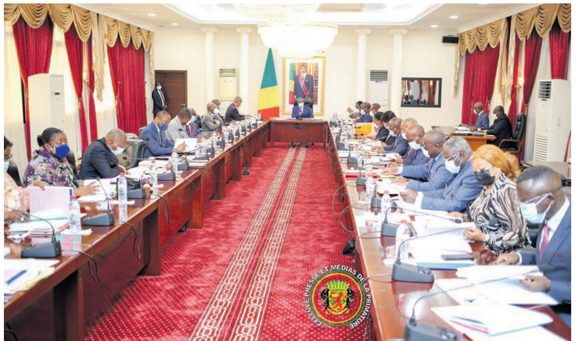
Les participants à la signature du protocole d'entente

A travers ce protocole d'entente, le Congo envisage intégrer, par le biais d'un partenariat public-privé, les filières internationales des biocarburants d'Eni, afin de réduire les émissions de gaz à effet de serre, et de stimuler la création de nouvelles opportunités d'emploi. Dans ce cadre, les deux parties souhaitent évaluer le potentiel de culture de la plante de ricin pour extraire l'huile de ses graines et l'utiliser comme matière première pour les bioraffineries. Cette culture sera faite