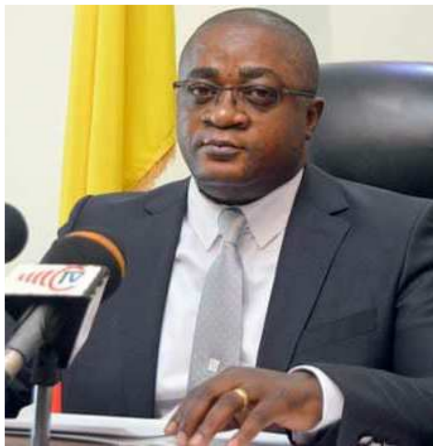
Le ministre de la Justice Aimé Ange Wilfrid Bininga

« Nous avons appris que certains professionnels de santé vendent des Pass sanitaires, d'autres les tripotent avec les outils informatiques actuels. Nous sommes en train de travailler pour