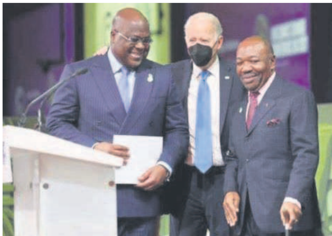
Félix Tshisekedi, Joe Biden et Ali Bongo

Au cours du panel auquel d'autres chefs d'Etat africains ont pris part, Félix Tshisekedi a lancé un appel à l'unisson à tous les leaders mondiaux pour la sauvegarde des ressources naturelles de son pays dont la contribution à l'effort de lutte contre le réchauffement climatique s'avère très capitale. « La République démocratique du Congo, mon pays, avec ses massifs forestiers, ses tourbières et ses ressources en eau et en minerais stratégiques se présente comme un pays solution à la crise climatique », a-t-il déclaré, du haut de la tribune de ce panel en présence du président américain, Joe Biden, du Premier ministre Johnson (UK) et du président Ali Bongo également invités. Il a poursuivi en appelant les leaders et les décideurs du monde entier « à agir en-