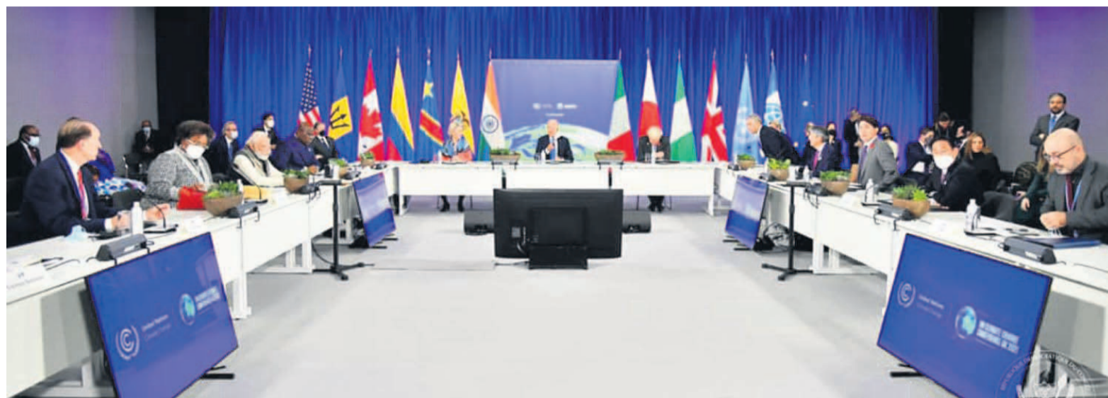
Vue d'un panel organisé en marge de la COP26

Profitant de cette tribune, Félix-Antoine Tshisekedi a exposé les atouts naturels dont regorge son pays, se-