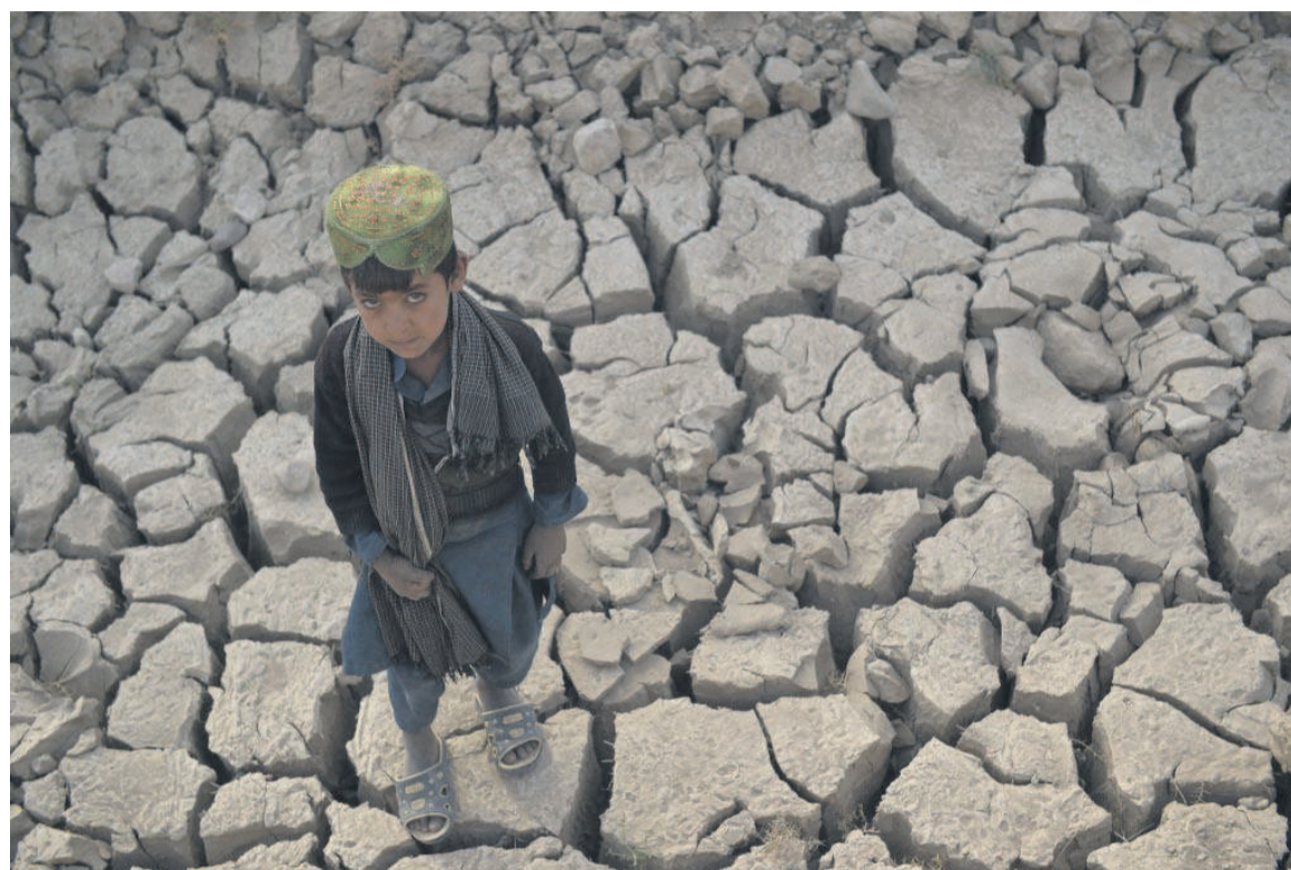
L'accès à l'eau potable, une problématique augmentée par le changement climatique

Le processus serait neutre en carbone si la quantité prélevée et la quantité libérée étaient identiques. Une entreprise ou un pays peut également atteindre