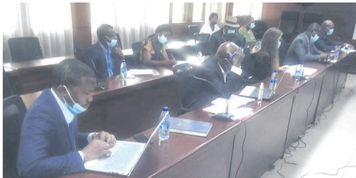
Les parties prenantes au projet APV-FLEGT/Adiac

À en croire Childeric Noël Ntamba, le chef de division