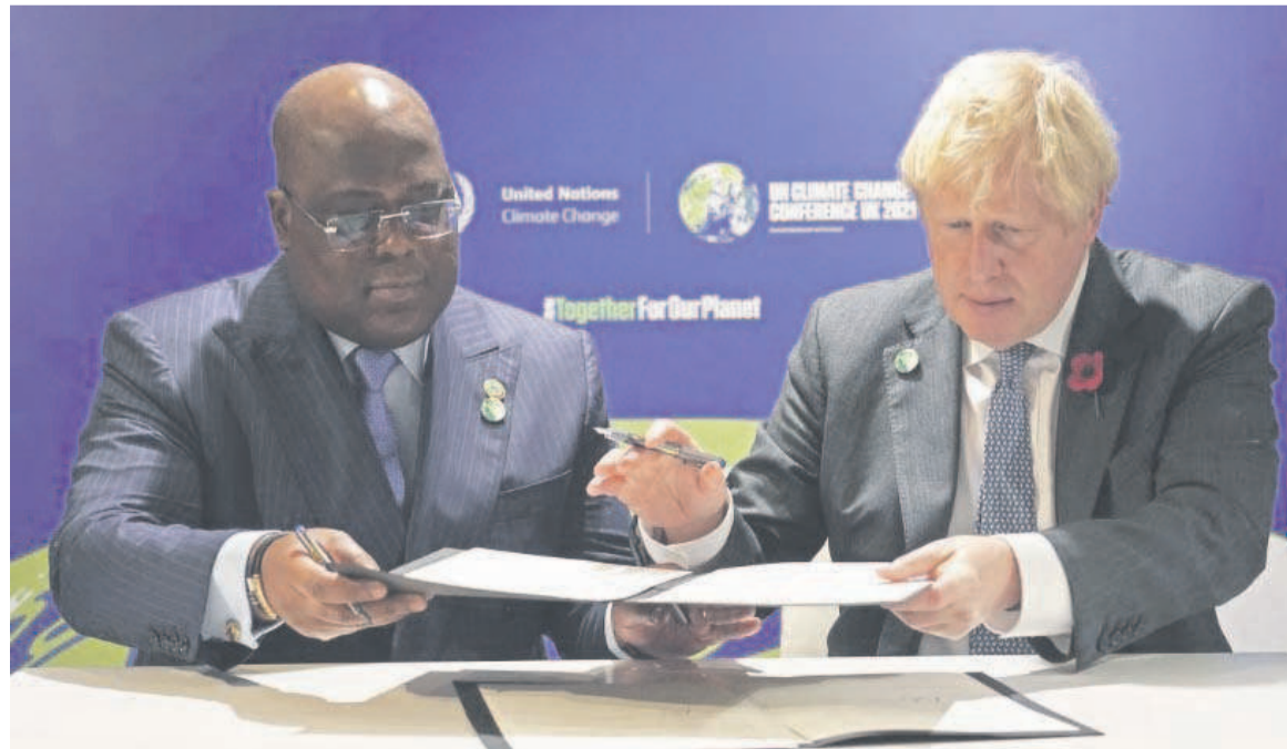
Etienne Tsisekedi et Boris Johnson paraphe l'accord à l'instar de plus de 80 pays

Ce sont plus de 80 pays, dont ceux de l'Union européenne et les Etats-Unis qui se sont engagés à réduire leurs émissions de méthane, puissant gaz à effet de serre, de 30% d'ici 2030 par rapport à 2020, a annoncé la présidente de la Commission européenne. « Le méthane est l'un des gaz que nous pouvons réduire le plus vite », a souligné Ursula Von der Leyen aux côtés du président américain Joe Biden, rappelant que ce gaz est responsable d'environ 30% du réchauffement de la planète depuis la Révolution industrielle.