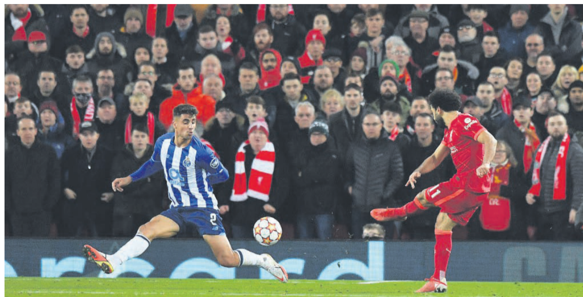
Sixième but lors de cette campagne européenne pour l'Égyptien Salah, qui a doublé le score pour les Reds à Porto

Mais la copie brouillonne rendue par l'équipe de Mauricio Pochettino, au centre des attentions de la presse