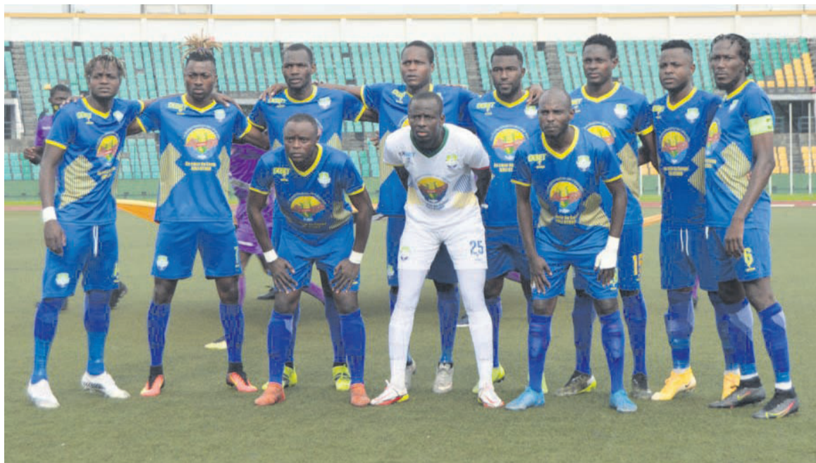
AS Otohô joue sa dernière carte face à Gor Mahia/Adiac

Le Gor Mahia football club faut-il le rappeler, mène actuellement le championnat kenyan avec 14 points après six journées. Le club a gagné quatre matches contre deux nuls alors que l'AS Otohô attend toujours la reprise du championnat. Il