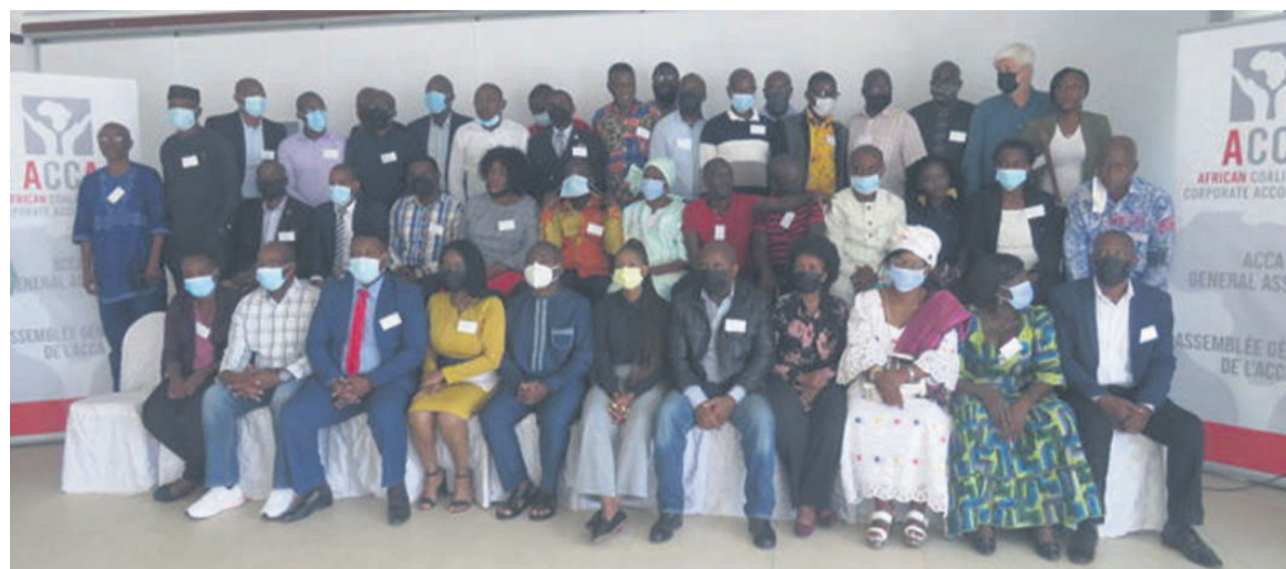
Photo de famille des participants à l'ouverture des travaux