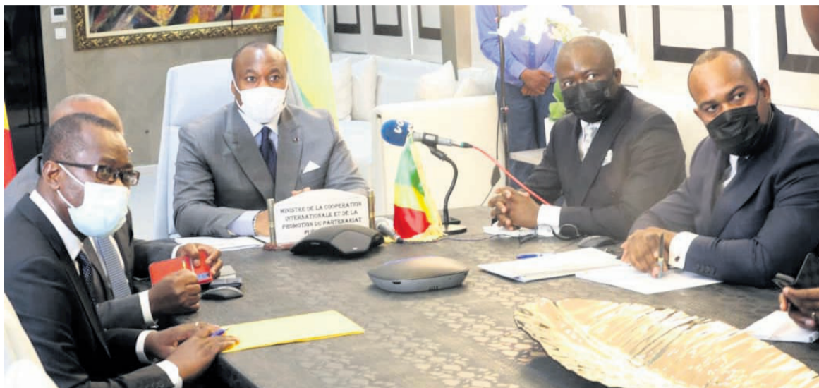
La partie congolaise lors de la 5 e grande commission mixte de coopération entre le Congo et le Rwanda/DR

Au plan juridique, la session de travail a été une occasion pour les deux parties de faire le point sur le processus de ratification des accords signés dans le domaine de la justice et d'évaluer la mise en œuvre des accords en vigueur. Outre cela, un regard a également été porté sur les accords déjà finalisés relevant des domaines des affaires foncières, de l'habitat, de la faune et des aires protégées, des petites et moyennes entreprises et de l'artisanat, de la diplomatie, des finances. « La signature, au cours de la présente session, de plusieurs accords de coopération et les diverses conclusions auxquelles les deux parties ont abouti, qui constitue désormais notre programme d'action au cours des deux prochaines années, participe de notre volonté de consolider nos relations économiques, commerciales et techniques en vue d'insuffler une dynamique nouvelle à notre coopération que nous voulons fructueuse et mutuellement avantageuse à la hauteur des potentialités et des opportu-