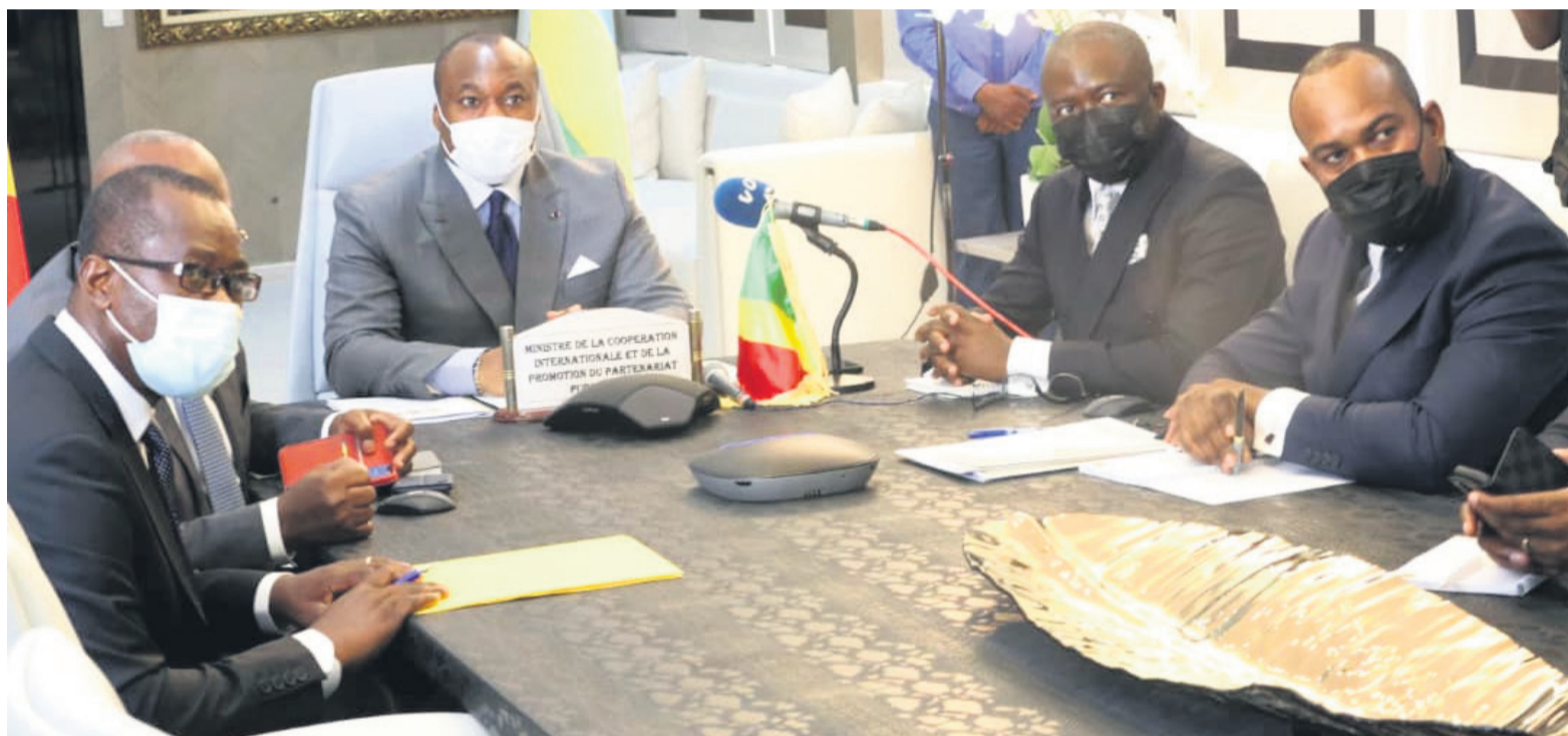
La partie congolaise lors de la 5 e grande commission mixte de coopération entre le Congo et le Rwanda

A l'issue de leur 5 e commission mixte, les deux pays se sont engagés à renforcer leurs liens de coopération avec la signature des accords dans divers secteurs, notamment foncier, militaire, technique, enseignement supérieur, évasion fiscale, ainsi que l'exemption de visas pour les porteurs de passeports diplomatique et de service.