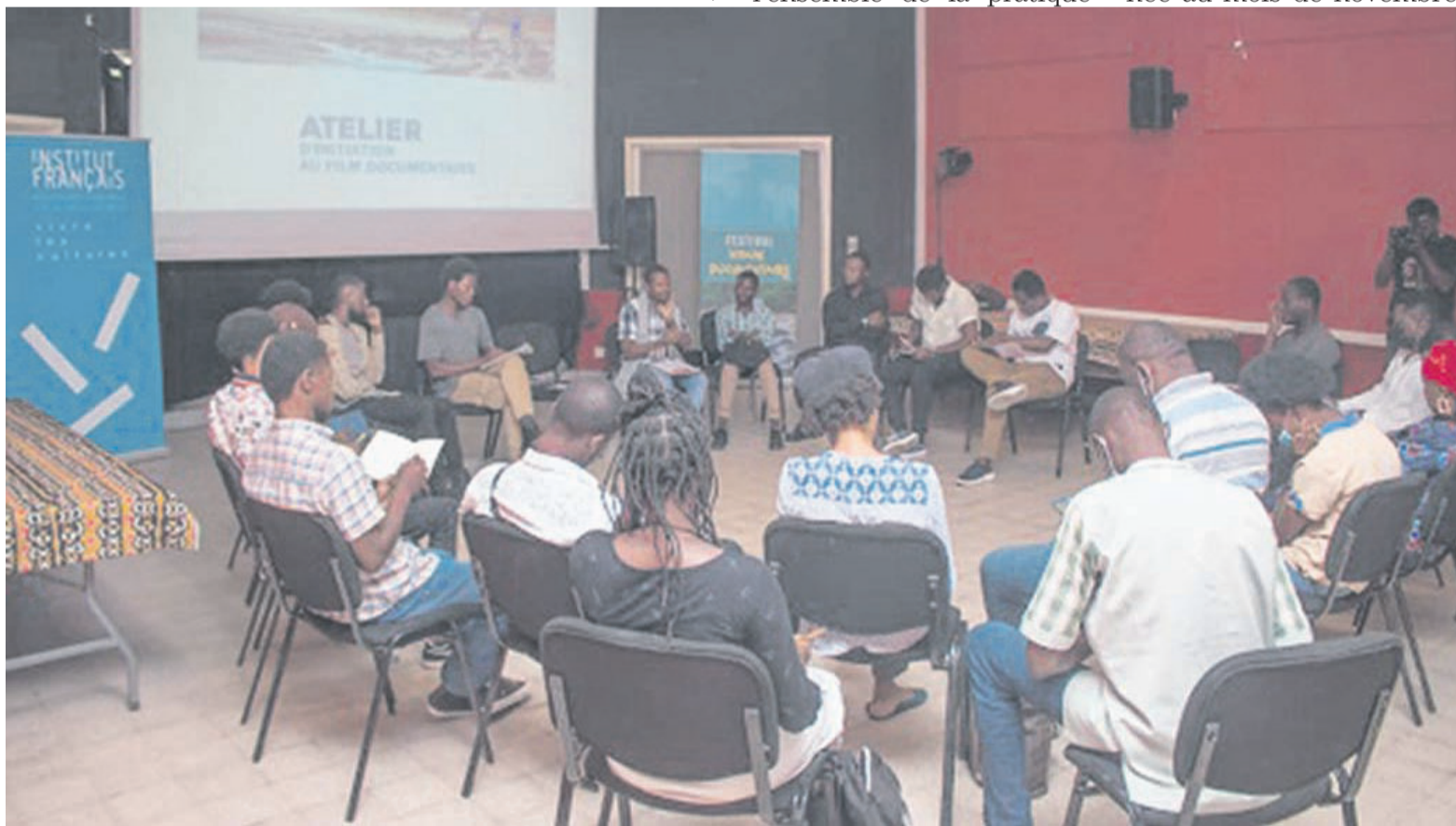
Une soirée du festival Vision documentaire à la Halle de la Gombe

D.B. : Très franchement, c'est assez timide. C'est vrai qu'il faut considérer qu'il y a eu cassure durant trois ans mais aussi le temps de caler définitivement les choses avec notre partenaire officiel, nous avons eu très peu de temps pour communiquer et atteindre un maximum de gens. La fréquentation était timide mais nous espérons qu'au fur et à mesure, le public reprendra goût, reviendra chaque année au mois de novembre.