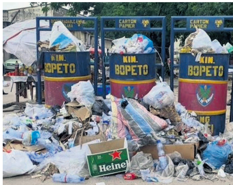
Des poubelles implantées dans le cadre de Kin-Bopeto DR

Le projet de 135 millions de dollars américains est financé par le groupe canadien Biocrude Technologies.