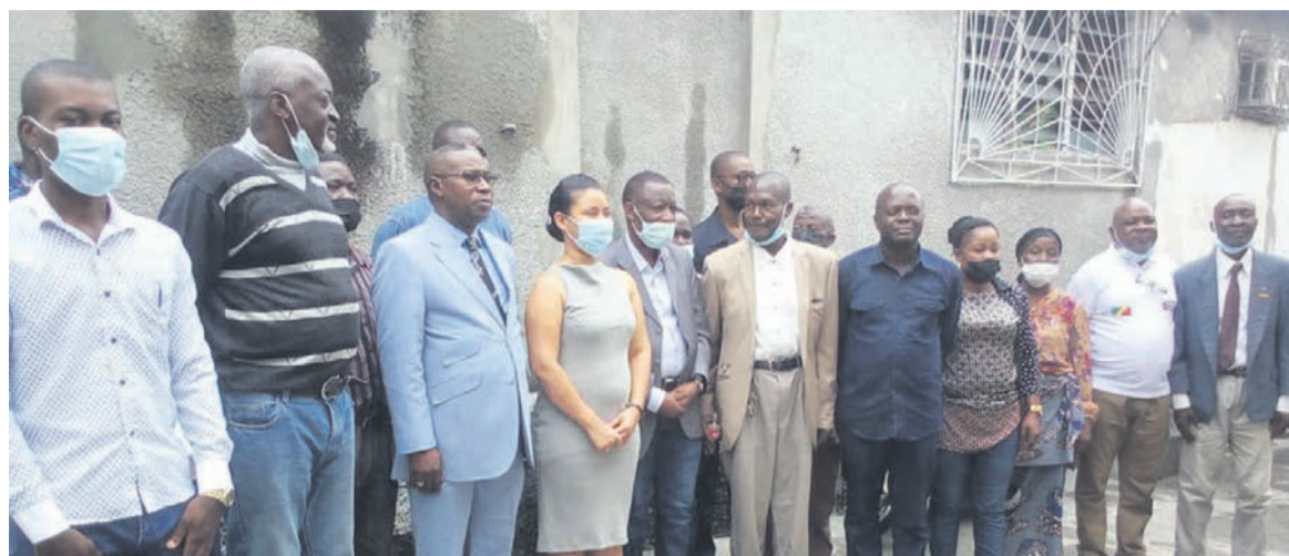
Les participants

L'événement, célébré le 25 novembre au siège de l'Association congolaise d'amitié entre les peuples (Acap) à Brazzaville, a été marqué, entre autres, par une exposition-photos et des témoignages des anciens étudiants congolais à Cuba.