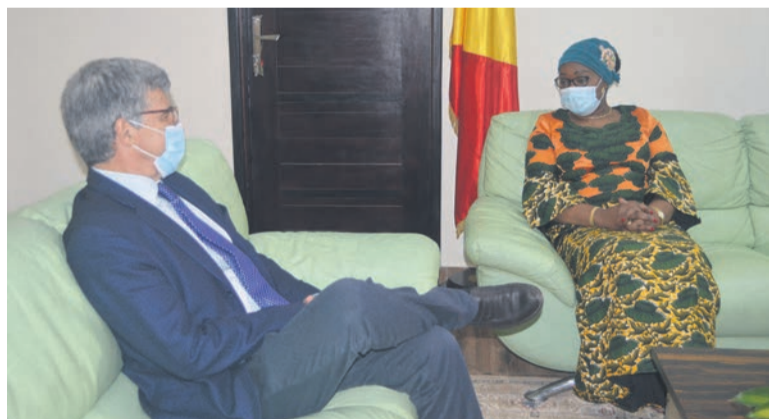
Échange entre l'ambassadeur de l'UE et la ministre chargée de la Recherche et de l'Innovation

L'UE disposée à accompagner le secteur agricole congolais