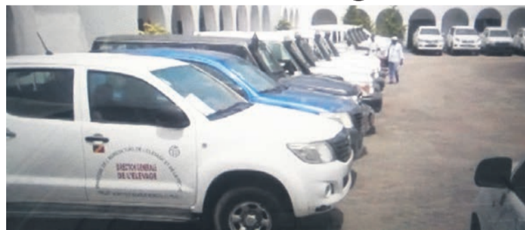
Les véhicules rétrocedés/Adiac

64 véhicules rétrocedés au ministère de l'Agriculture La gendarmerie nationale a remis, le 22 novembre, à Brazzaville les clés de trente-sept véhicules saisis au ministre de l'Agriculture, de l'Élevage et de la Pêche. Vingt-deux autres vont être restitués aux directions départementales. Tous ces moyens de l'État se trouvaient entre les mains de certains