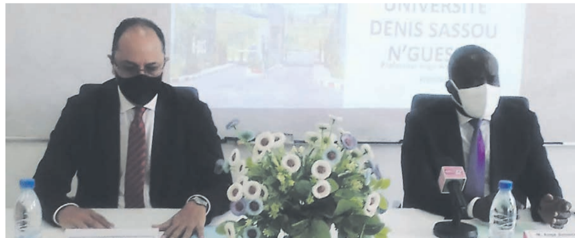
Echanges interactifs entre les représentants de l'AUF et de l'UDSN