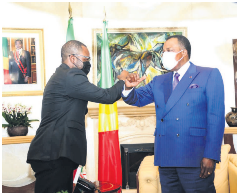
Denis Sassou N'Guesso et Gabriel Mbaga Obiang Lima