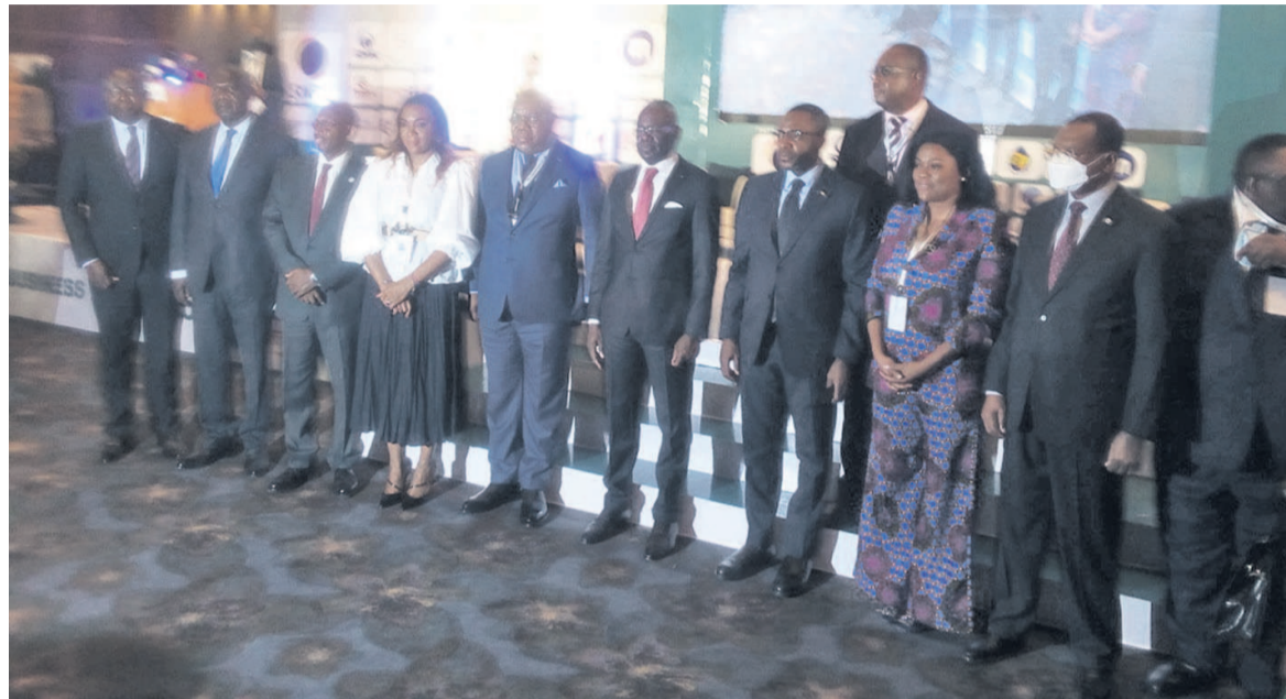
Les participants au forumAdiac

En acceptant d'abriter l'évènement, le gouvernement congolais veut jouer sa partition dans le processus d'intégration africaine et d'un secteur porteur qu'est l'énergie. La présence de près d'une centaine d'acteurs sous-régionaux traduit l'engagement des pays de la Cémac à œuvre ensemble, a salué le Premier ministre, Anatole Collinet