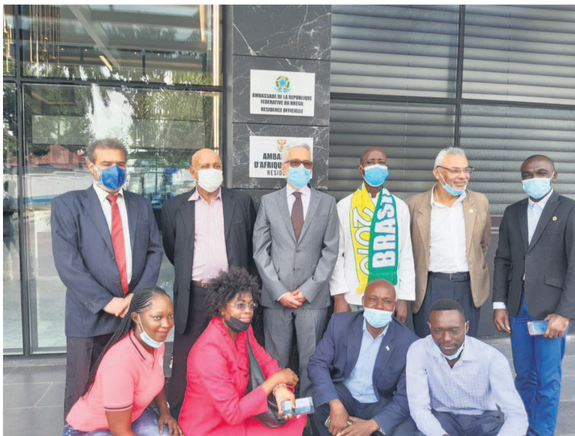
Renato Soares Menezes et le personnel de l'ambassade devant la plaque

L'ambassadeur de la République fédérative du Brésil auprès de la République du Congo, Renato Soares Menezes, a procédé le 22 février à la pose de la plaque et à la levée du drapeau officialisant l'occupation de sa nouvelle résidence installée au sixième niveau de l'immeuble Acacia.