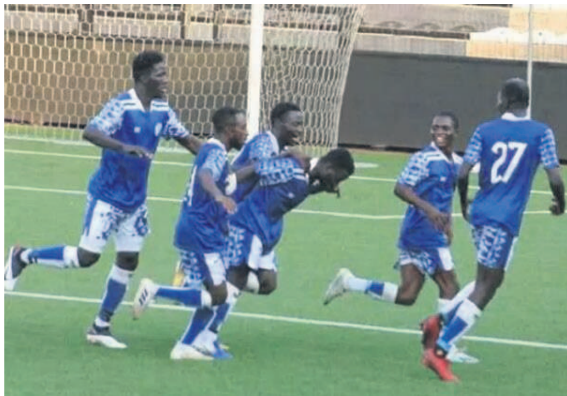
Don Bosco dans le top 5 du championnat de la Linafoot

C'est la deuxième victoire de suite pour les Salésiens après le succès d'un but à zéro au match précédent face à l'US Tshinkunku, le 18 février sur la même aire de jeu du stade TP Mazembe, une réalisation de