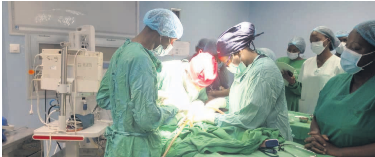
Les opérations chirurgicales gratuites des malformations ont débuté au CHU

L'association « SOS sourire Congo », en partenariat avec le Centre hospitalier universitaire (CHU) de Brazzaville, organise du 21 au 26 février une campagne de chirurgie gratuite des malformations cranio-faciales comme le bec de lièvre.