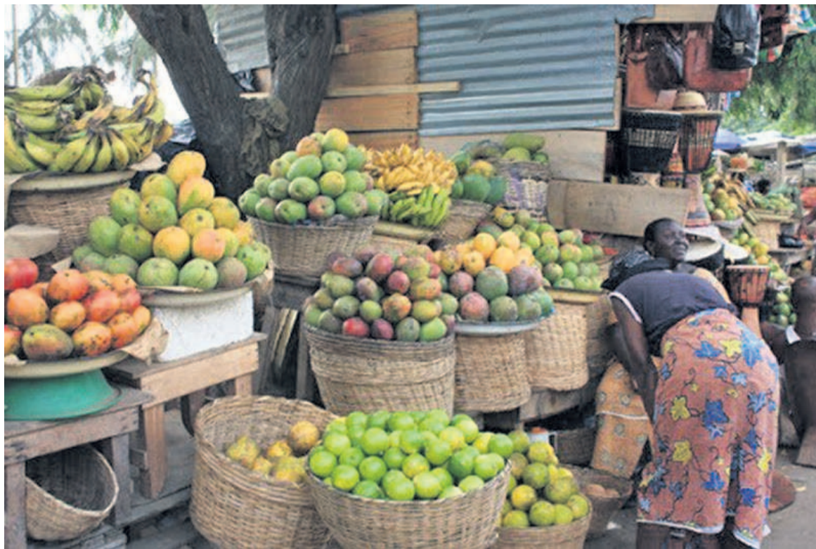
Étalage des fruits et légumes

L'indice national harmonisé des prix à la consommation est un indicateur synthétique qui permet de calculer le niveau de l'inflation au plan national, à partir de la variation moyenne des prix des biens et services constituant la dépense monétaire de consommation finale des ménages. À Brazzaville, les derniers chiffres de l'Indice des prix de décembre 2021 s'élèvent à 103,8 points. « Il s'est accru de 0,1% par rapport au mois précédent et de 0,6% en augmentation cumulée sur douze mois. La variation en moyenne sur douze mois exprimant le suivi mensuel du taux d'inflation annuel se situe à 1,6% », résume