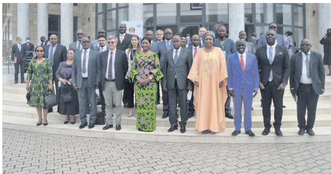
Les parties prenantes à l'opérationnalisation du Centre d'excellence d'Oyo

L'Organisation des Nations unies pour le développement industriel (Onudi) est un des partenaires impliqués dans ce projet. Elle est en mesure d'apporter l'appui technique nécessaire car le réseau mondial des centres d'énergies renouvelables géré par l'Onu-