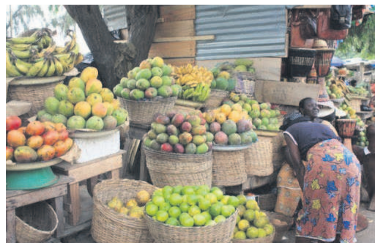
Étalage des fruits et légumes

L'indice national harmonisé des prix à la consommation a bondi de 1,5% depuis décembre 2021, poussant à une pression inflationniste de plus de 2%. La flambée des prix touche principalement les produits alimentaires et les boissons non alcoolisées, selon l'Institut national de la statistique (INS). « Il s'est accru de 0,1% par rapport au mois précédent et de 0,6% en augmentation cu-