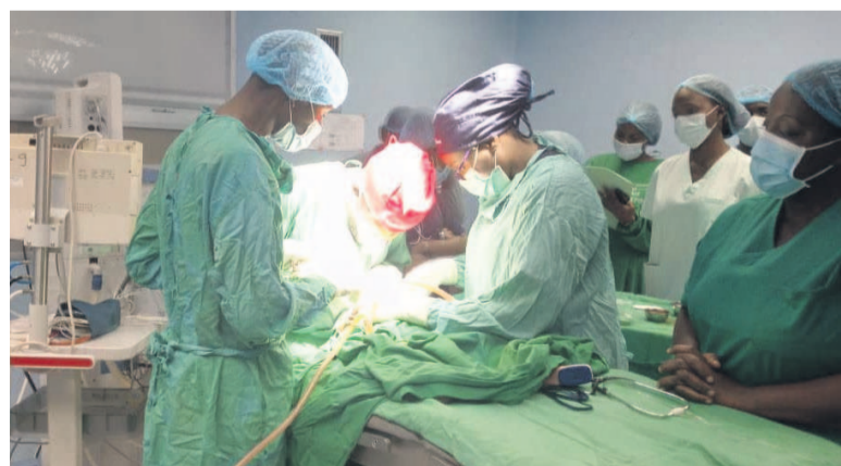
Les opérations chirurgicales gratuites des malformations ont débuté au CHU/DR

En partenariat avec le Centre hospitalier et universitaire de Brazzaville, l'association « SOS sourire Congo » a lancé hier une campagne gratuite de chirurgie des malformations cranio-faciales qui s'étendra jusqu'au 26 février prochain. Les opérations vont porter sur les réparations des déformations faciales et des visages des personnes traumatisées et balafrees.