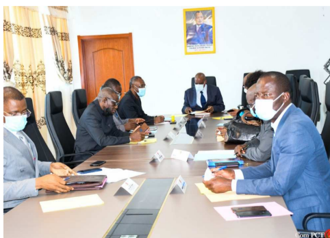
Une vue des membres du secrétariat permanent du PCT/DR

La direction politique du Parti congolais du travail (PCT) informe les candidats aux élections législatives et locales que la réunion du comité d'investissement, préalablement prévue du 24 au 26 février 2022, est reportée à une date ultérieure.