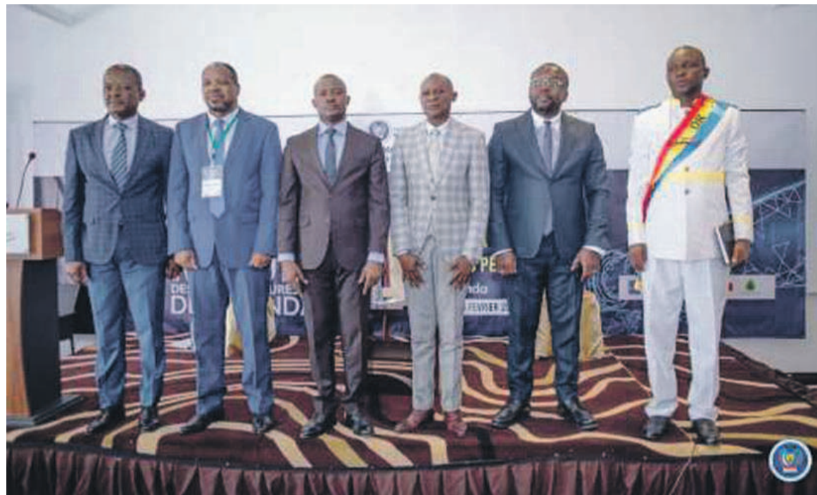
Des participants à la table ronde

Le gouverneur s'est réjoui de ce qu'il en découlera " qui n'est autre que la recherche des solutions au regard des conflits récurrents qui rongent la cohabitation pacifique". Épinglant l'absence d'une base réelle de collaboration ayant engendré des conflits d'intérêt, l'exécutif provincial a évoqué le problème lié à la pollution qui contribue à la dégradation de l'environnement. Il n'a