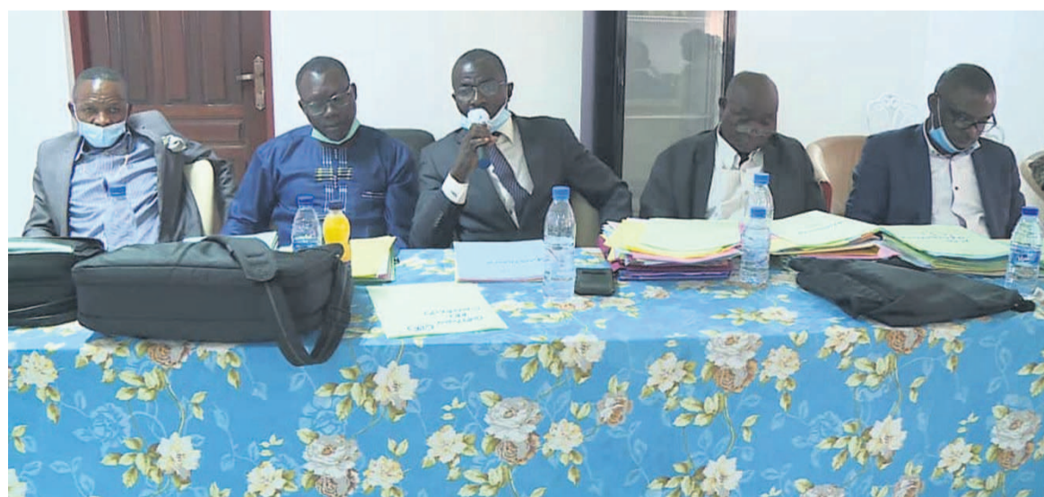
Les experts débattant sur la mise en forme du contenu d'enseignement de l'INJS/DR

En 2018, lors du dernier conseil technique, l'INJS avait su loger les disciplines dans les plaquettes académiques. Ces disciplines avaient certes des volumes horaires requis mais manquaient de document dans lequel était précisé le contenu de ce qui s'enseignait dans chaque discipline. Face à l'inexistant, l'établissement a fait un choix fort, celui d'impliquer tous les intervenants à produire le contenu des enseignements dispensés aux stagiaires.