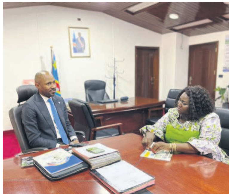
Le ministre Patrick Muyaya s'entretenant avec Mme Grâce Ngyke

Dans le cadre des activités marquant la célébration de la journée internationale de la Femme, l'Association congolaise des femmes journalistes de la presse Écrite (Acofepe) et l'Union congolaise des femmes de médias (Ucofem) organisent du 09 au 11 mars à Kinshasa, avec l'appui technique d'Internews, la troisième édition de la foire des femmes de médias.