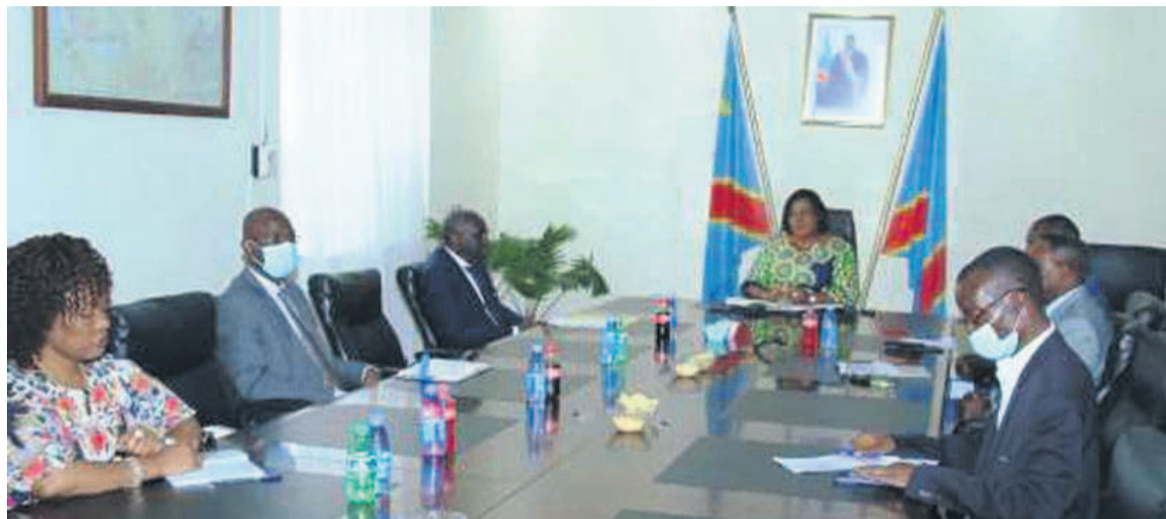
Rose Mutombo en séance de travail avec les délégués du HCR et de la Monusco/DR

La première délégation à être reçue le 2 mars par la ministre d'État, ministre de la Justice et Garde des sceaux, Rose Mutombo Kiese, a été celle du Haut Commissariat des Nations unies pour les réfugiés (HCR), conduite par sa représentante en République démocratique du Congo (RDC) Liz Ahua.