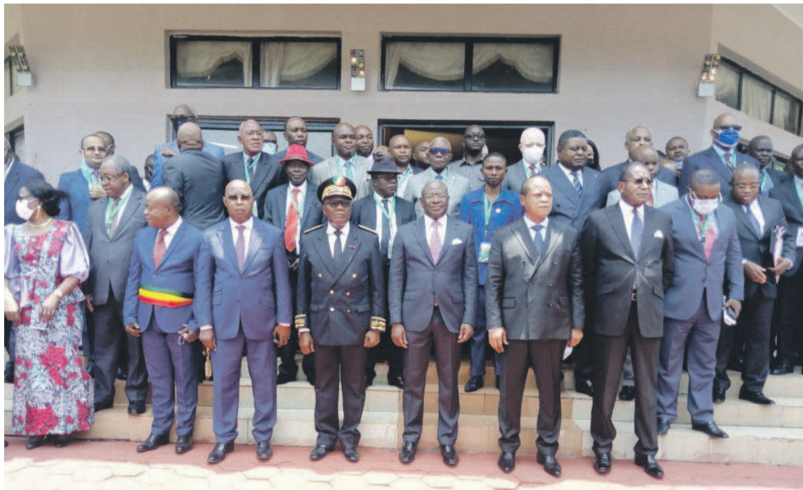
Des participants à l'ouverture de la concertation d'Owando/Adiac

En outre, Anatole Collinet Makosso a rappelé les concertations politiques antérieures qui ont marqué, selon lui, un pas important dans la gouvernance électorale. « Au même titre que la démocratie, l'amélioration du processus électoral est une quête permanente », a-t-il fait re-