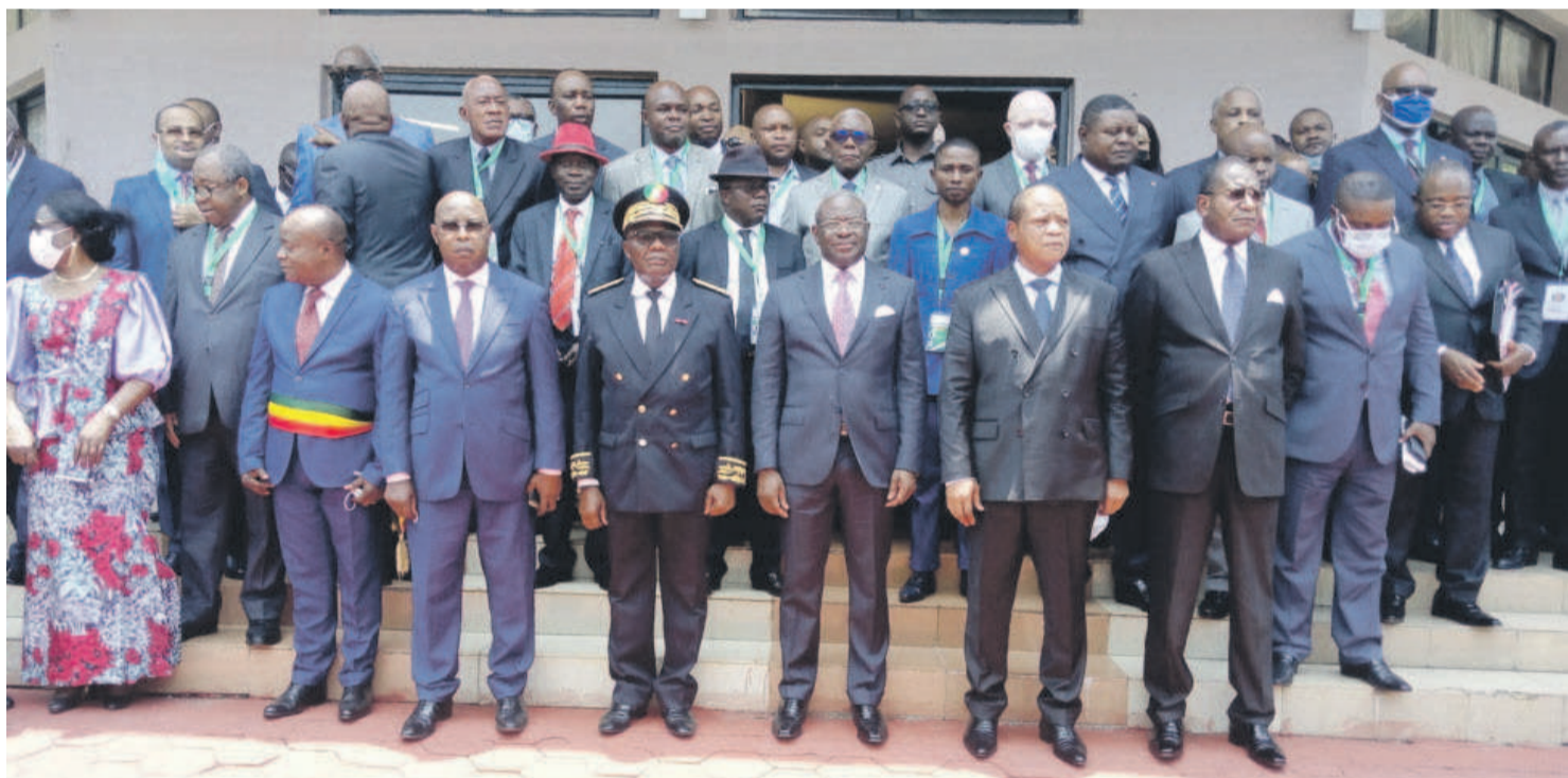
Des officiels présents aux assises d'Owando/Adiac