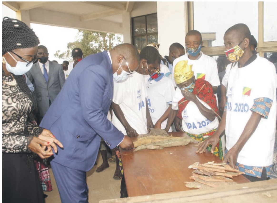
Les autochtones exposant les produits de la pharmacopée en présence du ministre de la Justice

En réponse, le ministre a rappelé les initiatives déjà réalisées en la matière en insistant sur le Plan national d'amélioration de la qualité de vie de ces derniers pour la période 2022-2025 que le gouvernement exécute actuellement. L'accès des peuples autochtones à l'emploi y figure en bonne place. Une mesure qui va de pair avec l'accès gratuit de ces derniers à l'éducation allant des cycles préscolaire, primaire jusqu'au supérieur. Pas seulement pour l'enseignement général mais aussi