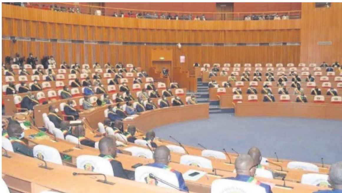
Les députés lors de l'adoption du projet de loi

violences en 2021 au Congo Lors de l'adoption de la loi, les Commissions santé, affaires sociales, famille et genre des deux chambres parlementaires se sont appuyées sur les résultats d'une enquête qui révèle que 161 femmes ont été victimes des viols divers en 2021.