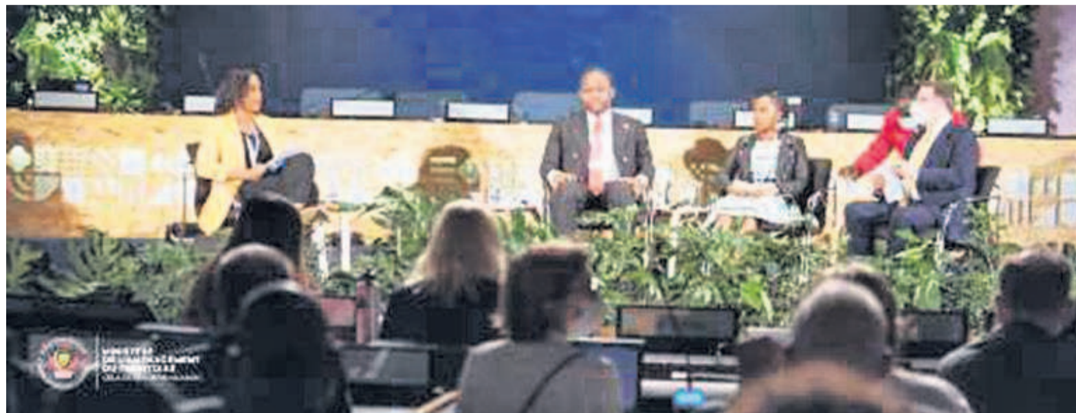
Guy Loando Mboyo confirme l'engagement de la RDC pour la réalisation des ODD/DR

Me Guy Loando Mboyo a pris la parole comme orateur du panel qui avait pour thème « Renforcer l'action en faveur de la nature pour atteindre les objectifs de développement durable ». Il a expliqué les efforts du gouvernement congolais pour la matérialisation des engagements pris dans le cadre des objectifs durables de développement. Le ministre d'État a déclaré que son pays est conscient de l'immensité de son territoire avec une population de plus de cent millions d'habitants et a mis en place un programme ambitieux de développement à la base de