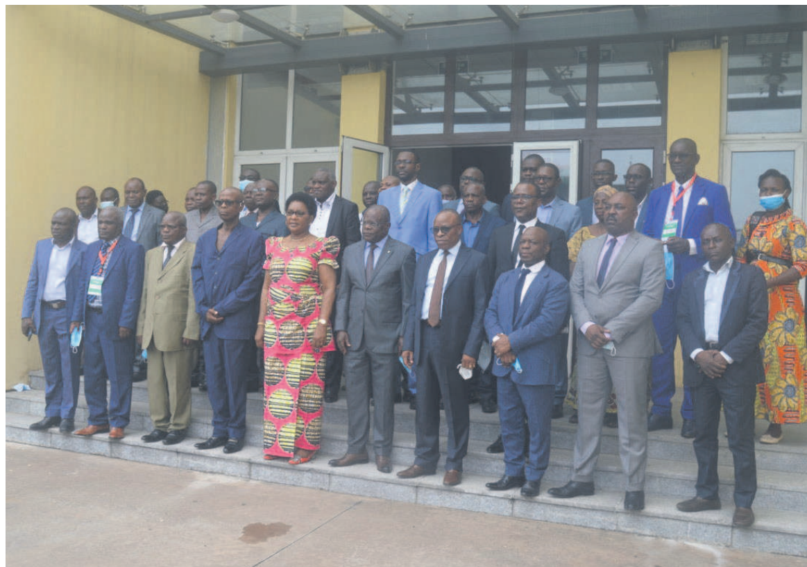
La ministre et les chercheurs participant à l'atelier de rédaction scientifique