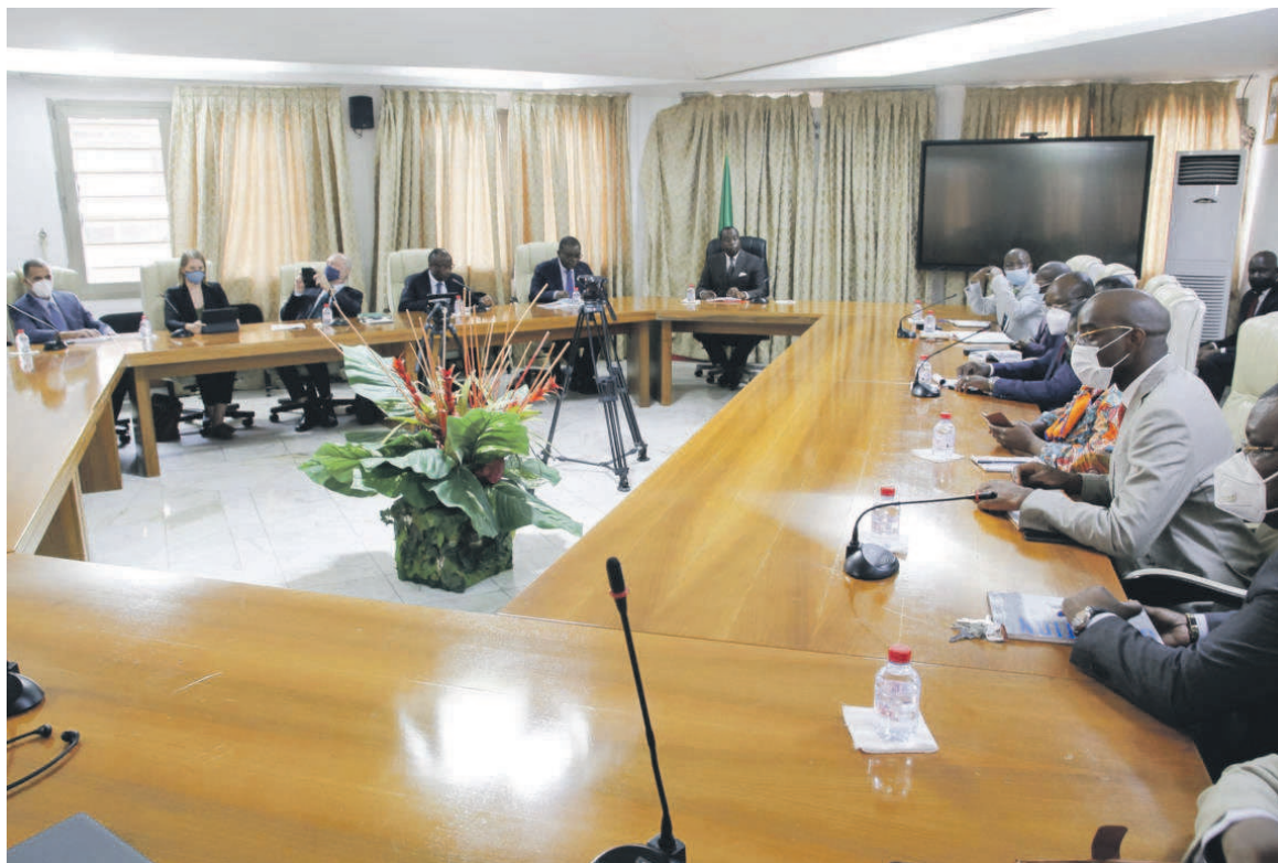
Une vue de la salle

« C'est important que les membres du Conseil d'administration qui statuent sur les dossiers des pays s'entre-tiennent directement avec les autorités gouvernementales pour mieux s'enquérir des préoccupations et bien préparer la prise en charge », a-t-il