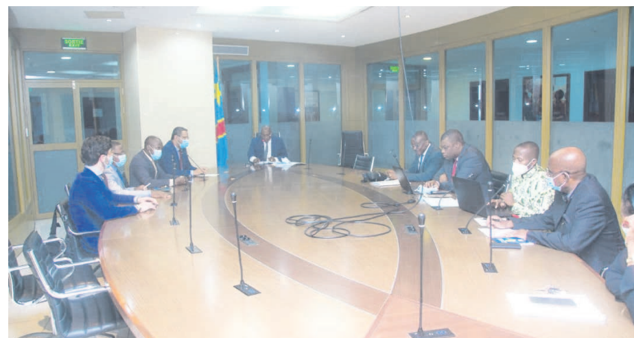
Le ministre de la Santé présidant la réunion sur le projet d'appui à la lutte contre le cancer

Le ministre de la Santé publique, Hygiène et Prévention, Jean-Jacques Mbungani, a tenu une importante réunion dernièrement avec le directeur du Centre national de lutte contre le cancer, les représentants de la firme Roche en République démocratique du Congo (RDC) ainsi que quelques membres de son cabinet.