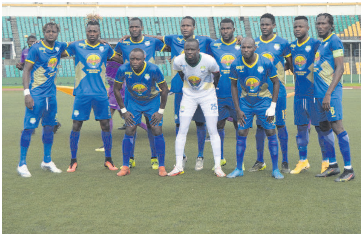
AS Otohô éliminée après la phase de poules

Mais cette délocalisation des matches n'est pas la seule raison de l'échec. Le