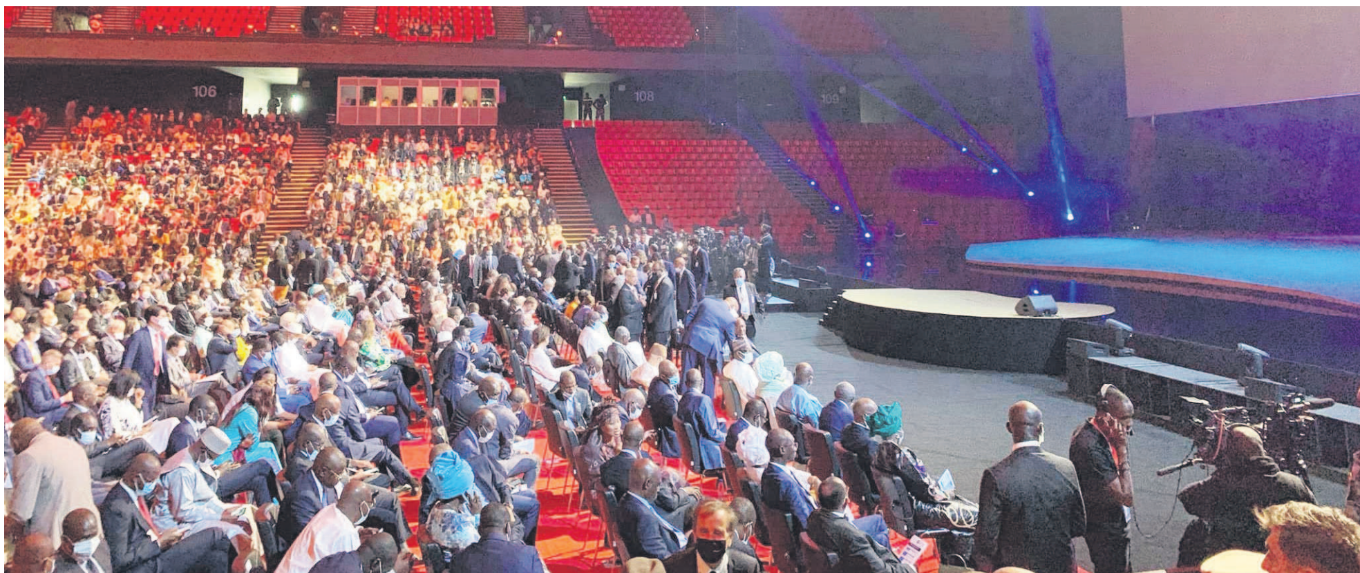
Le 9 e Forum mondial de l'eau a débuté à Diamniadio, près de Dakar, le 22 mars

Le président sénégalais, Macky Sall, a donné hier le coup d'envoi du 9 e Forum mondial de l'eau à Diamniadio, près de Dakar, en vue de « sonner l'alerte » sur la « raréfaction des ressources hydriques » dans le