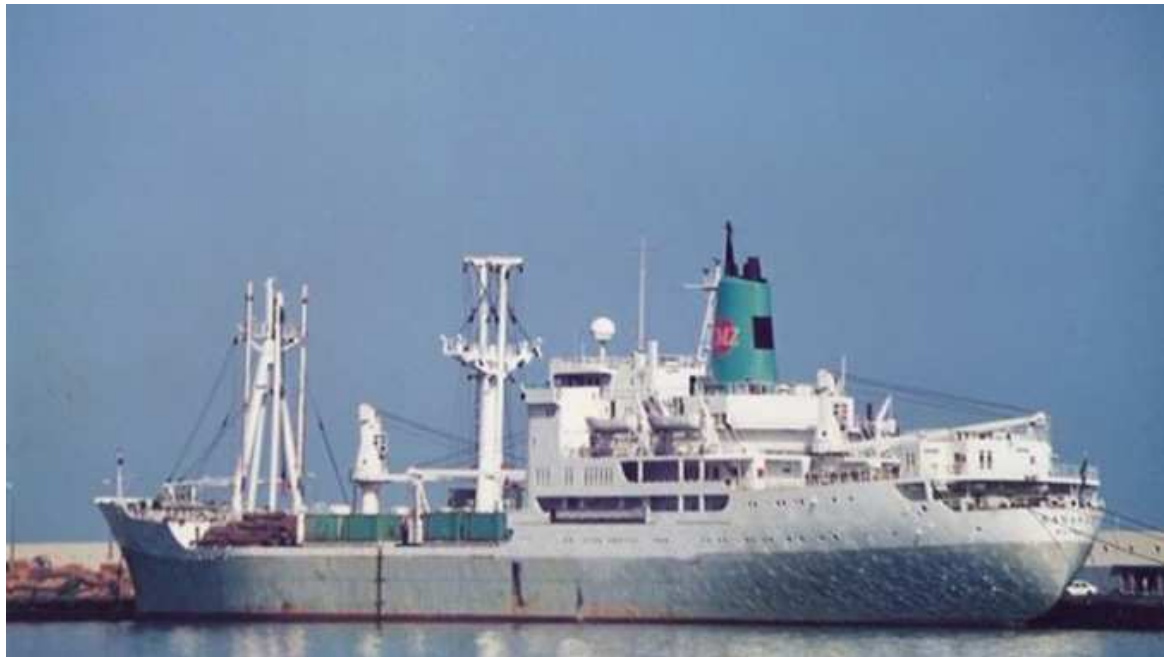
Une subvention de l'État pour soutenir les Lignes maritimes congolaises

Félix-Antoine Tshisekedi est déterminé à accroître la capacité de participation des LMC dans l'industrie maritime internationale et de contribuer ainsi efficacement au développement du commerce extérieur du pays. Les ministres du Portefeuille et des Transports