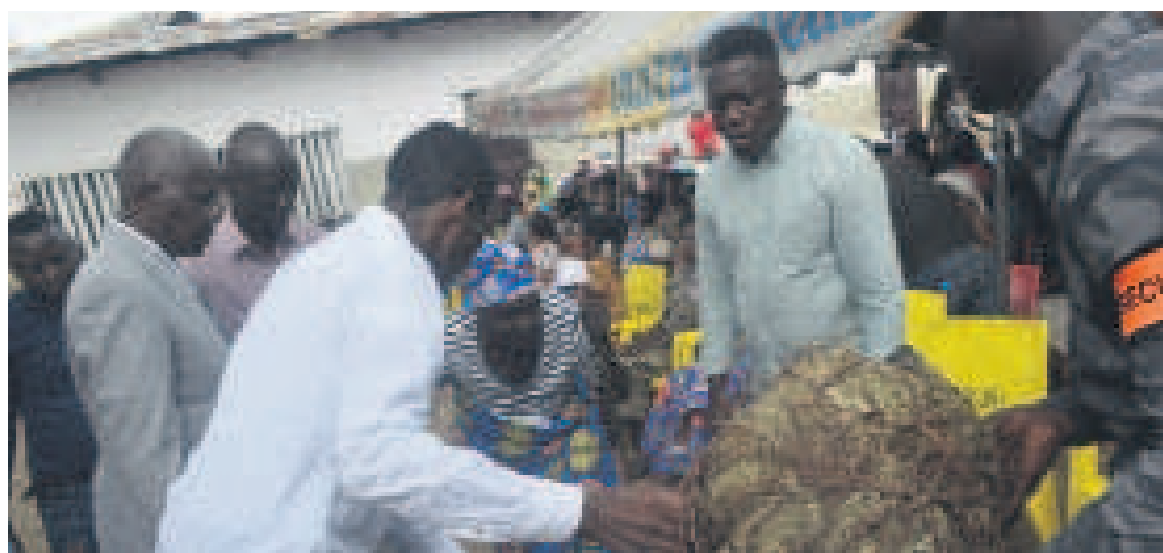
La remise des dons