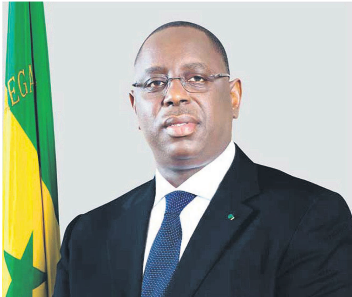
Le président sénégalais Macky Sall

Plusieurs chefs d'Etat étaient présents lundi à la Dakar Arena, à Diamniadio, dont le président congolais Denis Sassou Nguesso ou le Bissau-Guinéen Umaro Sis-