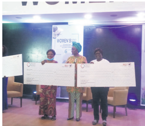
Les lauréates posent avec la marraine de la 6 e édition de Women's Activity Awards Adiac donateurs, structures publiques ainsi qu'aux partenaires soucieux de la situation de la femme rurale.

Evoluant dans différents secteurs dont celui de la pêche et la transformation des produits halieutiques, et de la production des légumes, ces coopératives qui éprouvent des difficultés pour développer leurs activités ont salué cet apport et lancé un appel aux