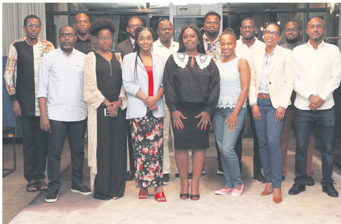
Les participants à la réunion du 18 mars au quartier Plateau, Abidjan

Cette réunion préliminaire a connu la participation active de quatorze membres. Il y a été constaté des man-