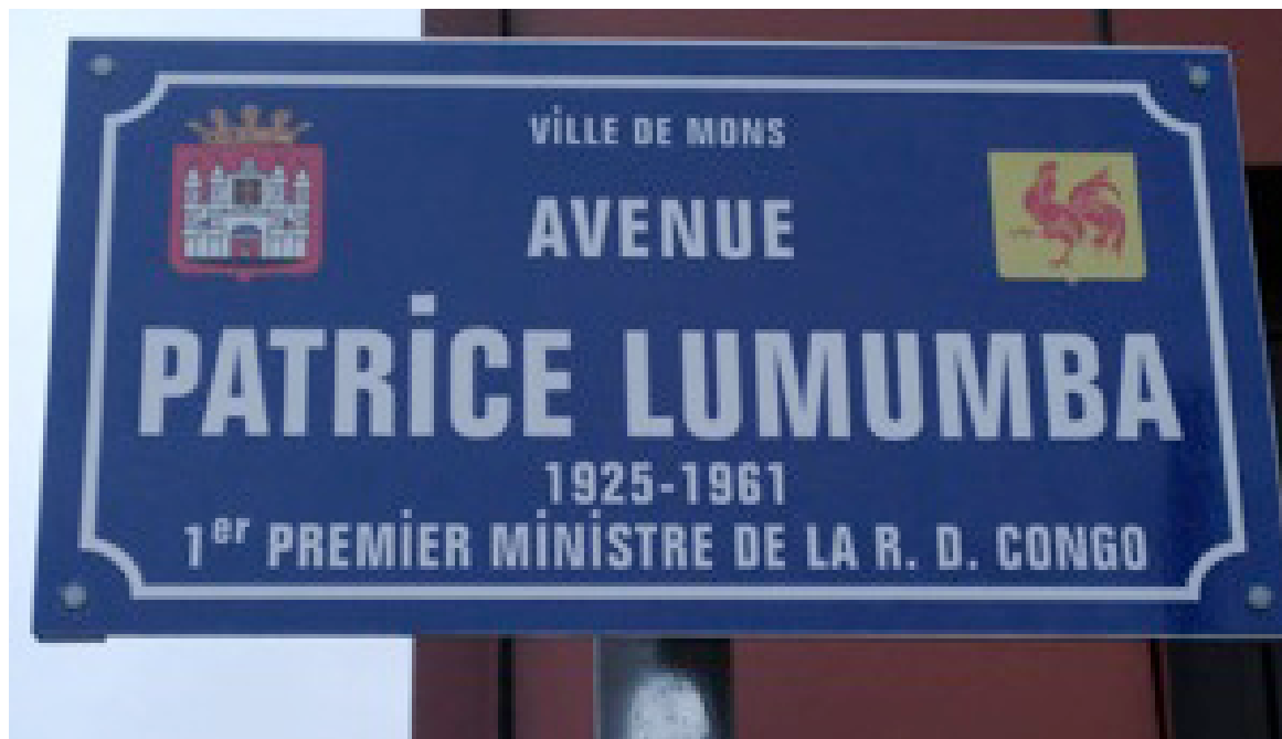
Une vue du panneau indiquant le nom de l'avenue Patrice-Lumumba à Mons