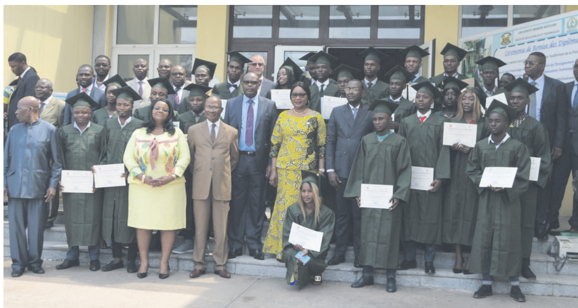
La première promotion congratulée