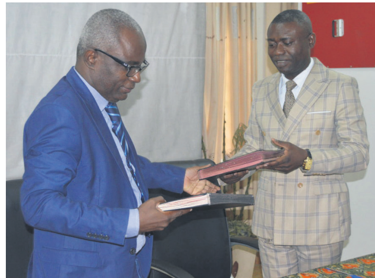
Signature de l'accord de partenariat DR

L'Agence nationale de valorisation des résultats de la recherche et de l'innovation (Anvri) et le Groupe Ben'K Aubinson, une agence de communication, ont signé le 20 janvier à Brazzaville un accord pour la diffusion des travaux des chercheurs et innovateurs congolais.