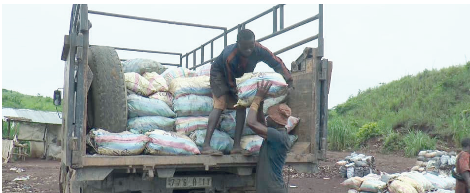
Chargement des polymétaux par les exploitants illégaux