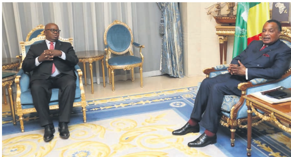
Echange entre Denis Sassou N'Guesso et Michaël Moussa Adamo

Le chef de l'Etat, Denis Sassou N'Guesso, a échangé le 19 janvier à Brazzaville avec le ministre gabonais des Affaires étrangères, Michaël Moussa Adamo, porteur d'un message du président Ali Bongo Ondimba, peu avant sa mort.