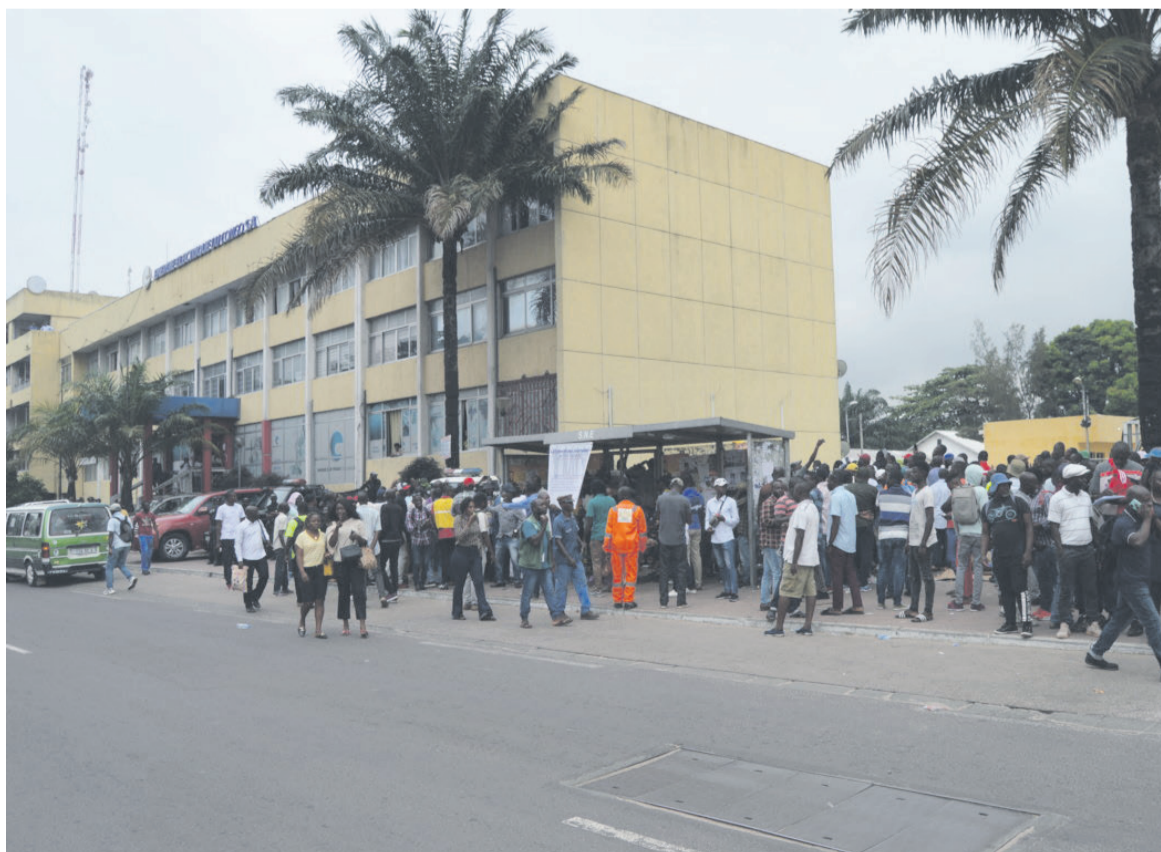
Le sit-in des journaliers devant le siège de E2C/Adiac