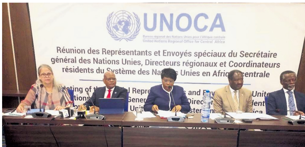
La séance de travail entre les représentants de la CEEAC et ceux du système des Nations unies/Adiac

Par ailleurs, les différents orateurs ont épinglé l'année 2023 « comme celle de toutes éventualités ». En effet, beaucoup de pays de la région vont se livrer aux joutes électorales. Les cas de la République centrafricaine, la Ré-