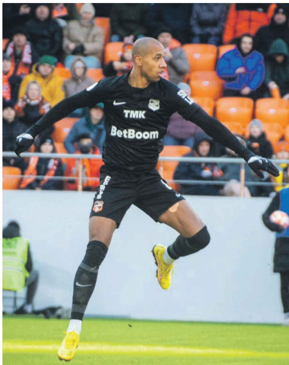
Première défaite depuis le 17 septembre pour Illoy-Ayyet et le Fk Oufa

A Parme, Gabriel Charpentier était titulaire pour le déplacement de Parme à