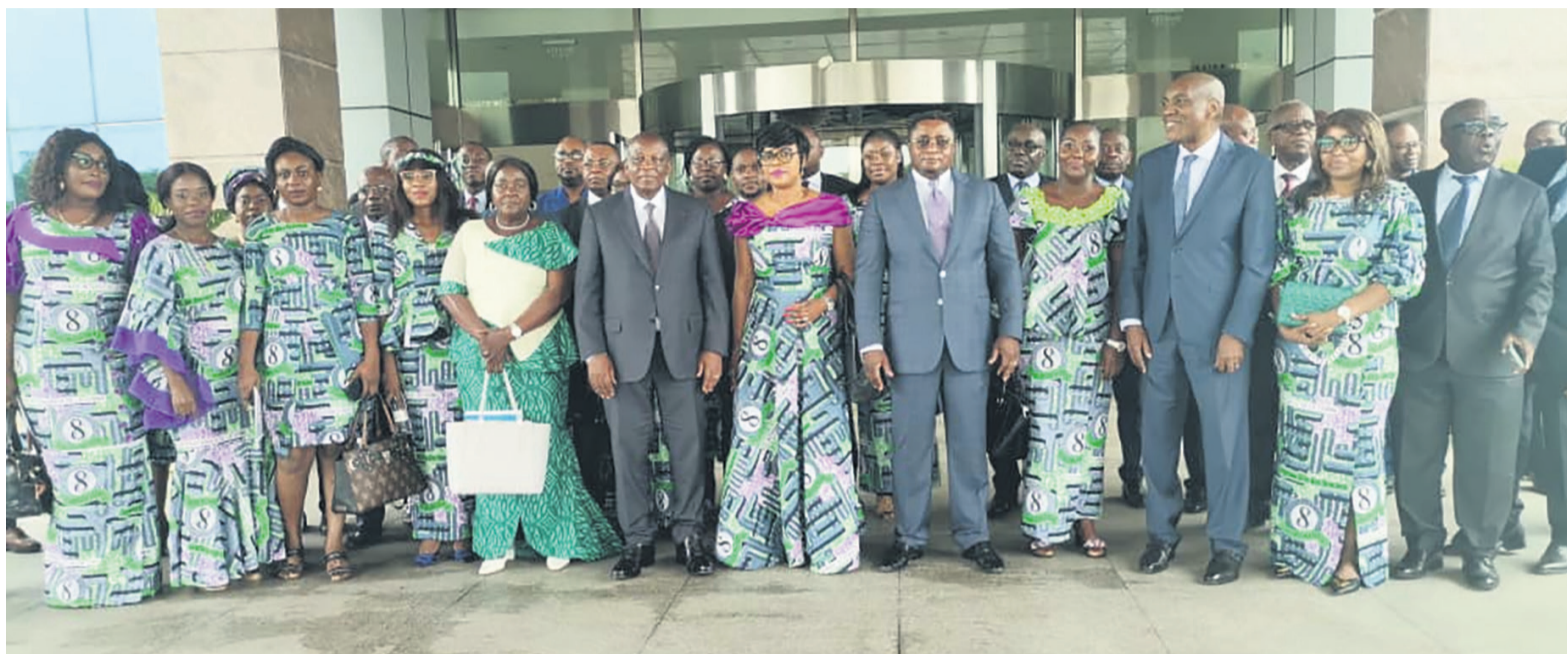
Photo de famille après la journée thématique

« J'attends de votre journée des signaux forts et pourquoi pas une valeur ajoutée inestimable pour le corps de la magistrature dont la perception se fera aisément sentir par les justiciables et autres acteurs et observateurs de notre système judiciaire. Je voudrais vous assurer de ma disponibilité à vous accompagner dans la mise en œuvre des conclusions auxquelles cette journée aboutira », a déclaré le ministre.