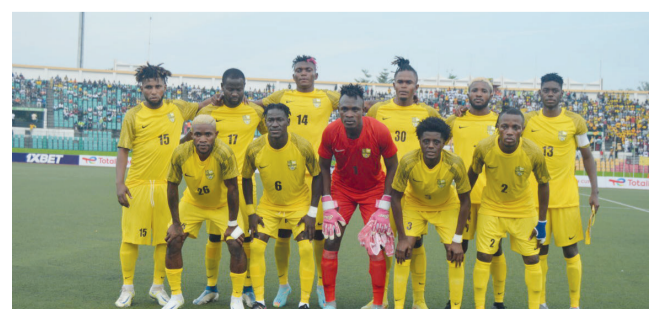
Les Diabes noirs éliminés de la compétition

Les Congolais avaient réduit leurs chances de poursuivre la compétition à cause des deux défaites concédées face aux Ivoiriens d'Asec Mimosas.