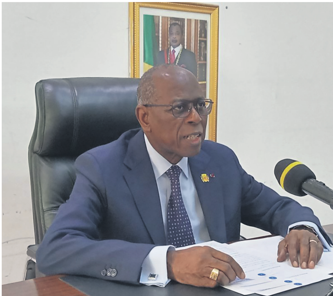
Le ministre Gilbert Mokoki délivrant la déclaration du gouvernement

En effet, a expliqué Gilbert Mokoki, les affections bucco-dentaires constituent un problème majeur de santé publique puisqu'elles figurent parmi les maladies non transmissibles les plus courantes dans la région africaine. Celles-ci, a-t-il renchéri, peuvent se manifester tout au long de la vie entraînant la douleur, le défigurement, l'isolement social, la détresse et même la