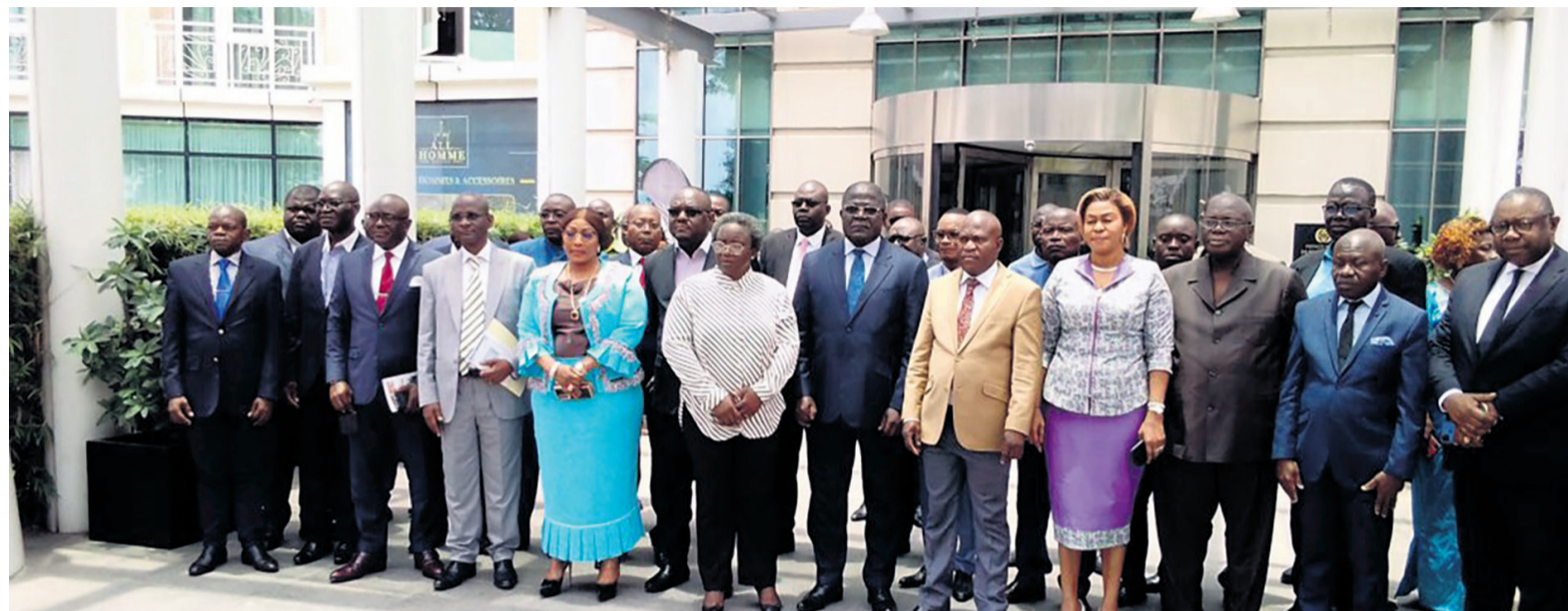
Le directeur général des Impôts posant avec les participants

Prennent part à l'atelier les experts en provenance de la primature, des cabinets du ministère du Plan, de l'Economie et des Finances, de l'Economie forestière,