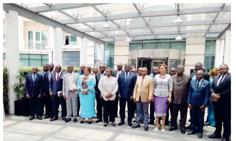
Le directeur général des Impôts posant avec les participants