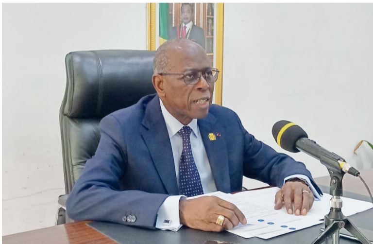
Le ministre Gilbert Mokoki délivrant la déclaration du gouvernement

Le ministère de la Santé et de la Population va lancer, du 10 au 15 avril à Brazzaville et Pointe-Noire, une campagne de dépistage et de prévention des pathologies bucco-dentaires en milieu scolaire.