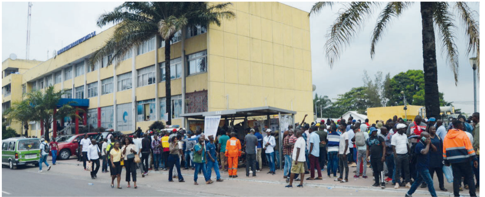
Le sit-in des journalistes devant le siège de E2C