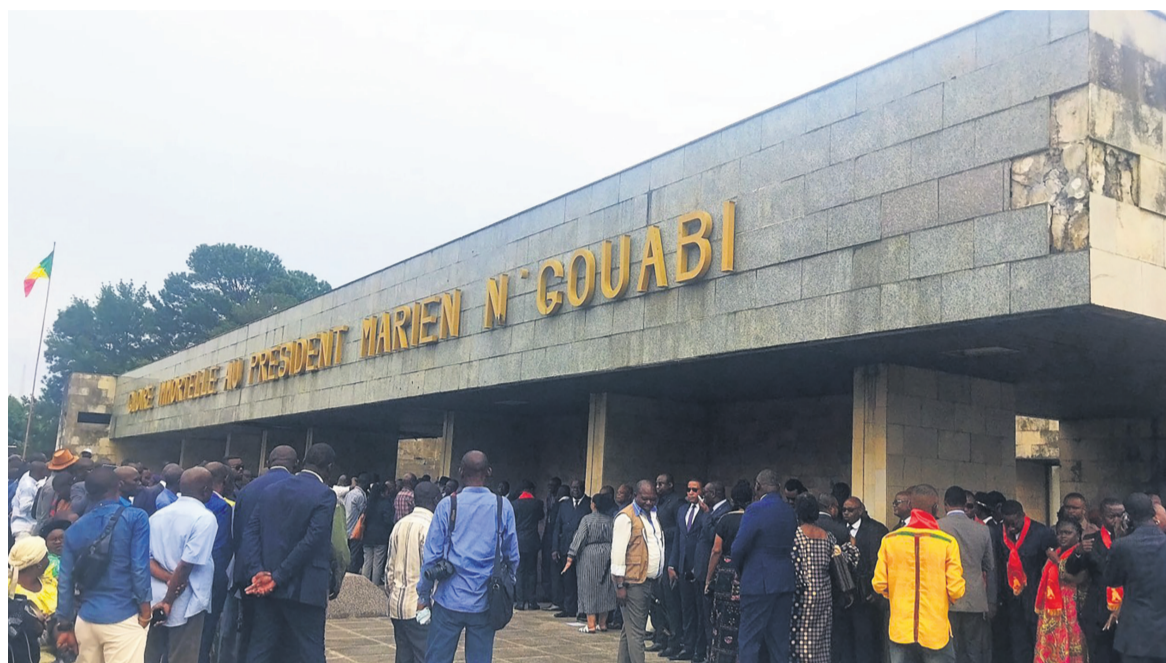
Une vue des membres du PCT au mausolée Marien-Ngouabi, le 18 mars 2023

Décédé le 18 mars 1977, feu le président Marien Ngouabi a totalisé, le 18 mars 2023, 46 ans depuis sa disparition. A l'occasion, le Parti congolais du travail (PCT) dont il en est le fondateur, lui a rendu, une fois de plus, un hommage mérité lors d'une cérémonie organisée au mausolée érigé en son honneur.