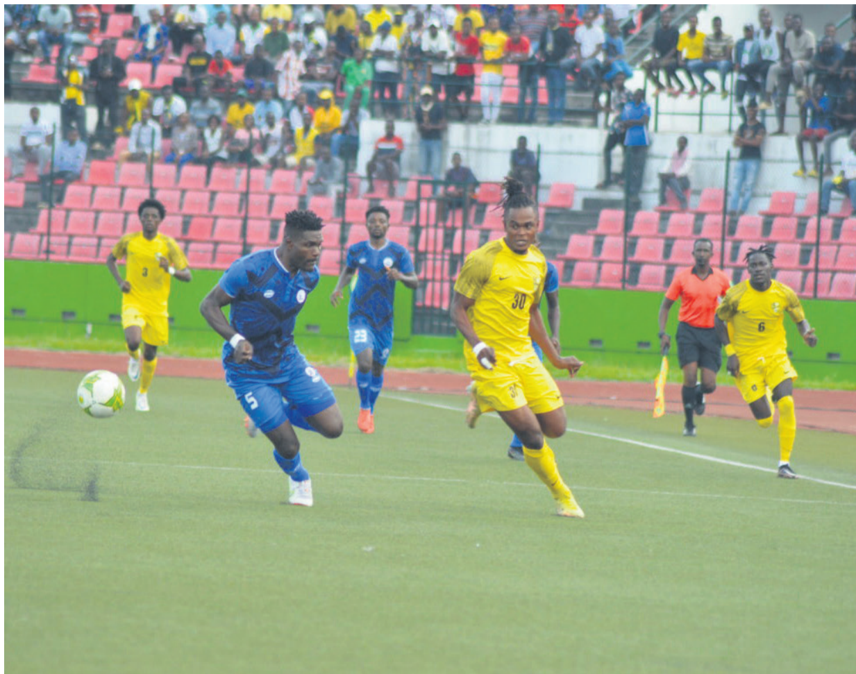
Les Diablotins stoppent la série de victoires de Rivers United/Adiac

Le miracle tant espéré ne s'est pas produit à cause des bons résultats obtenus par les concurrents directs. Rivers United et Asec Mimosas (dix points chacun) se sont tous les deux qualifiés pour les quarts de finale de la C2. Mais que ce fut dur pour les Nigériens qui n'ont pas réussi à prendre leur revanche sur l'équipe qui leur avait infligé 0-3 lors de la première journée à Brazzaville. Le club congolais est le seul que le représentant nigérian n'a pas pu battre dans cette phase de poules. Les Diablotins ont eu le mérite