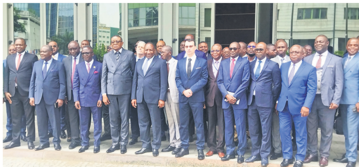
Les participants à l'atelier posant ensemble, le 20 mars

« Notre ambition est de disposer dès 2025 d'une information financière et comptable complète et de qualité, en adéquation avec les meilleures normes internationales. Celle-ci permet de fournir des outils appropriés d'aide à la décision, d'assurer une gestion efficiente des deniers publics. L'objectif est