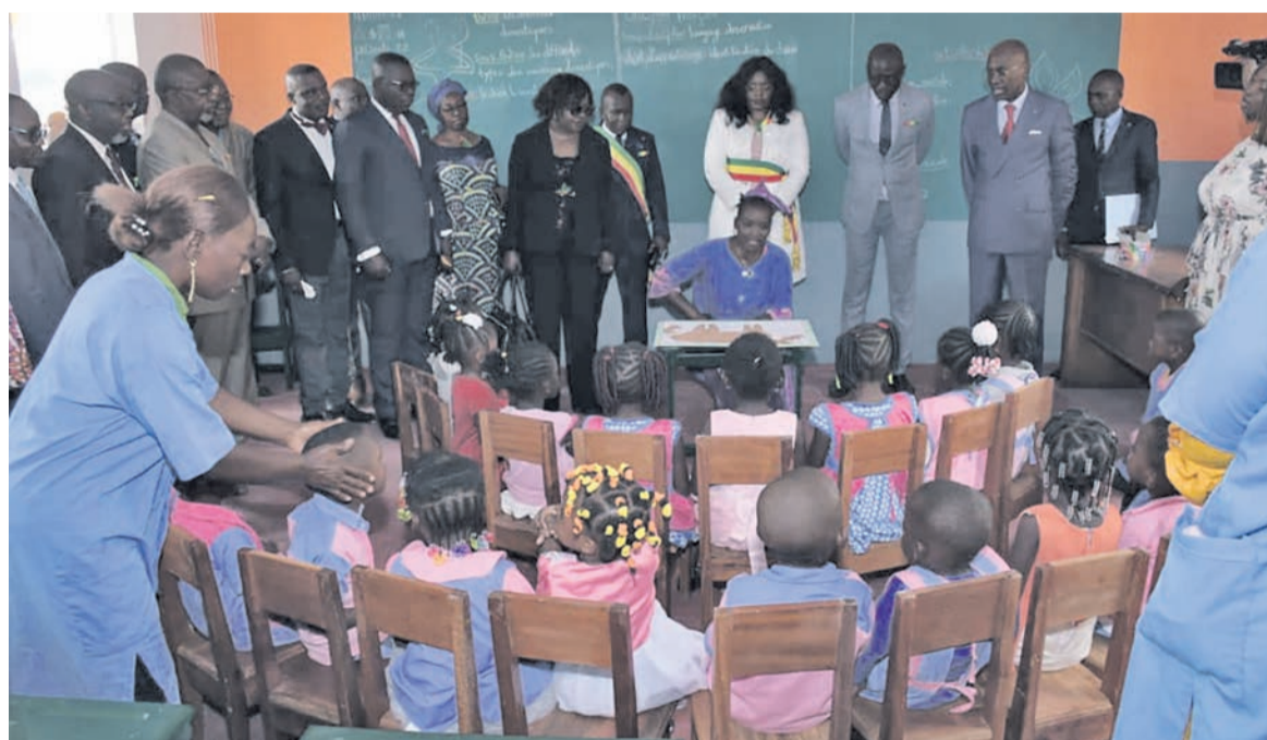
Le centre d'éducation préscolaire de Mfilou-Ngamaba ouvert

Le centre d'éducation pour la petite enfance de Mfilou-Ngamaba, dans le septième arrondissement de Brazzaville, vient allonger la liste des structures de même nature rapprochant ainsi l'école des apprenants.