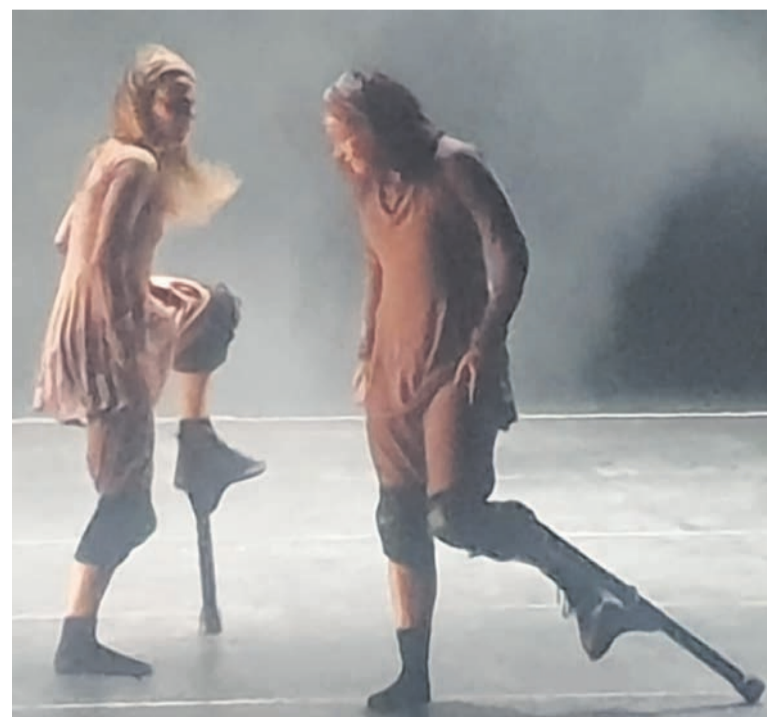
Une prestation des artistes venus d'ailleurs

Pour la députée maire de la commune de Kintélé, les objectifs de ce festival étaient de faire connaître non seulement la culture congolaise aux Congolais mais aussi celle des autres pays invités aux Congolais comme la Colombie, l'Espagne et autres. « Nous espérons que la prochaine édition n sera aussi bonne que celle-là. J'ai vu que la jeunesse congolaise était très présente pendant ce festival, que ce soit à Kintélé ou à l'auditorium du ministère des Affaires étrangères. J'ai vu des élèves et je sais que la jeunesse s'implique à la culture congolaise et on espère qu'il y en a parmi eux ceux qui vont choisir les arts comme vocation », a-t-elle déclaré. Le premier spectacle a porté sur le cirque,