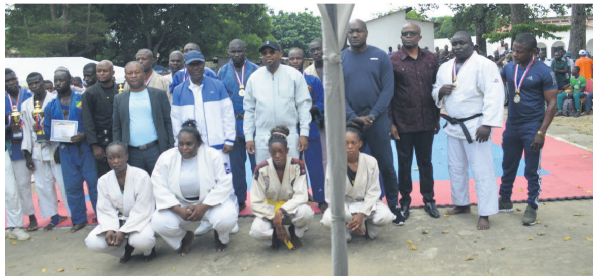
Les judokas posant avec les officiels

La section judo de l'Association sportive gendarmerie a organisé, le 12 mai, au dojo de la région de gendarmerie de Brazzaville, un tournoi interclubs dénommé « Judo pour tous ».