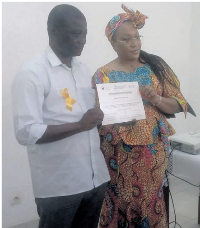
La présidente de la Fondation remettant une attestation à un participant

« La particularité des cancers de l'enfant est que s'ils sont détectés