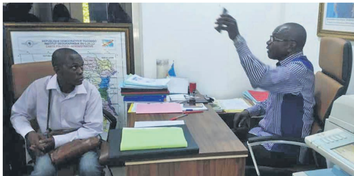
Un ressortissant de la RDC se faisant enrôler

En outre, ces autorités se sont aussi félicités du rôle joué par Christophe Lutundula Apala, vice-Premier ministre, ministre des Affaires étrangères de la RDC, signataire de cette nou-