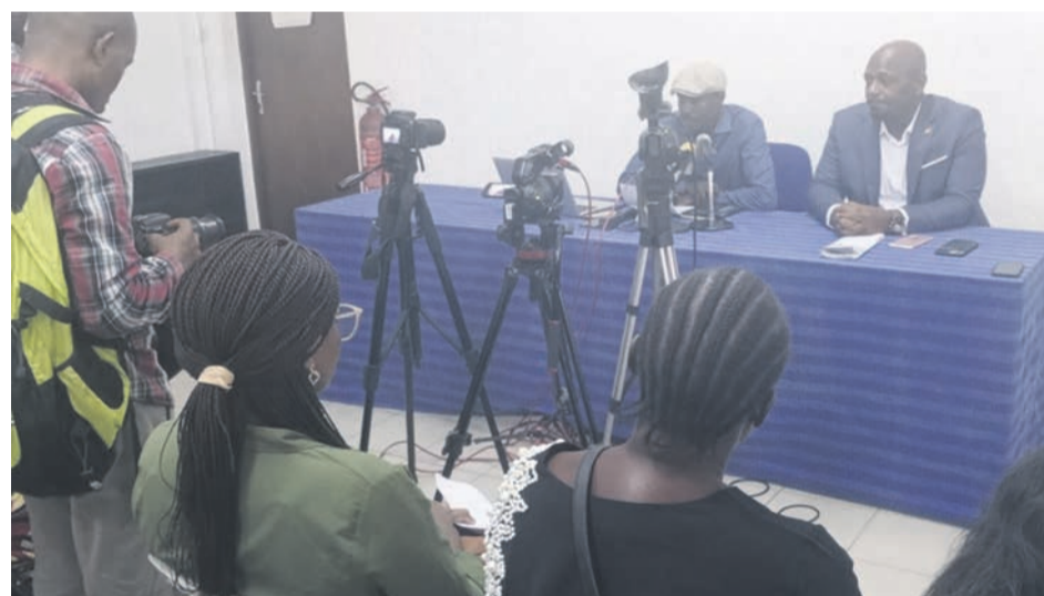
Les membres du CAD devant la presse

Les responsables du Centre d'action pour le développement (CAD) ont animé, le 12 mai, à Brazzaville, un point de presse au cours duquel ils ont rendu publique une note de situation qui déplore le comportement «non conforme» de certains policiers dans l'exercice de leurs fonctions.