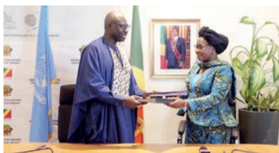
La signature de l'accord en faveur des PME

La Fondation de la Société Nationale des Pétroles du Congo (SNPC) a fait, le 11 mai, un don destiné à renforcer la capacité du service de néphrologie de l'hôpital général Edith-Lucie-Bongo-Ondimba d'Oyo dans le département de la Cuvette. Ce matériel médical vise à améliorer la prise en charge des malades souffrant de l'insuffisance rénale. « Le don est constitué de 3500 kits d'éléments solides et liquides, des