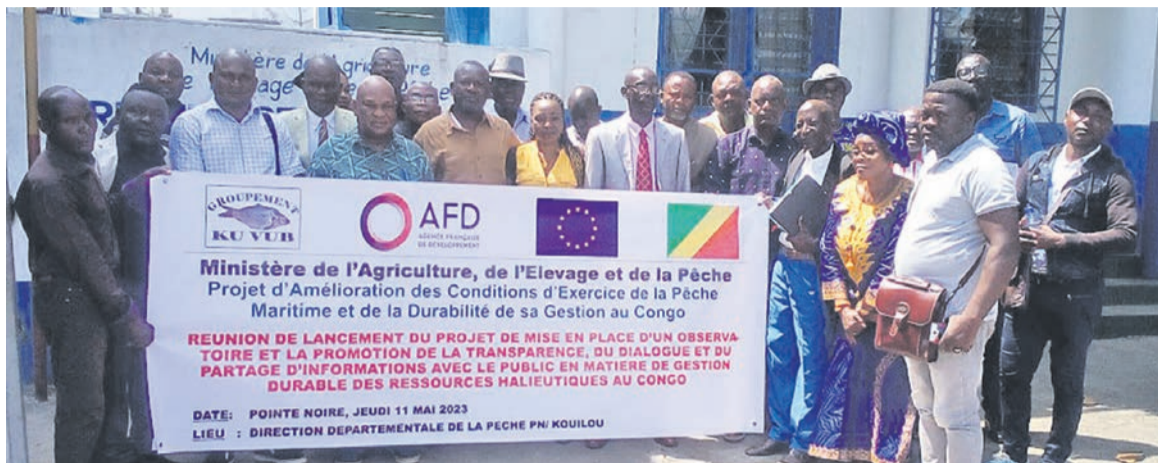
La photo de famille à la fin du lancement du projet de mise en place d'un observatoire des pêche

L'activité fait partie du projet d'amélioration des conditions d'exercice de la pêche maritime et de la durabilité de sa gestion au Congo, fruit de la coopération entre le gouvernement, l'Union européenne (UE) et l'Agence française de développement (AFD). Le suivi, le contrôle et la surveillance sont une des composantes du projet. Son objectif principal est de promouvoir la transparence dans le secteur de la pêche par la mise en place d'un observatoire visant le partage, avec la société civile, de l'information sur les conditions d'exploitation des ressources halieutiques au Congo. Cette mission a aussi pour objet d'ana-