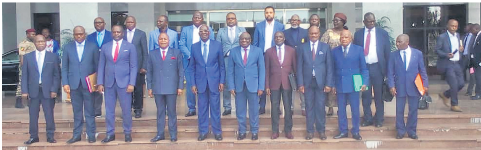
Les participants à la deuxième session de la Conader/Adiac

Un programme initié après la signature, le 23 décembre 2017, de l'accord de cessez-le-feu et de cessation des hostilités entre le gouvernement et la partie rebelle. Co-financé par le gouvernement et ses partenaires techniques et financiers à hauteur de 8,3 milliards FCFA, dont il devrait contribuer à hauteur de deux milliards FCFA, le programme DDR va assurer la réinsertion sociale de 20 000 villageois, au nombre desquels 7000 ex-combattants ninjas déjà désarmés et démobilisés.