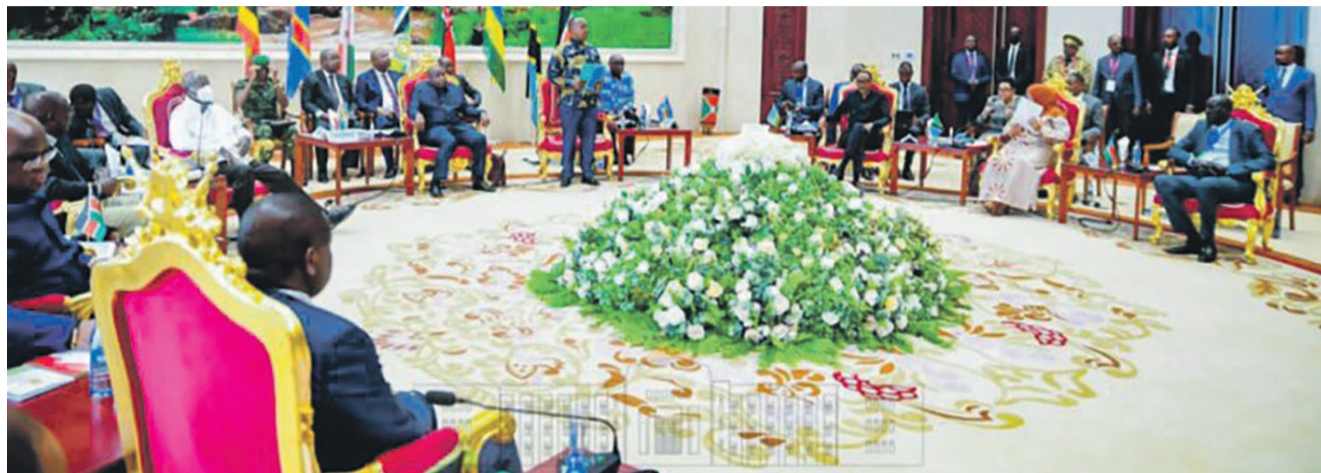
Le panel des Chefs d'État au sommet de Bujumbura/DR

Au cours de l'entretien qu'il a eu le 12 mai, à Gaborones, avec la communauté congolaise du Botswana, le chef de l'Etat, Félix-Antoine Tshisekedi Tshilombo, a écarté l'option du retrait de son pays de la Communauté de l'Afrique de l'Est (CAE), apprend-on des sources présidentielles.