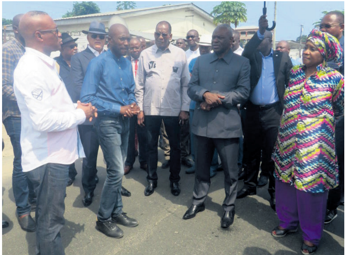
Le Premier ministre et sa suite visitant les travaux sur l'avenue Marien-Ngouabi, dans le troisième arrondissement Tié-Tié/Adiac

Notons qu'avant cette descente, le chef de l'exécutif a effectué un jour avant une tournée sur tout le réseau routier de la ville. En plus du maire de la ville, il était accompagné