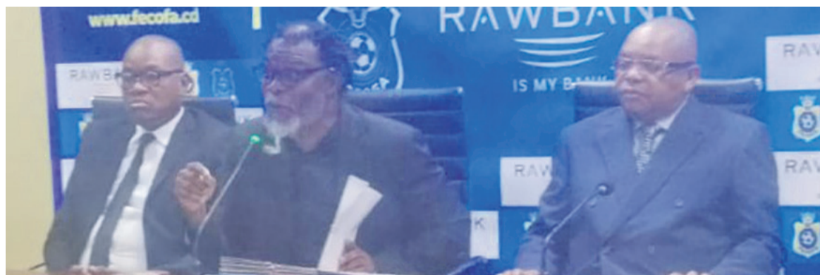
Le Comité de normalisation de la Fécoba au cours de la conférence de presse du 10 mai 2023

Dans le calendrier, l'on note que les ligues, les clubs et les groupements d'intérêt de football sont invités à transmettre leurs dossiers selon l'article 12 des statuts de la Fécoba entre le 11 mai et le 14 septembre pour l'établissement de la liste précise des membres de la Fécoba. Son assemblée générale extraordinaire (AGE) avec les nouveaux membres