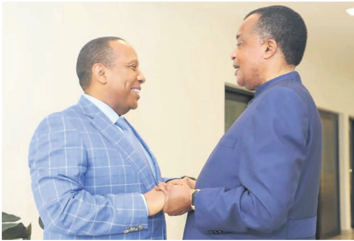
Le président Denis Sassou N'Guesso et le Premier ministre de Sao Tomé-et-Principe, Patrice Emery Trovoada

Le Premier ministre de Sao Tomé-et-Principe, Patrice Emery Trovoada, a indiqué, le 12 mai, que son pays et le Congo entendent resserrer leurs liens de coopération.