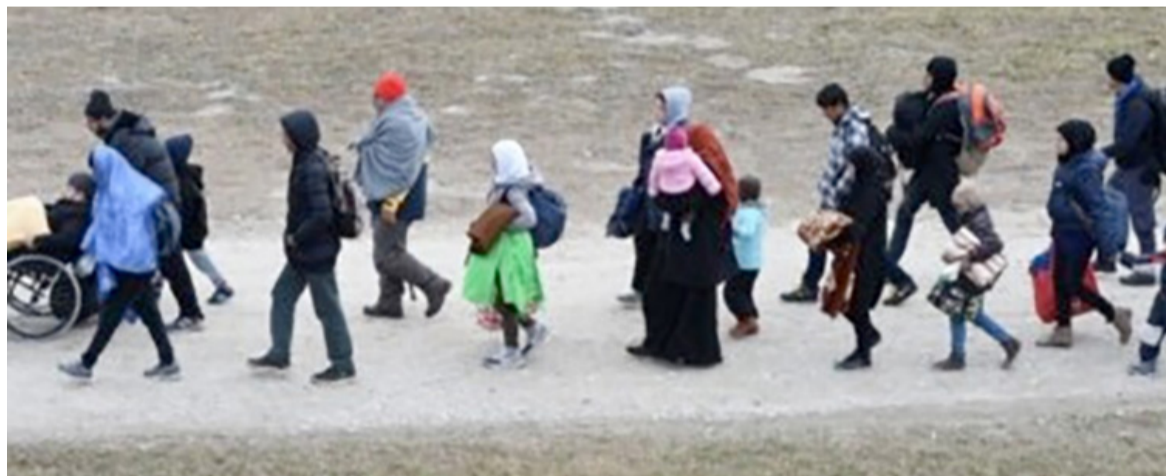
Les migrants après avoir franchi le pont frontalier germano-autrichien, le 27 octobre 2015

Aucun autre pays au monde ne veut freiner la migration autant que l'Autriche, selon une nouvelle enquête publiée le 10 mai.