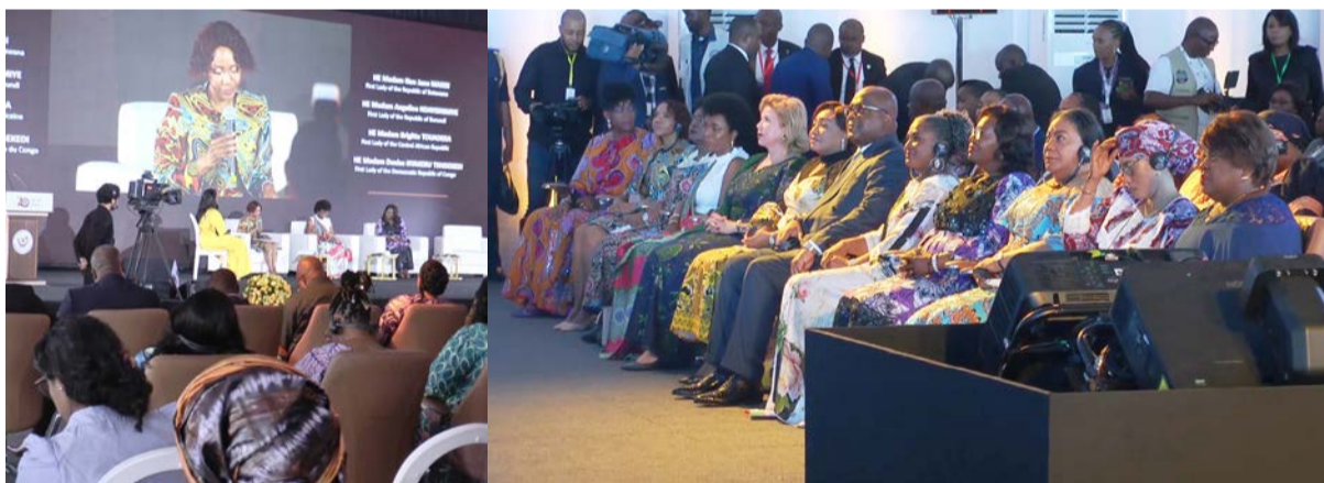
Félix Antoine Tshisekedi Tshilombo encadré par la présidente et la vice-présidente de l'Opdad

Présent à cette cérémonie, le chef de l'Etat de la RDC, Félix