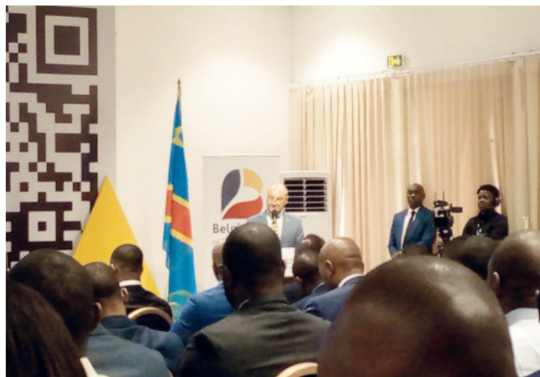
L'ambassadeur de Belgique, Jo Indekeu, intervenant à la cérémonie Adiac

Le ministre du Numérique a ainsi renforcé le propos de l'ambassadeur de Belgique, Jo Indekeu, tenant le code du numérique pour « un cadre juridique solide qui permettra d'exploiter pleinement le potentiel du numérique pour le développement économique, social et humain » de la République démocratique du Congo (RDC). Il s'agit d'offrir « des opportunités sans précédent aux entrepreneurs, aux innovateurs, aux créateurs et à tous les citoyens congolais ». Qui plus est, l'importance du code du numérique dit « la loi Kolongele » a été relevée au niveau des administrations financières mais pas que. Le ministre a notamment évoqué des projets initiés faisant de l'Etat un des acteurs de la transformation digitale. Ce, quitte à étendre la digitalisation à divers secteurs, dont « l'identification générale de la population, la création d'un identifiant unique pour les personnes physiques, la modernisation de l'administration, la construction