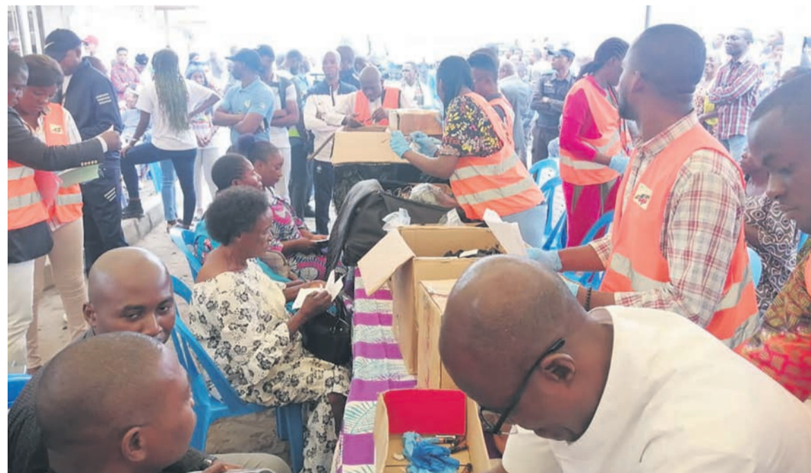
Les bénéficiaires en pleine consultation médicale

L'Assab est une association à caractère social qui a pour but de soutenir la population congolaise dans les domaines de l'éducation et de la santé. Elle est liée au gouvernement à travers deux conventions signées avec les ministères de l'Enseignement et de la Santé et vient en aide aux élèves, étudiants,