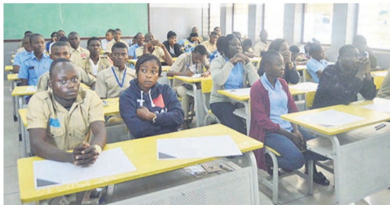
Les candidats au baccalauréat général débutent les épreuves ce 20 juin

« L'une des consignes particulières à donner aux candidats est de laisser les téléphones à la maison pour qu'ils ne courent pas le risque d'être sanctionnés. L'Etat a déployé de gros moyens pour la sécurisa-