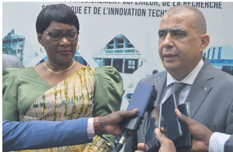
L'ambassadeur du Maroc annonçant l'octroi des bourses

A propos de l'octroi des bourses, le Maroc n'est pas à son premier coup d'essai. La tradition boursière date de plusieurs années. L'année