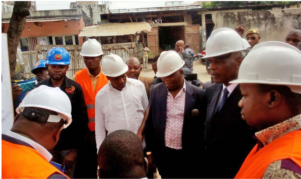
Le maire de Brazzaville s'imprégnant de la réalité du terrain

Quant au retard observé, il a évoqué quelques raisons, parmi lesquelles le braquage subi dans le Pool lors de l'acheminement des matériaux sur Brazzaville, les intempéries et le relogement des services de la mairie de Poto-Poto. « Les travaux ont officiellement démarré le 4 avril 2023, la fin est envisagée pour le 15 décembre. Il était initiale-