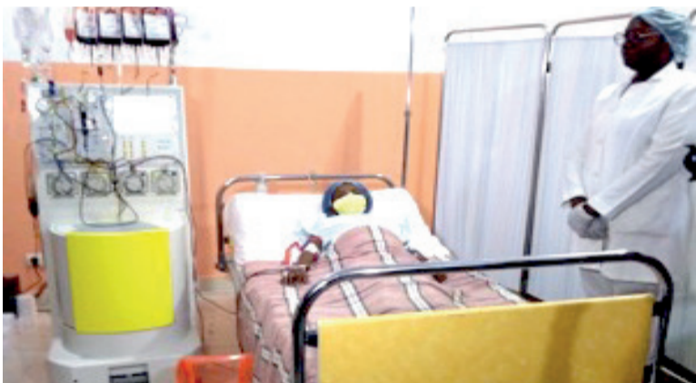
Une patiente en échange transfusionnel / Adiac