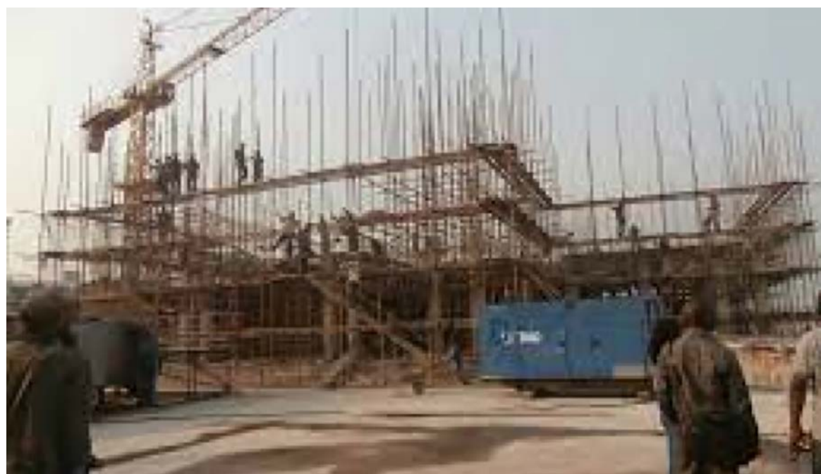
Vue d'un chantier inachevé

Dans le lot, précise le rapport d'enquête, 19,82% de projets