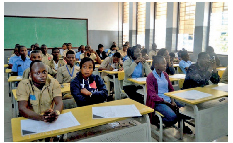
Les candidats au baccalauréat général débutent les épreuves ce 20 juin

Les épreuves du baccalauréat de l'enseignement général seront lancées ce 20 juin sur l'ensemble du territoire national avec en lice 92 173 candidats répartis dans plus de 200 centres d'examen dont 105 pour la seule ville de Brazzaville et 74