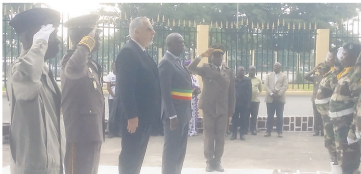
Les officiels déposant les gerbes de fleurs

Dans le cadre du 83 e anniversaire de l'appel du 18 juin 1940, une cérémonie a été organisée au square de Gaulle de Brazzaville, en présence des autorités françaises et congolaises ainsi que du corps diplomatique accrédité en République du Congo.