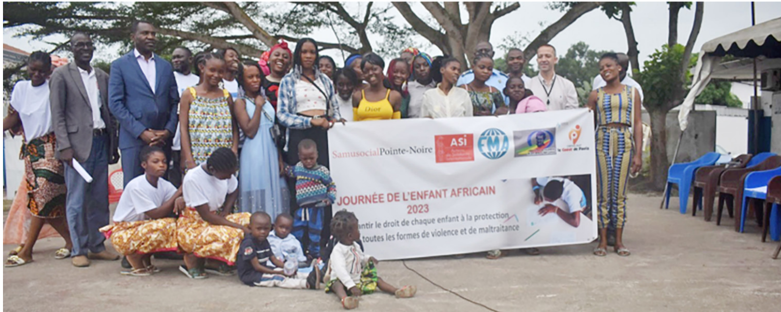
La photo de famille à la fin de la célébration de la Journée de l'enfant africain au Samu social Pointe-Noire

En marge de la création officielle du Parlement des enfants, cette journée festive était l'occasion de rappeler aux institutions présentes comment la prise en charge des enfants en situation de rue a évolué au cours de la dernière décennie, grâce aux actions de plaidoyer de ses acteurs et la professionnalisa-