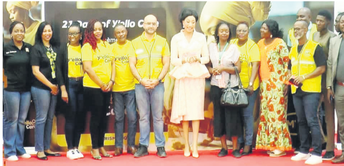
La photo de famille à l'issue de la cérémonie

« Le véritable enjeu de cette co-responsabilité sociétale de l'entreprise et le groupe MTN nous en donne une parfaite illustration. Je me réjouis profondément de la constance de cette aventure commencée depuis tant d'années ainsi que de l'ampleur des défis relevés. Car la question de l'employabilité demeure, et pour cause, une préoccupation à maintes facettes. Je formule le vœu que le potentiel que la campagne