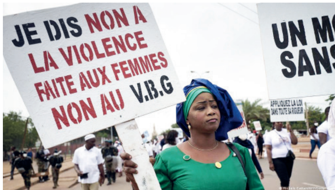
La Violence basée sur le genre, un fléau à combattre absolument.

des violences sexuelles (viol), violences physiques (frappes), violences émotionnelles (insultes), violences économiques (mariages précoces), les violences ayant pour base le genre présentent un tableau peu reluisant de la République démocratique du Congo (RDC) dont 45 % des femmes ont déjà été victimes. Selon le Pr Lututala,