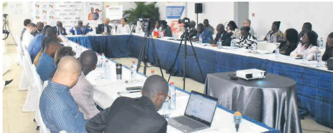
Le déjeuner de travail entre la délégation du Pnud et les hommes d'affaires

Le déjeuner d'affaires visait à sensibiliser les chefs d'entreprise au business case des ODD et le rôle qu'ils ont à jouer dans le cadre de l'avancement de l'agenda 2030. Il s'agissait aussi de présenter à ces derniers les grandes lignes du forum, mais aussi de les encourager à y participer, d'obtenir l'accord de principe de ces