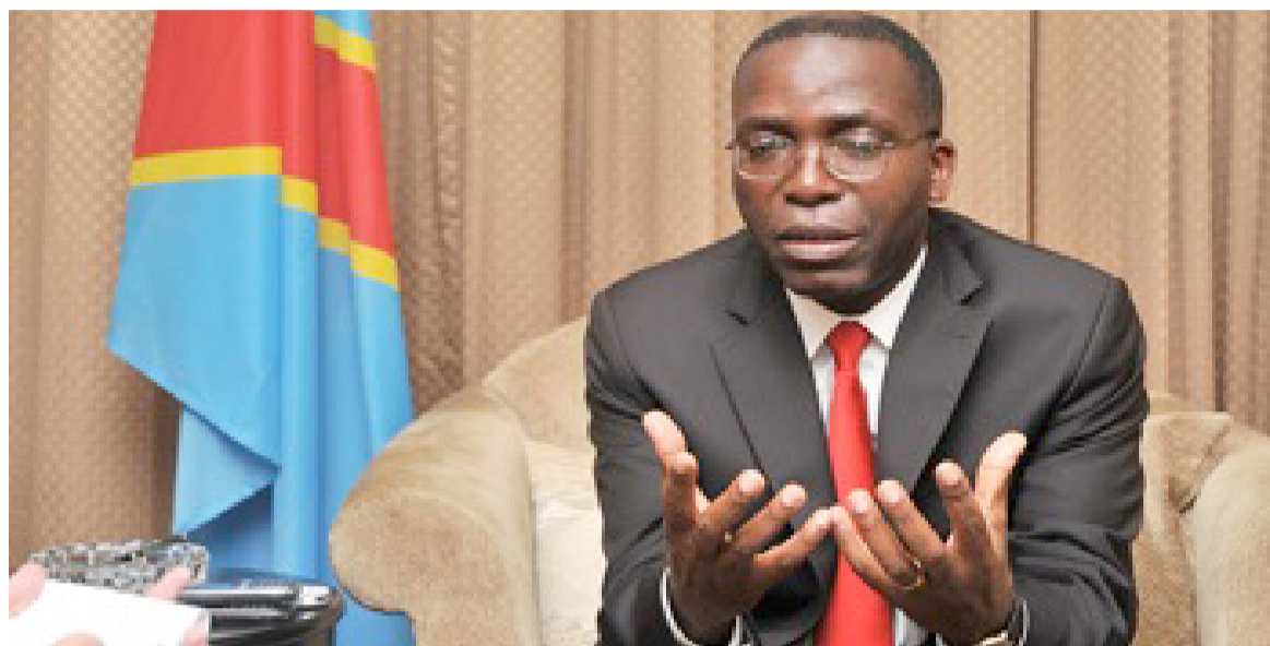
Augustin Matata Ponyo

Modeste Bahati a, en effet, réagi au réquisitoire du procureur de la Cour constitutionnelle, en notant que Matata Ponyo était déjà mis à la disposition de la justice et