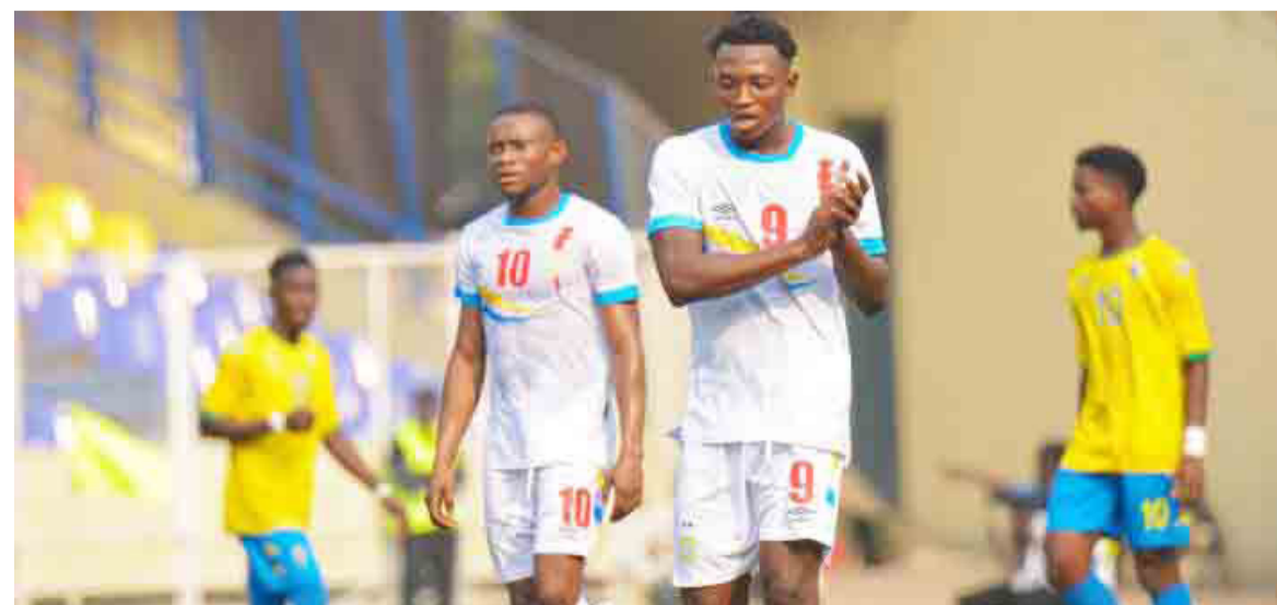
Vue d'un match des Léopards U20 au tournoi Fatshi Cup