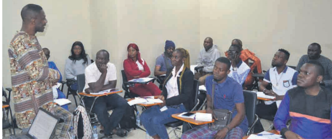
Les jeunes entrepreneurs pendant la formation

Au Congo, la Fondation Telema pour l'entrepreneuriat des jeunes est parmi les structures qui luttent contre l'oisiveté juvénile. Créée en 2021, cette dernière, à travers son incubateur, se présente comme un facilitateur au service de l'autonomisation des jeunes via l'entrepreneuriat. Son programme d'appui a pour finalité de faciliter l'accès des jeunes congolais aux services techniques et financiers et garantir le financement de leurs projets ban-