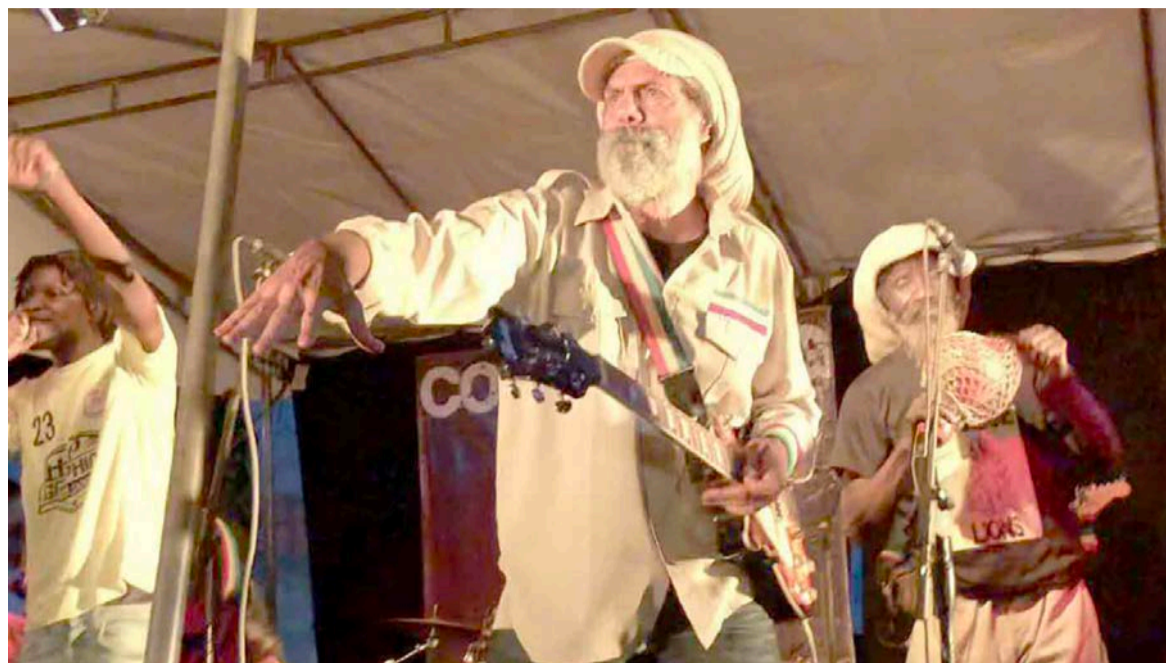
Le groupe Conquering Lions pendant sur scène à l'IFC

Le public ponténégrin a vécu, le 7 juillet, à l'Institut français du Congo (IFC), une nuit d'enchantement artistique aux sonorités envoûtantes du groupe de reggae Conquering Lions, dans le cadre des soirées jam-session.