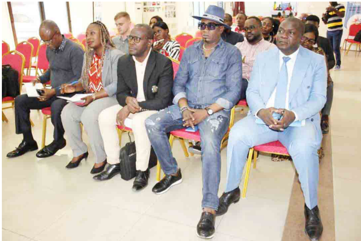
Une vue de l'auditoire