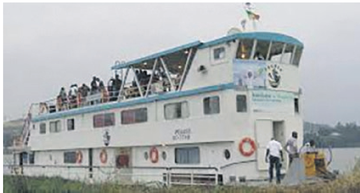
Le bateau Ville de Brazzaville au port à passagers peu avant le voyage