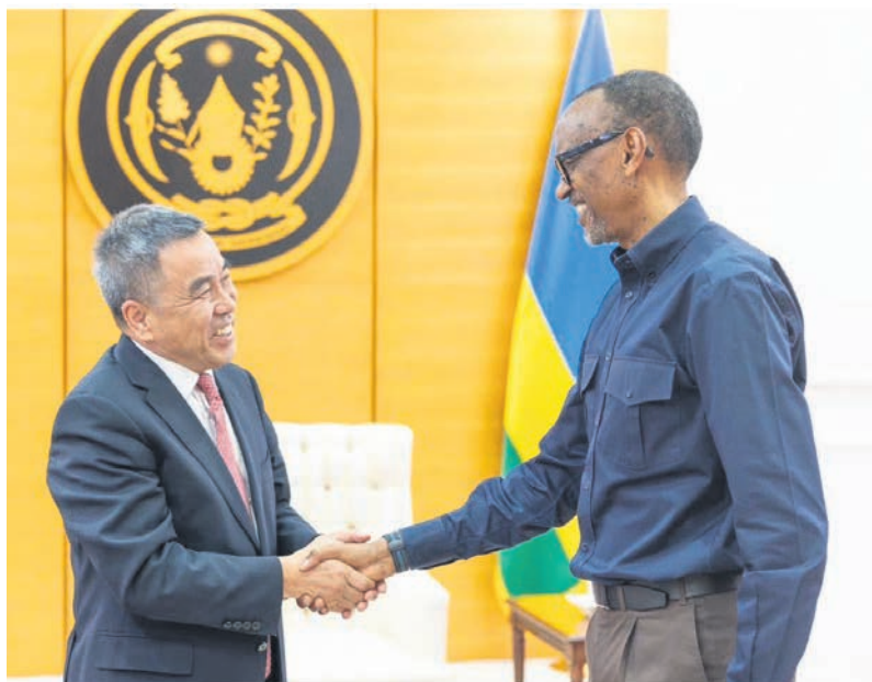
Le président Kagame serrant la main du président de StarTimes, M. Pang

Le 28 juillet dernier le président Paul Kagame a reçu M. Pang Xinxing, président du groupe StarTimes, pour une réunion de travail. Au cours de celle-ci, les deux se sont mutuellement félicités du soutien et l'aide apportés au Rwanda et à StarTimes. Présent dans plus de trente pays, aujourd'hui le Rwanda est le premier pays à accordé à StarTimes une Licence d'exploitation dans des opérations commerciales de télévision numérique et de vidéo sur Internet, desservant aujourd'hui plus de 40 millions d'utilisateurs de télévision numérique et d'utilisateurs finaux mobiles.