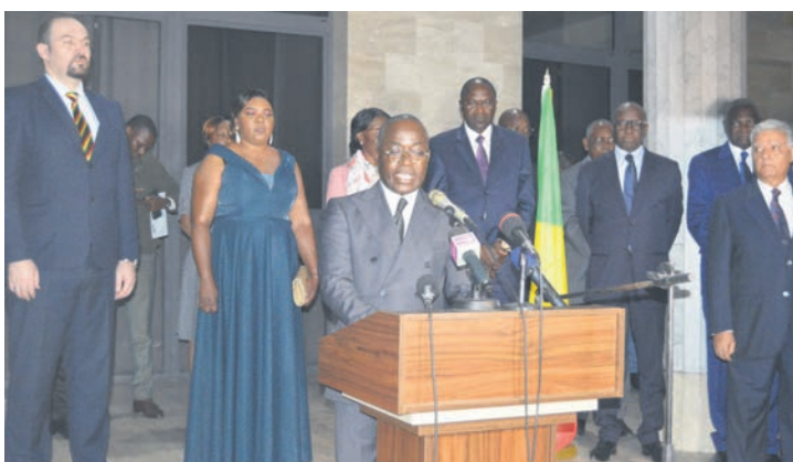
Le consul de Bulgarie annonçant les axes de coopération avec le Congo