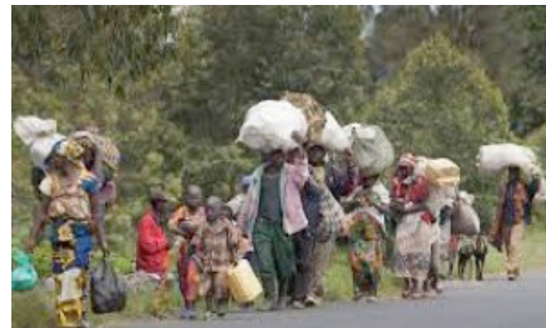
Plusieurs populations déplacées en RDC

Selon le service de la protection civile de Goma, vingt-huit déplacés de guerre de Bulengo et Bushagala à Goma, dans la province du Nord-Kivu, sont décédés des suites des maladies infectieuses au mois de juin de cette année.