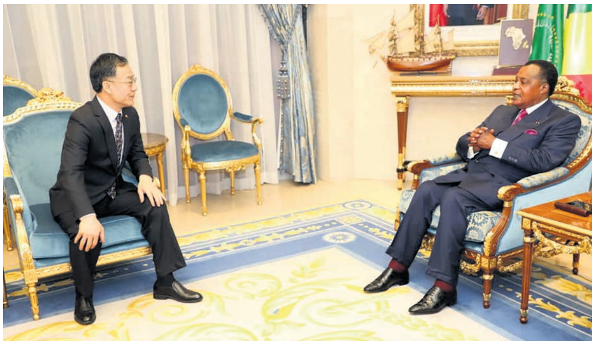
Échange entre les deux personnalités