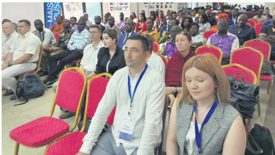
Une vue des formateurs et des apprenants

Une délégation des médecins russes en séjour à Brazzaville va se charger de former pendant cinq jours, à compter d'aujourd'hui jusqu'au 12 août, les personnels médicaux congolais dans divers sous-secteurs de la santé.