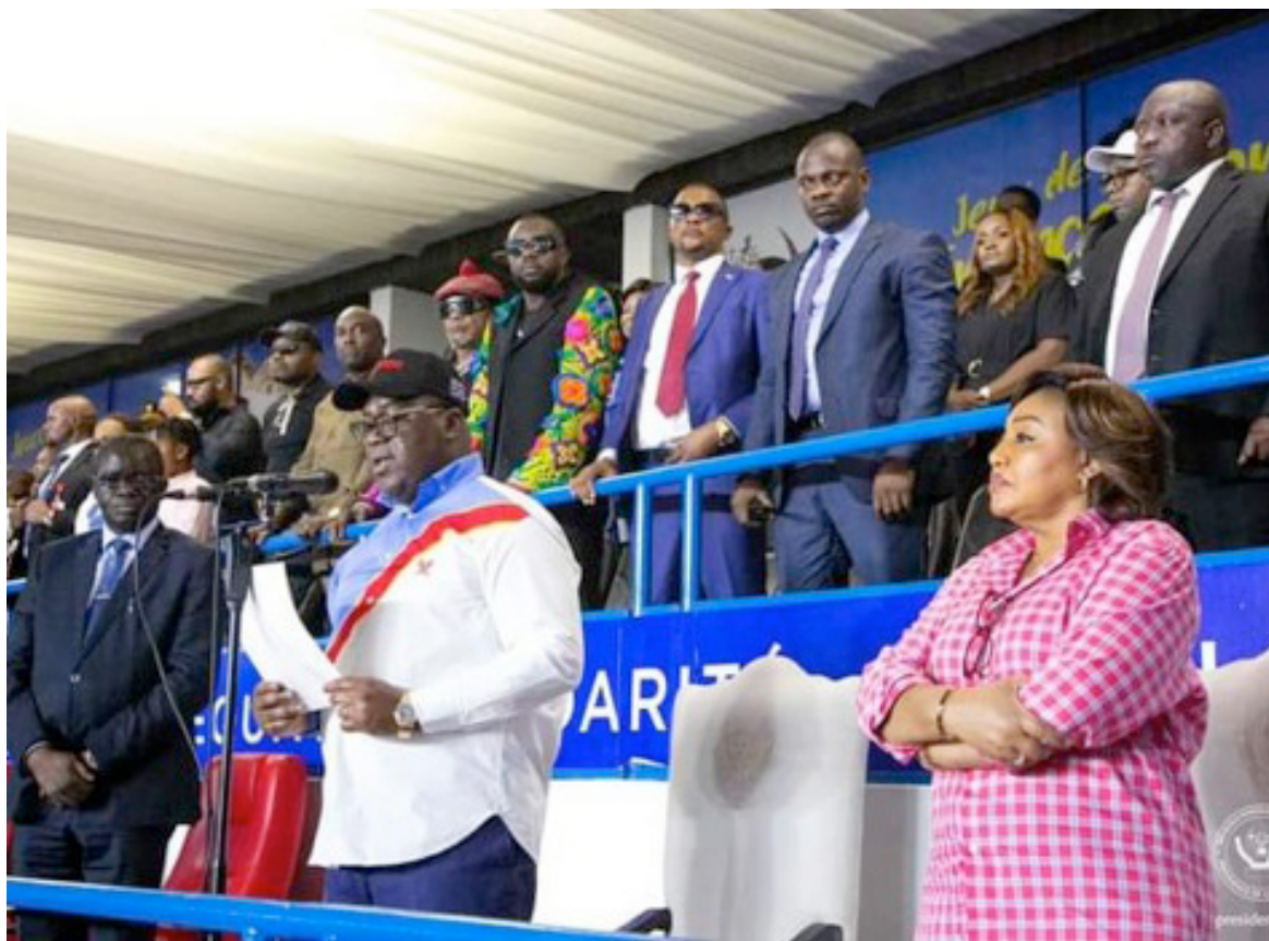
Le président Félix Tshisekedi prononçant son mot de clôture

clôture, l'autorité suprême du pays a procédé à la remise des médailles aux gagnants et aux officiels de la compétition de football remportée par le Cameroun (médaille d'or), après sa victoire (1-0) sur le Burkina Faso (médaille d'argent) en finale. Le Niger a occupé la 3e place (médaille de bronze). L'artiste musicien Ferré Gola, principale attraction de la cérémonie de clôture, s'est produit devant les officiels en play back de quelques minutes avant son grand show au Palais du peuple dans le cadre des nuits de la Francophonie. Ces 9es olympiades francophones, à la fois sportives et culturelles, se sont déroulées sans incident majeur et ont connu une affluence sans pareil. Sans doute l'un des