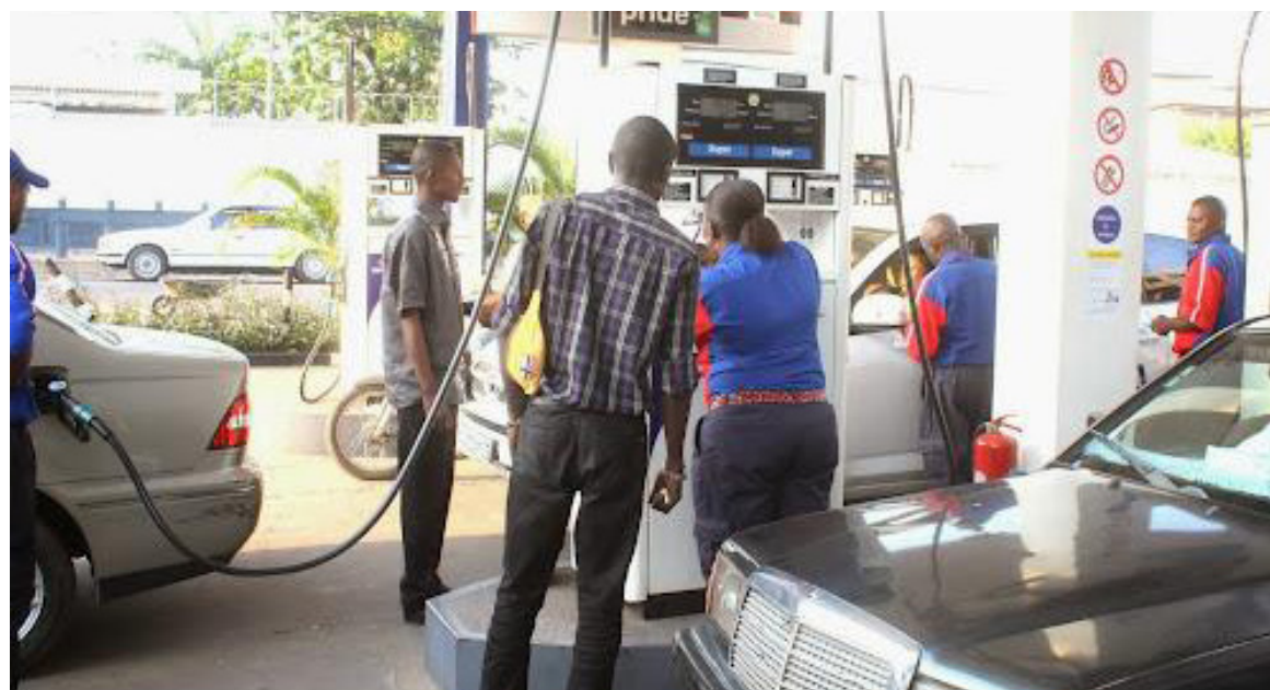
Ambiance dans une station service à Kinshasa

L'arrêté signé le samedi 5 août par les ministres de l'Économie, des Finances et des Hydrocarbures, est un signal fort que vient de lancer l'exécutif national aux sociétés pétrolières qui traversent actuellement une mauvaise passe. Incapables d'assurer ces derniers jours un approvisionnement continu en carburant notamment dans la zone ouest comprenant Kinshasa, ces sociétés ne savaient plus à quel saint se vouer. Jusqu'à la veille de la publication de l'arrêté sus évoqué, la tendance était à l'asphyxie, voire à la faillite d'autant plus qu'elles ne savaient pas recouvrer leurs créances auprès du gouvernement. La dette dont le paiement était attendu désespérément avait atteint un niveau très élevé, bloquant ainsi tout le système et empêchant lesdites sociétés d'obtenir suffisamment