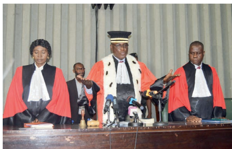
Ouverture de la session criminelle

La session criminelle s'est ouverte hier au Palais de justice de Brazzaville en présence du Garde des sceaux, ministre de la Justice, des Droits humains et de la Promotion des peuples autochtones, Aimé Ange Wilfrid Bininga. Cinquante-sept affaires sont inscrites au rôle de cette session parmi lesquelles celles concernant la Banque postale du Congo