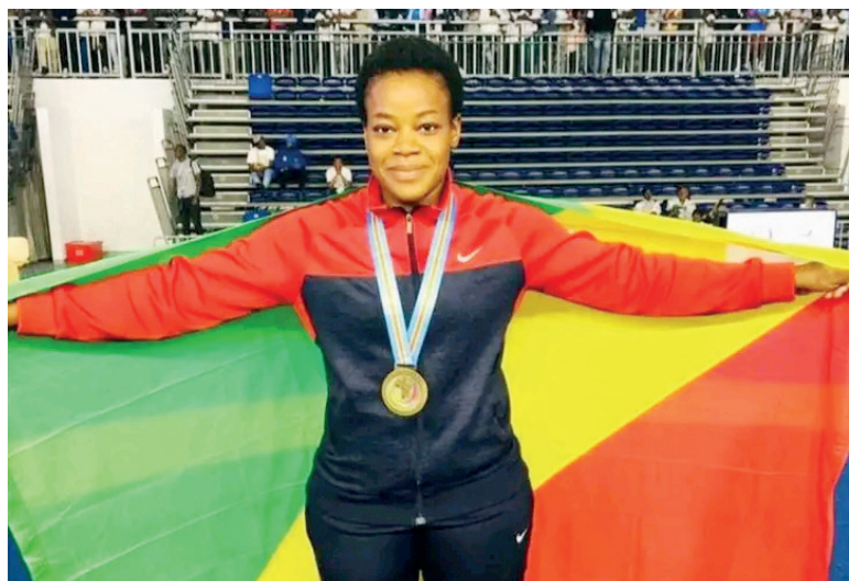
Bokilo l'une des médaillés de la République du Congo

Les 9 es Jeux de la Francophonie qui se sont clôturés dimanche à Kinshasa ont été peu glorieux pour la République du Congo classée en 22 e position au classement général avec onze médailles dont trois en argent et huit en bronze remportées dans les sports individuels. Ces résultats qui reflètent le niveau actuel des athlètes congolais sont également à l'actif de l'impréparation.