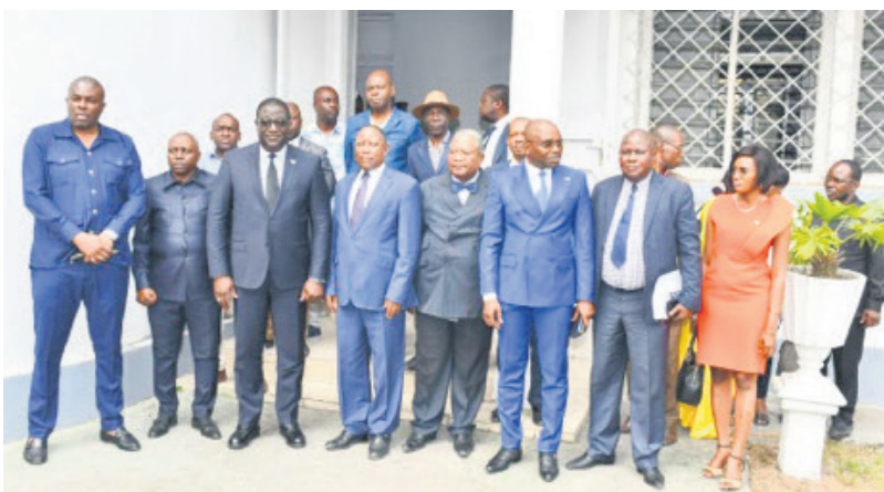
Les trois parties posant famille

La séance de travail s'est déroulée en présence des membres de la CSTC. Elle a permis aux participants de discuter sur les points bloquants et dissiper le flou. « Il n'y a jamais eu de hache de guerre, il y avait juste un malentendu qui a été réglé