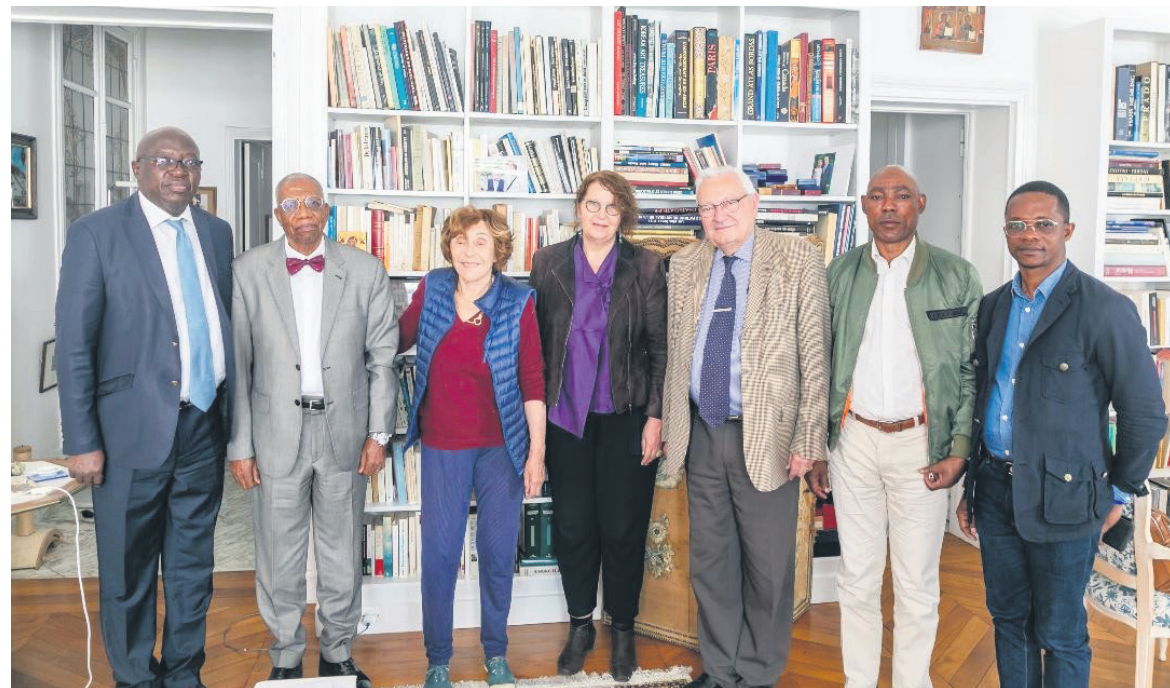
Photo de groupe de la délégation du Haut Commissariat à la justice restaurative et au traitement de la délinquance juvénile à l'issue de la réception par Édith Cresson de l'École de la 2 e Chance.

L'ancienne Première ministre, Edith Cresson, a reçu à Paris la délégation du Haut-Commissariat à la justice restaurative et au traitement de la délinquance juvénile conduite par Adolphe Mbou-Maba.