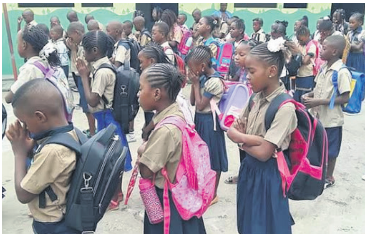
La rentrée scolaire le 2 octobre

gnement général, technique et professionnel l'uniforme est la même au collège et au lycée : chemise (deux poches avec rabats, épaulettes) et pantalon kaki pour les garçons, chemise (deux poches avec rabats, épaulettes) bleu ciel et pantalon bleu sombre de taille normale pour les filles. Au préscolaire, la tenue est composée d'un tablier de couleur rose pour les apprenants de sexe féminin, et bleu ciel pour les garçons. Quant aux écoles de formation professionnelle, ce sont les couleurs bleu, violet, blanc, vert et noir qui sont retenues. Les spécificités sont définies selon les filières.