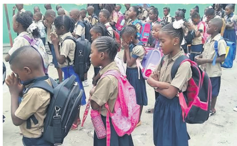
La rentrée scolaire le 2 octobre