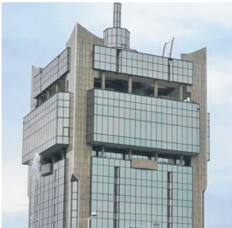
Le siège de la BEAC à Brazzaville

Le Corenofi est un dispositif de régulation des systèmes de paiement de la banque centrale qui vise à consacrer leur caractère inclusif. Il permet de fluidifier les échanges commerciaux et apporte une meilleure visibilité aux transactions interbancaires. Le conseil d'administration a, en outre, examiné la