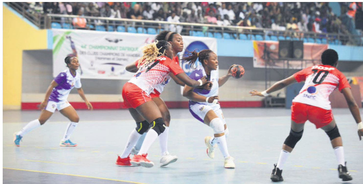
Le match DGSP-Bandama/Adiac

Au terme des rencontres de la première et deuxième journée du 44 e championnat d'Afrique des clubs de handball, les équipes congolaises n'ont pas toutes convaincu. Les quatre représentants du pays hôte ont présenté une prestation moyenne avec deux victoires et deux nuls.