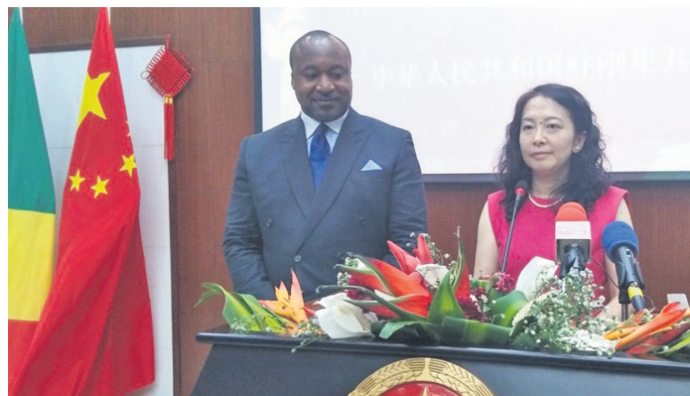
Li Yan délivrant son message

L'ambassadeur de la République populaire de Chine au Congo, Li Yan, s'est engagée, à l'occasion de la célébration du 74 e anniversaire de la fondation de son pays, à apporter sa contribution à la matérialisation du plan national de développement et à l'amélioration du bien-être de la population congolaise.