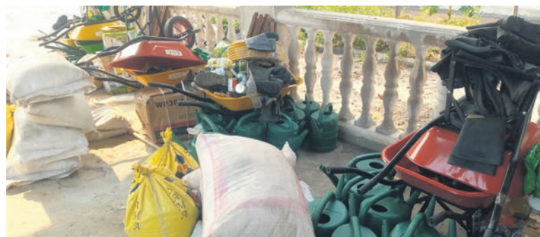
Les kits de production/Adiac

et l'agropastoral en vue de leur insertion socioprofessionnelle. La formation s'inscrivait dans le cadre de la mise en oeuvre du «Projet sur l'entrepreneuriat en vue de l'insertion socioprofessionnelle des jeunes déscolarisés et désœuvrés du département du Pool», projet pilote réalisé dans les districts de kinkala, Voka, Boko et Mindouli. A cet effet, ces jeunes se sont