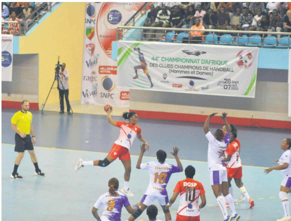
Le match d'ouverture opposant la DGSP à Bandama/Adiac