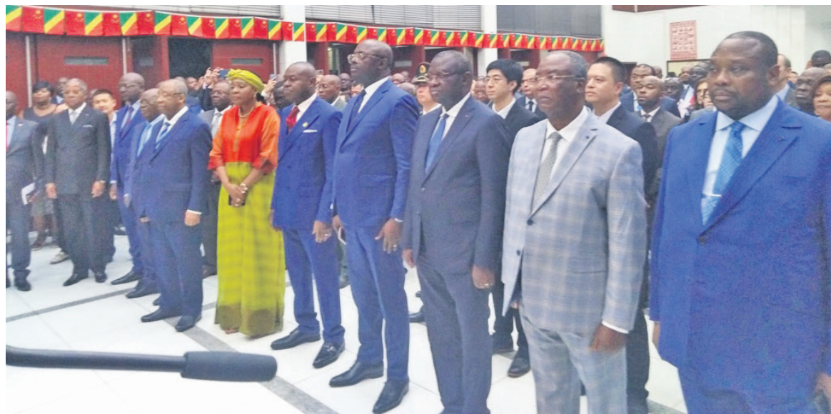
Des membres du gouvernement et autres invités de marque Adiac

La contribution de la Chine, lorsque le Congo faisait face à l'épidémie de covid-19 n'est pas passée sous silence. LI Yan a aussi cité la réalisation des récents projets qui contribuent