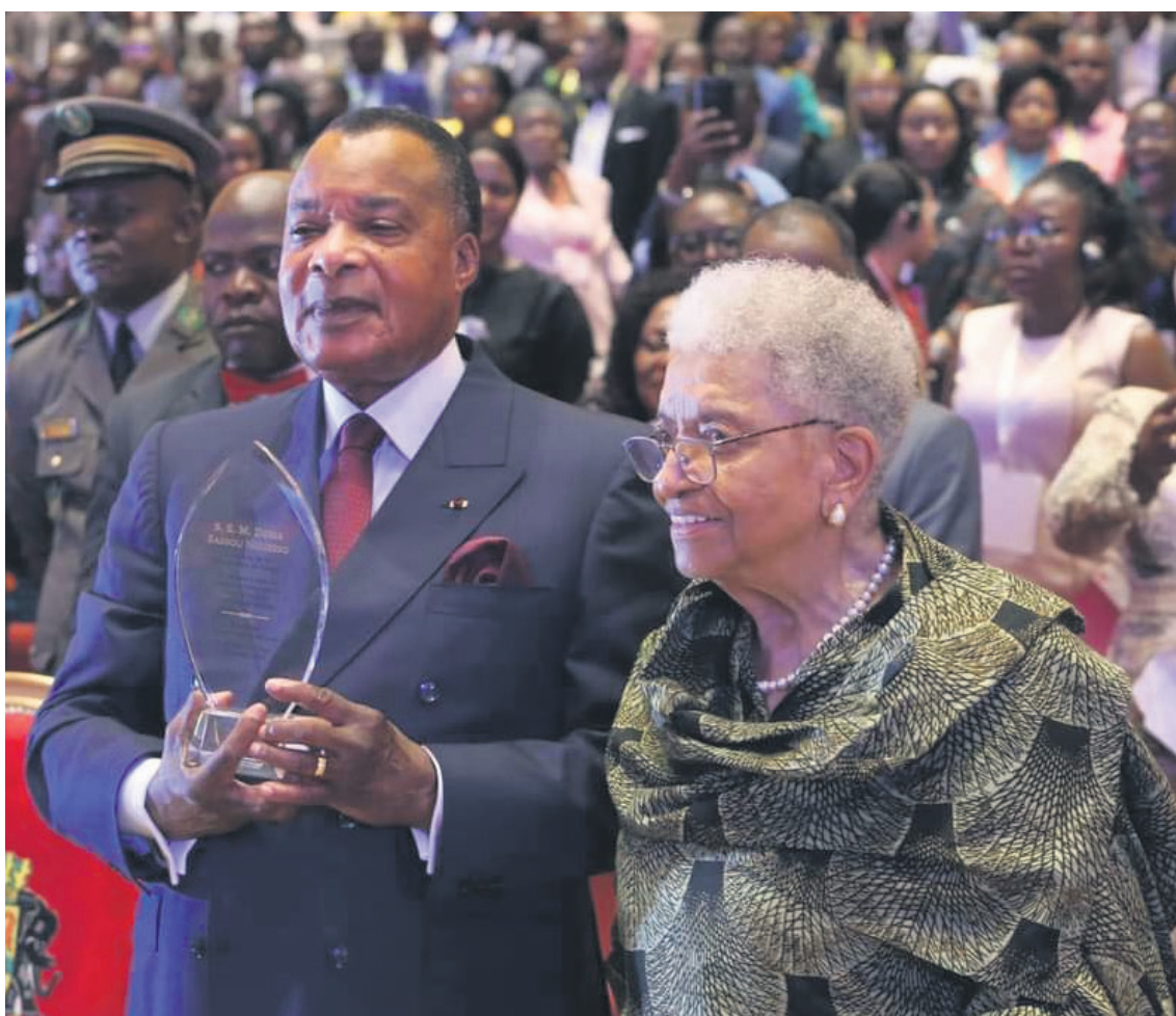
Denis Sassou N'Guesso et Ellen Johnson Sirleaf