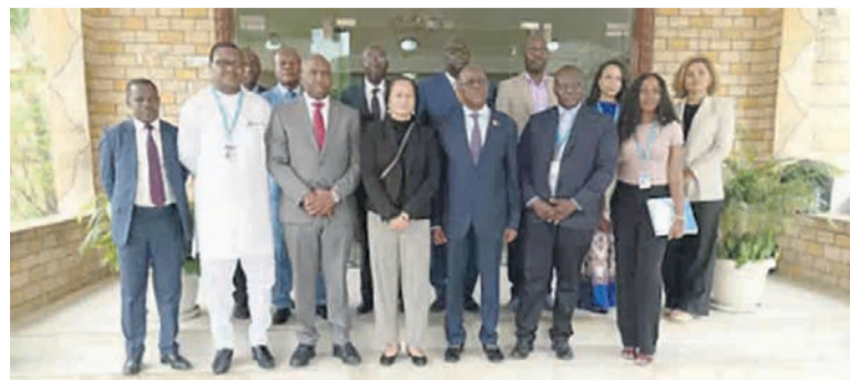
La photo de famille après les séances de travail/Adiatabwalla.

En dehors des travaux de la Cameps, les deux personnalités ont évoqué aussi les questions liées à l'amélioration de l'accès aux services de santé par les populations, surtout les personnes vulnérables. « Le Congo peut compter sur l'appui du Pnud dans plusieurs secteurs sociaux,