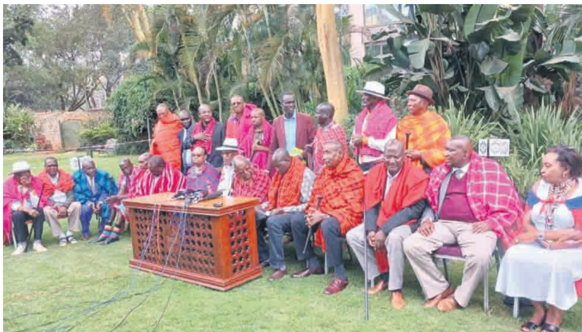
Les représentants des communautés masai du Kenya et de Tanzanie demandent au roi Charles III des gestes de réparation pour les spoliations de l'empire britannique au début du XXe siècle.