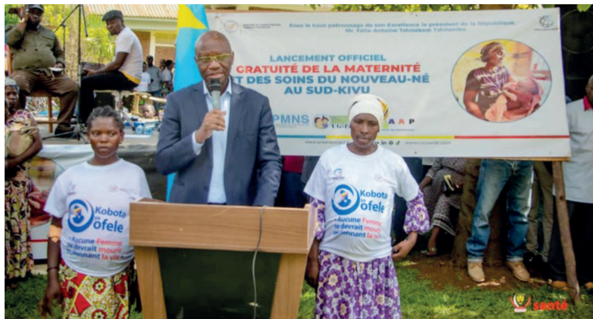
Le ministre de la Santé lors du lancement de la gratuité de la maternité dans le territoire de Kabare au Sud-Kivu

Le ministre de la Santé publique, Hygiène et Prévention, Dr Samuel-Roger Kamba, a récemment lancé à l'hôpital général de Miti-Mureza dans le territoire de Kabare, le programme de la gratuité des accouchements dans ce coin du pays. C'était l'occasion pour le ministre Roger Samuel Kamba d'expliquer l'importance de la couverture santé universelle à travers la gratuité des accouchements. Il a rappelé que ce programme est contenu dans le premier discours d'investiture du président de la République. «C'est donc un programme qui est en cours depuis que le président a décidé qu'il faille mettre l'homme au centre de notre politique», a-t-il déclaré. Il s'est passé, a-t-il renchéri, beaucoup de choses avant qu'on arrive à la gratuité des accouchements. «Le président de la République a créé des structures pour mettre la couverture santé en place. Il a décidé d'avoir un plan stratégique pour que la couverture santé universelle soit une réalité. C'est dans ce cadre-là