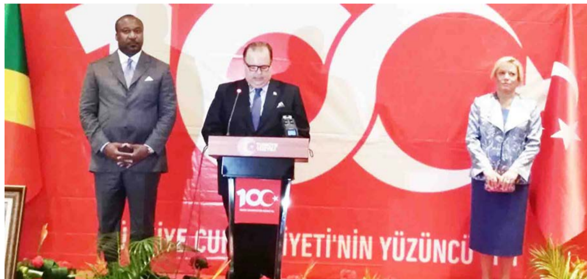
L'ambassadeur de Turquie délivrant son message

En outre, l'ambassadeur a fait savoir qu'un grand nombre d'entreprises turques sont intéressées à investir au Congo dans les domaines de l'agriculture, de la construction, de l'énergie, des mines et de la gestion portuaire. L'ouverture d'une école turco-congolaise de la fondation