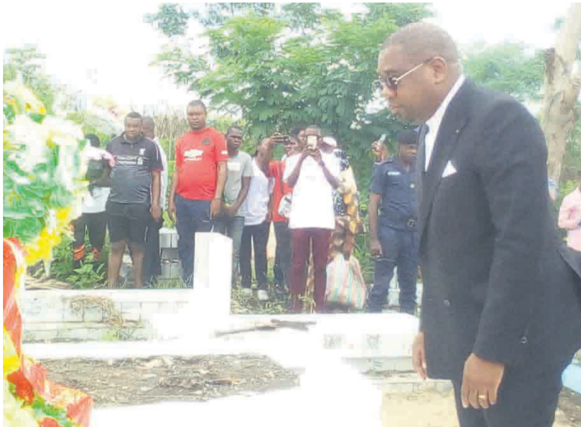
Le ministre Juste Désiré Mondelé déposant la gerbe de fleurs au cimetière d'Itatolo