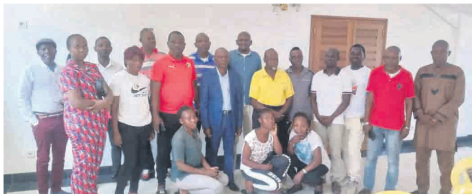
Les membres de la ligue du Pool/Adiac

Les acteurs de la ligue départementale de handball du Pool ont procédé, le 29 octobre, à Kinkala, à l'élection et à la mise en place des nouveaux membres du bureau départemental.