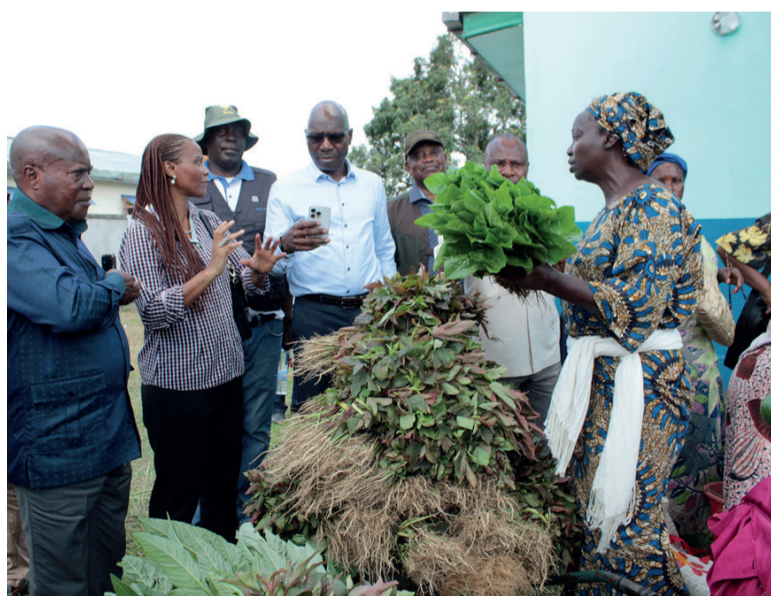
La délégation visitant la production des maraîchers de Nsougui

Le directeur des opérations de la Banque mondiale, Cheick Fantamady, a visité le 30 octobre les activités agropastorales financées par le Projet d'appui au développement de l'agriculture commerciale, notamment le centre maraî-