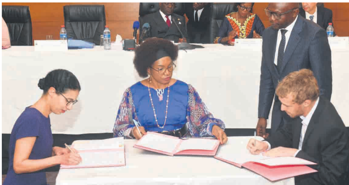
Signature de l'accord entre Cafi et le Congo/Adiac

Financé à hauteur d'un million d'euros, le projet vise notamment à économiser plus de 10 000 tonnes de bois et kilos de carbone et permettra d'appuyer un peu plus de 30 acteurs dans la fabrication des foyers améliorés. Le Premier ministre, Anatole Collinet Makosso, qui a présidé le comité de pilotage, s'est réjoui de la signature du projet d'accélération de la lutte contre la déforestation par la diffusion des foyers améliorés dit projet Lituka. Selon lui, la diffusion des foyers améliorés à Brazzaville et Pointe-Noire dans le cadre du projet Lituka est l'un des six programmes approuvés par le conseil d'administration du Cafi. S'agissant du comité de pilotage, la 4e session a permis de faire l'état des lieux de la programmation en évaluant des progrès des jalons 2019-2023 de la Lettre d'intention et en dégagant les recommandations sur l'amélioration de l'appropriation nationale des projets du portefeuille Cafi. En effet, établie pour une durée de 5 ans, la Lettre d'intention Cafi-Congo comprend des jalons sur des questions telles que le code forestier, la politique agricole, la réduction de la pauvreté, la lutte contre les changements climatiques, le développement durable et la gouvernance.