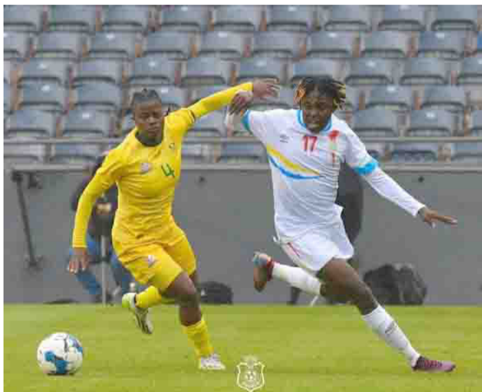
Une séquence du match entre la RDC dame et l'Afrique du Sud

Les Léopards football féminin de la République démocratique du Congo (RDC) ne participeront pas aux prochains Jeux olympiques prévus à Paris pour 2024.