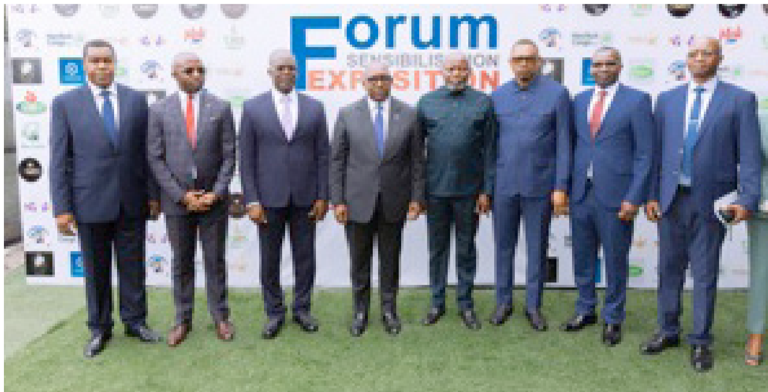
Sama Lukonde entouré de quelques personnalités

Dans son discours d'ouverture, le Premier ministre Sama Lukonde a souligné que la mise en œuvre de la Zlécaf est une étape cruciale vers l'intégration économique de l'Afrique. «Comme d'aucuns le savent, le thème de l'Union africaine (UA) pour l'année 2023 est "l'Accélération de la mise en œuvre de la Zlécaf)". À cet effet, au cours de la 36 session ordinaire de la conférence de l'UA, tenue à Addis-Abeba, en Éthiopie, du 18 au 19 février 2023, les chefs d'État et de gouvernement ont souligné que la mise en œuvre de la Zlécaf est une étape cruciale vers l'intégration économique de l'Afrique. Ce qui implique la nécessité d'inclure les questions relatives à la mise en œuvre de