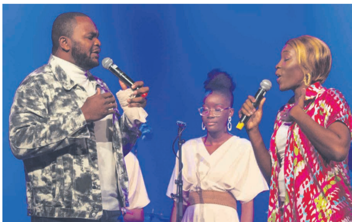
Le groupe Breil sur scène lors de la 6 e édition La nuit des talents à Bordeaux

« Avant notre arrivée, l'équipe d'organisation était à pied d'œuvre dans les derniers réglages techniques et logistiques. Et, à notre arrivée, nous avons été embarqués dans les coulisses de l'organisation, ce qui a été pour nous une belle et riche expérience. Concernant l'événement lui-même, la soirée de notre passage sur scène était simplement magnifique. Les choristes et musiciens étaient au top niveau, le public était au rendez-vous et que dire de la gestion professionnelle des techniciens qui nous a fortement impressionnés. Tout au long de notre séjour