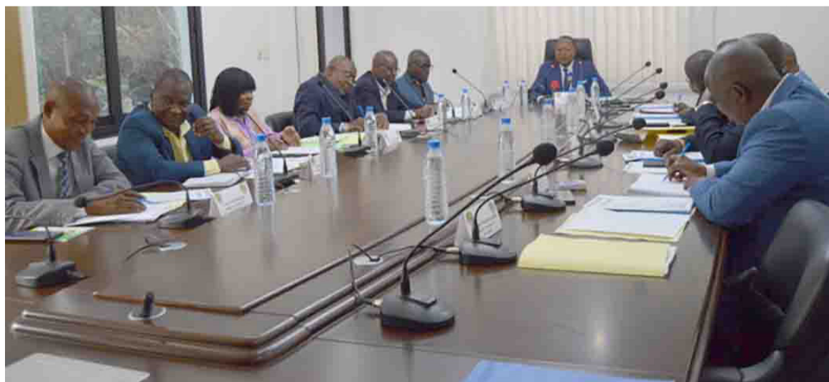
Les membres du comité exécutif de la Fécofoot/Adiac

Au cours de la réunion de mardi, la Fécofoot a procédé au dépouillement des dossiers reçus suite à l'appel à candidatures, en vue de recruter un sélec-