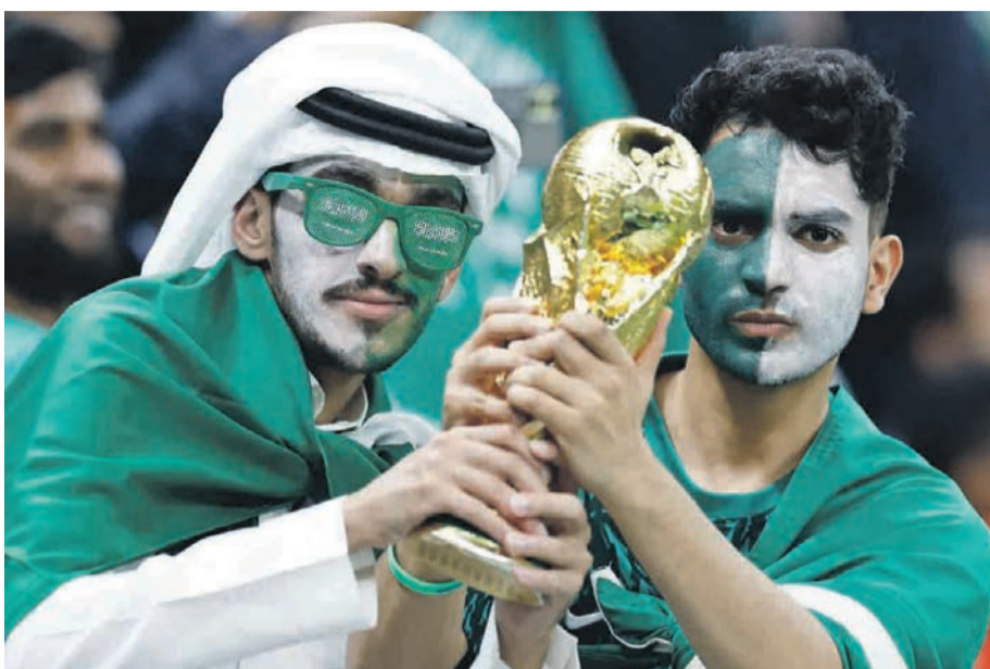
Des supporters saoudiens brandissent le trophée de la Coupe du monde

L'Arabie saoudite se prépare déjà à accueillir, du 12 au 22 décembre de cette