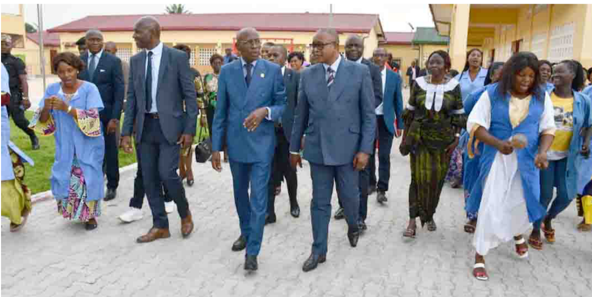
Visite d'évaluation des établissements scolaires dans le cadre du projet Durquap/Adiac