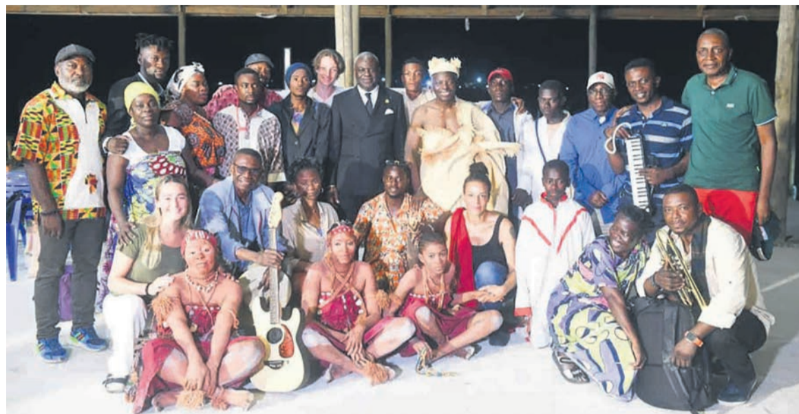
Photo de famille à la suite de la représentation du groupe culturel Village Makosso à Yanga près de Pointe Noire

Cette ode produite pour la circonstance avait commencé par un intermède théâtral de jeunes. Ensuite