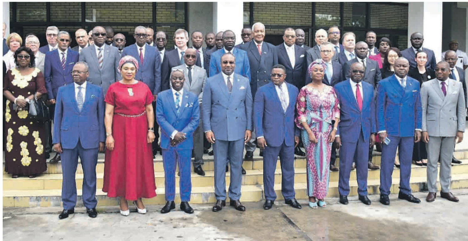
Les participants à la commémoration de la Journée des Nations unies

Ces clivages, a-t-il poursuivi, dont la nature des appartenances reste floue laissent transparaître un bicéphalisme au sein même de notre Organisation avec le risque de ramener les blocs par centre d'intérêts. « Cette année, la célébration de la Journée des Nations unies se tient dans un contexte marqué par les crises à rebondissement qui secouent notre monde, à des déchirements fractionnels mettant en péril ce multilatéralisme au point