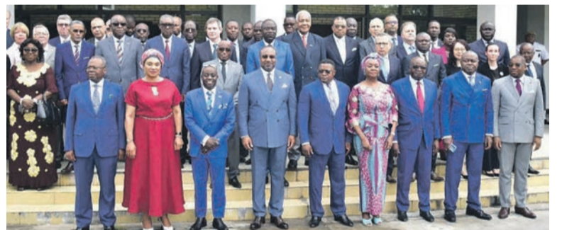
Les participants à la commémoration de la Journée des Nations unies

A l'occasion de la commémoration du 78 e anniversaire des Nations unies, les intervenants ont reconnu que l'Organisation fait face à plusieurs défis dont la conjugaison des efforts de tous est sollicitée pour les éradiquer.