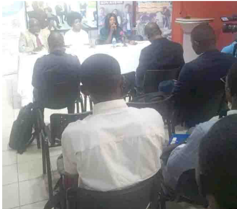
Les participants à la conférence-débat Adiac

L'association le Réseau des villes et villages amis de la Francophonie en partenariat avec la jeunesse francophone congolaise a organisé, le 31 octobre, à Brazzaville une conférence-débat sur le rôle de langue française ainsi que l'impact et l'avenir de la francophonie en Afrique, en général, et au Congo, en particulier.