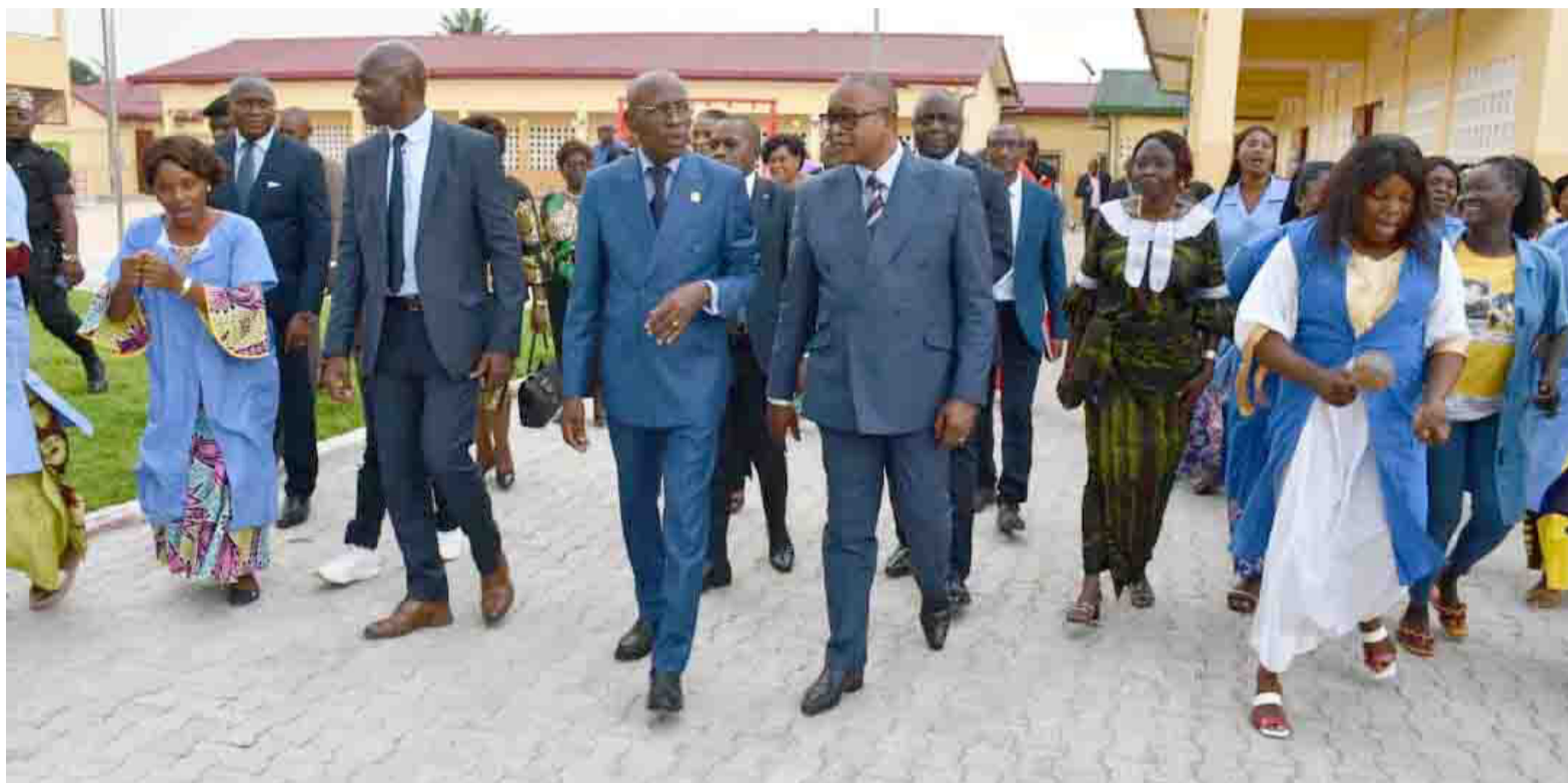
Visite d'évaluation des établissements scolaires dans le cadre du projet Durquap/Adiac