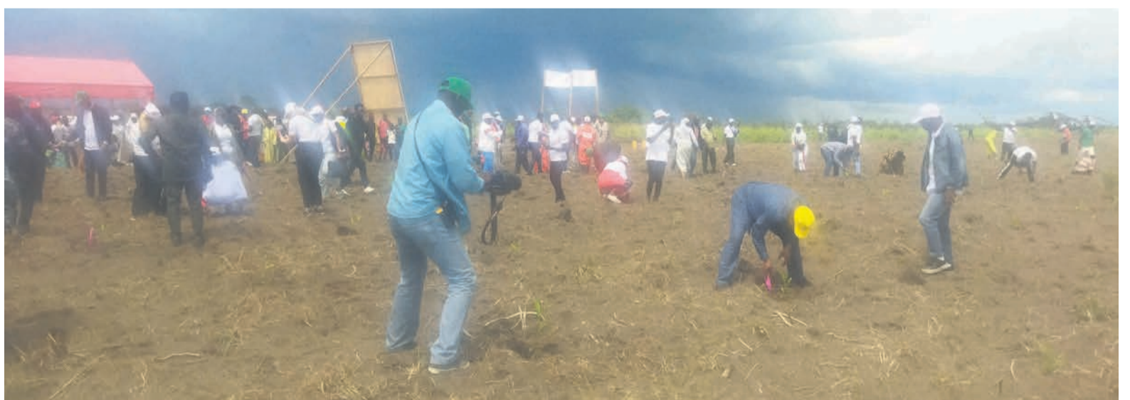
Lancement du projet « Jardin carbone de Mbé »

Le « Jardin carbone de Mbé » est un projet du gouvernement congolais initié dans le cadre du programme d'afforestation. Pour la journée du 6 novembre à laquelle ont participé les membres du gouvernement, les parlementaires et quelques ambassadeurs accrédités au Congo, 150 hectares de plants d'acacia mangium ont été plantés. Mené par la société Renco Green Sarlu, le projet d'une durée de 30 ans vise à terme la plantation d'une forêt artificielle de quarante mille hectares sur un site situé à 10 km du village Mbé, siège du royaume Téké. L'objectif du projet est de constituer le deuxième plus grand puits carbone au Congo afin de permettre au pays de contribuer à la lutte contre le changement