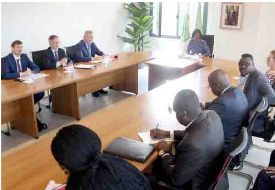
Les deux parties lors des échanges