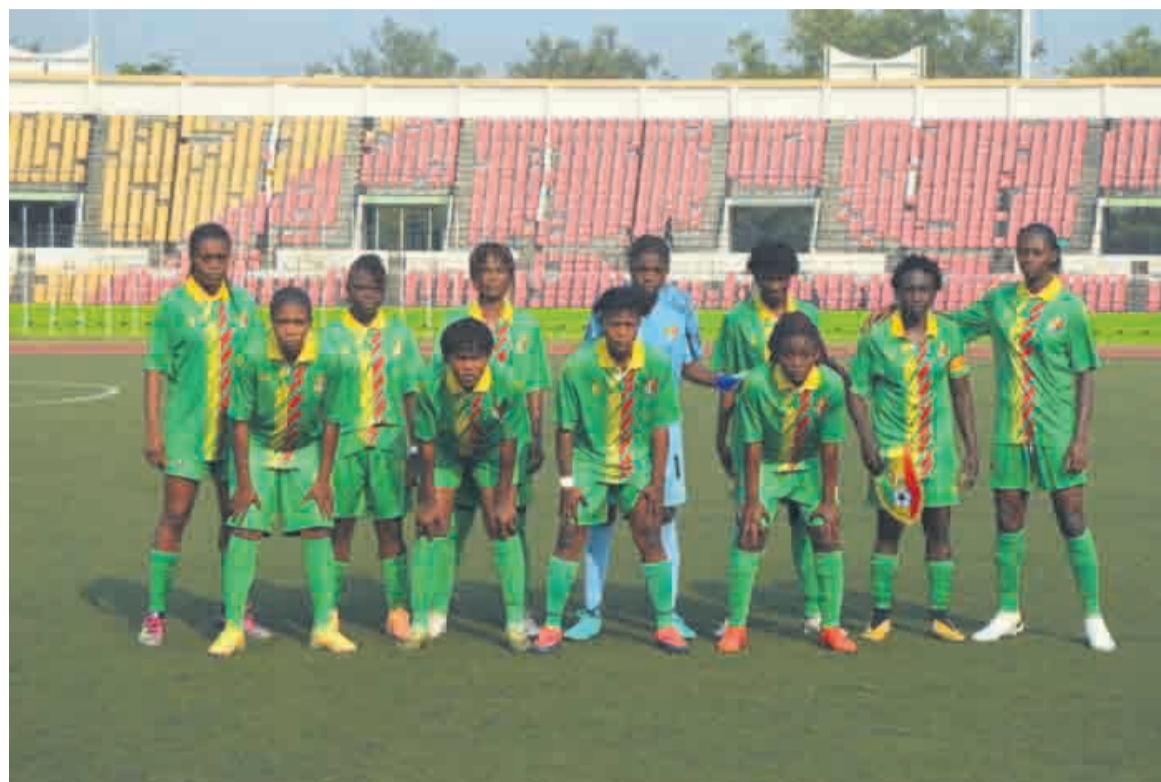
Les Diables rouges juniors dames retrouvent l'Égypte/Adiac

A l'époque, les Congolaises avaient donné une véritable leçon de réalisme aux Égypt-