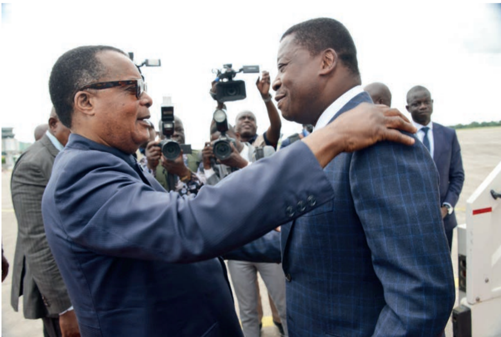
Le président Denis Sassou N'Gusso accueille le 7 novembre à l'aéroport d'Ollombo son homologue Faure Gnassingbé