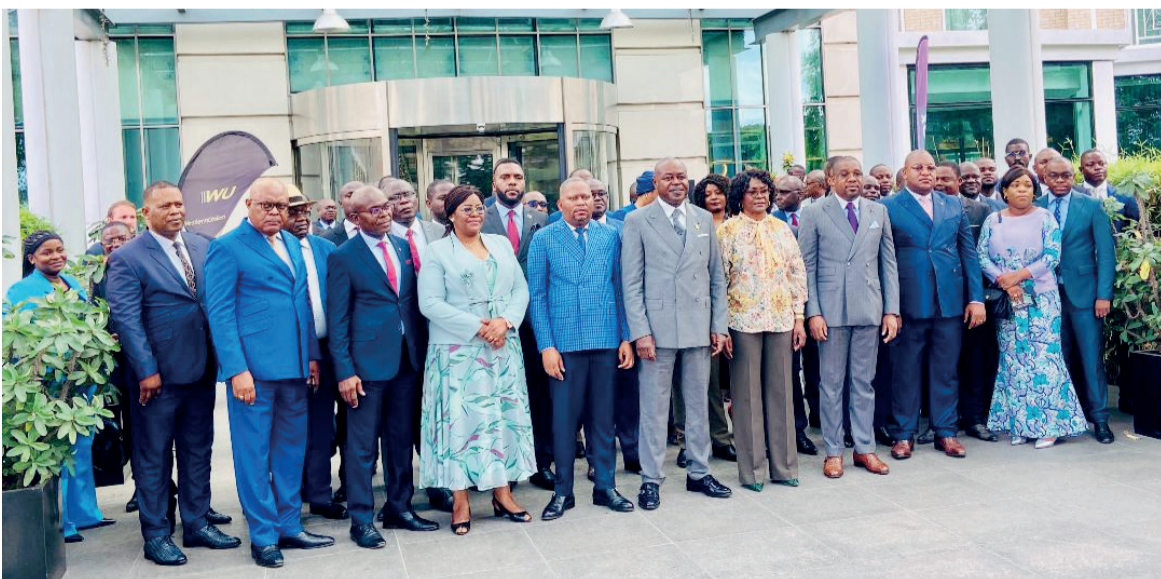
Des ministres posant avec les participants

Quatre-vingts acteurs judiciaires prennent part, du 7 au 11 novembre, à Brazzaville à un atelier sur la cybersécurité, l'intelligence artificielle et l'Etat de droit. La formation s'inscrit dans le cadre de la mise en œuvre du deuxième programme dénommé « Carria skills » du Centre africain de recherche en intel-