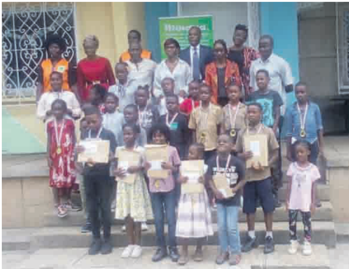
La photo de famille après la remise des distinctions aux enfants

Ouvert aux élèves du CP à la terminale, le concours Motangui, pour son édition de lancement, a réuni une vingtaine des élèves issus de six établissements sco-