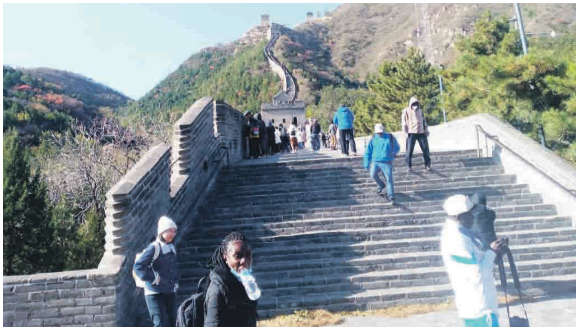
Vue d'une partie de la grande muraille de Chine

Au total, douze visites guidées ont été organisées dans la province de Ningxia, une zone industrielle, touristique et historique, entourée par des lacs. Ces découvertes de trois jours ont permis d'appréhender l'existence ancestrale des collections installées dans ces musées qui existent depuis 2000 ans avant Jésus-Christ et d'ad-