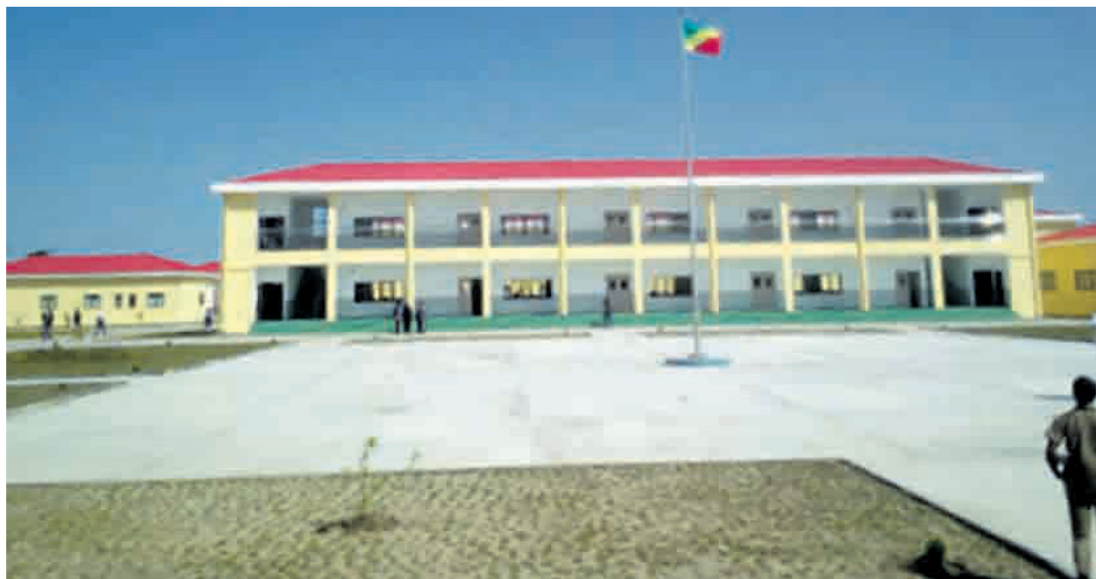
Vue d'un bâtiment abritant les salles de classe/Rock Bouka