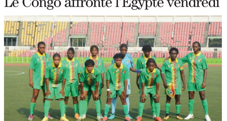
Les Diables rouges juniors dames retrouvent l'Egypte

Les Diables rouges juniors dames recevront, le 10 novembre, au stade Alphonse-Massamba-Débat à Brazzaville leurs homologues d'Egypte en match comptant pour le troisième tour aller des préliminaires de la Coupe du monde de la catégorie qui se disputera du 31 août au 22 septembre 2024 en Colombie. Le chemin menant vers la qualifica-