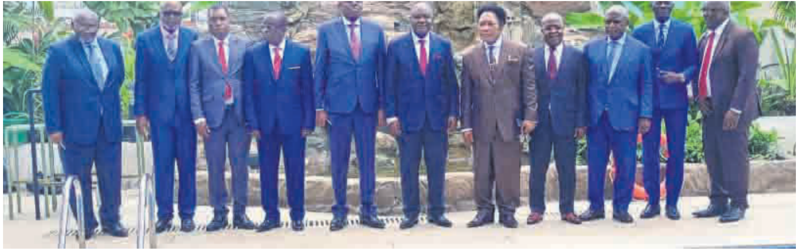
Des membres du CNTR/Adiac

La CNTR qui est une organisation publique créée pour contribuer résolument à l'amélioration de la bonne gouvernance des finances publiques au Congo devrait profiter de ces moments de réflexion et d'analyses pour examiner les rapports sur la mission d'enquête sur la mobilisation des ressources de la Caisse d'assurance maladie universelle (Camu) de 2019 à 2022. Les participants à cette quatrième session seront également informés sur la mission d'information sur la gestion financière du Centre national de transfusion sanguine (CNTS). En même temps, ils vont examiner et adopter le rapport du groupe de travail