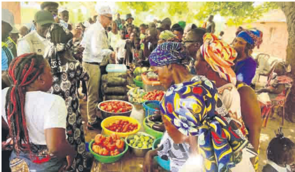
Le diplomate norvégien encourageant les bénéficiaires du projet DR

n'a pas ces impressions si l'on est derrière son bureau à Kinshasa. Je suis convaincu que ce projet fait la différence. Les gens qui travaillent ici bénéficient des opportunités que leur offre ce projet. C'est le cas par exemple de l'accord que Caritas a passé avec une propriétaire terrienne du village Ntampa pour faciliter l'accès à la terre aux ménages qu'elle encadre. Je trouve que c'est une très bonne idée », a-t-il indiqué tout en ajoutant : « Nous avons parlé aux gens qui disent que ce projet est très utile pour eux et leurs familles. En effet, ils arrivent quand même à vendre leurs produits sur le marché. Et ce projet contribue au renforce-