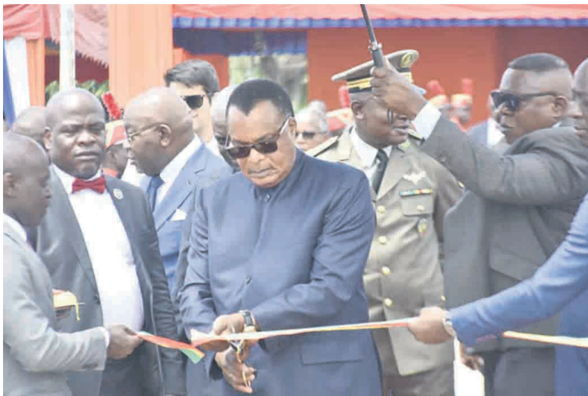
Le chef de l'État coupant le ruban symbolique.