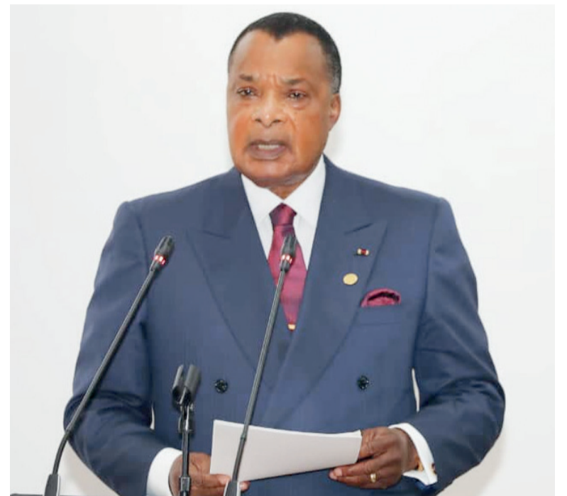
Le président Denis Sassou N'Guesso