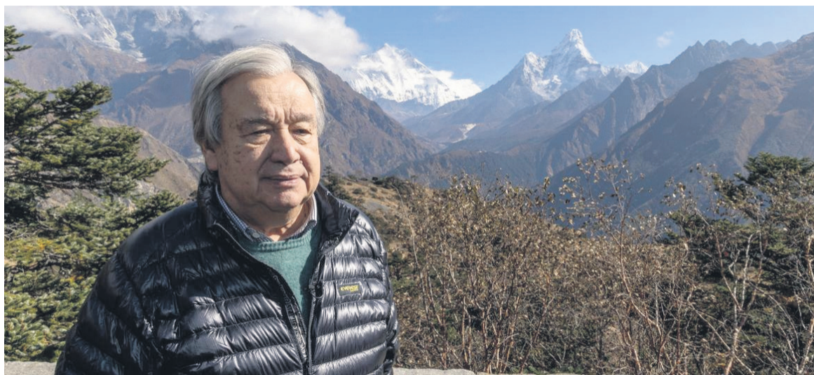
Le Secrétaire général des Nations Unies, António Guterres, visite Syangboche, dans le district de Solukhumbu, au Népal

L'ONU climat affirme que les émissions mondiales de gaz à effet de serre doivent diminuer de 45% d'ici à la fin de cette décennie par rapport aux niveaux de 2010, pour atteindre l'objectif de limiter l'augmentation de la température mondiale à 1,5 degré Celsius. Toutefois, selon son dernier rapport, les émissions devraient plutôt augmenter de 9%. Antonio Guterres a appelé à une accélération des calendriers en matière de zéro émission nette « afin que les pays développés s'approchent le plus possible de l'objectif fixé en 2040 et les économies émergentes aussi près que possible de celui de 2050 ». Il a également exhorté à accroître les investissements dans les énergies renouvelables, pour aller de pair avec l'élimination progressive des combustibles fossiles. Le chef de l'ONU a souligné que les pays développés doivent rétablir la confiance « en respectant leurs engagements financiers », ajoutant que « des progrès petit à petit ne suffiront pas ». Il est temps d'instaurer une explosion d'ambition climatique dans chaque pays, ville et secteur, selon lui. Il a