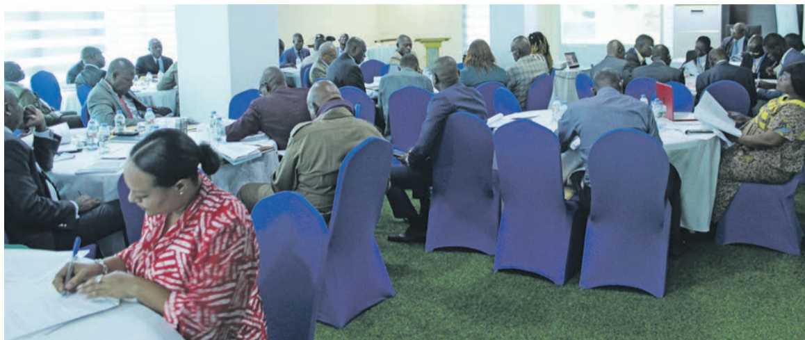
Les participants à l'atelier

Dans le rapport provisoire, les groupements Eciform-services et Uerpod ont recommandé, entre autres, la mise en œuvre de la politique nationale de sécurité alimentaire et nutritionnelle ainsi que l'encadrement des importations; la promotion de la substitution des importations des denrées alimentaires