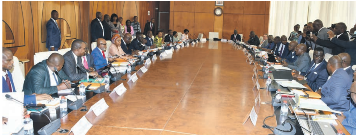
La séance de travail

Le Comité national économique et financier (Cnef), réuni le 24 novembre à Brazzaville, sous la présidence du ministre de l'Économie et des Finances, Jean-Baptiste Ondaye, a signalé la poursuite de la consolidation de la situation macro-économique du Congo au cours de l'exercice 2023, avec un taux de croissance du produit intérieur brut qui ressortirait autour de 4% au lieu de 3% comme projeté précédemment.