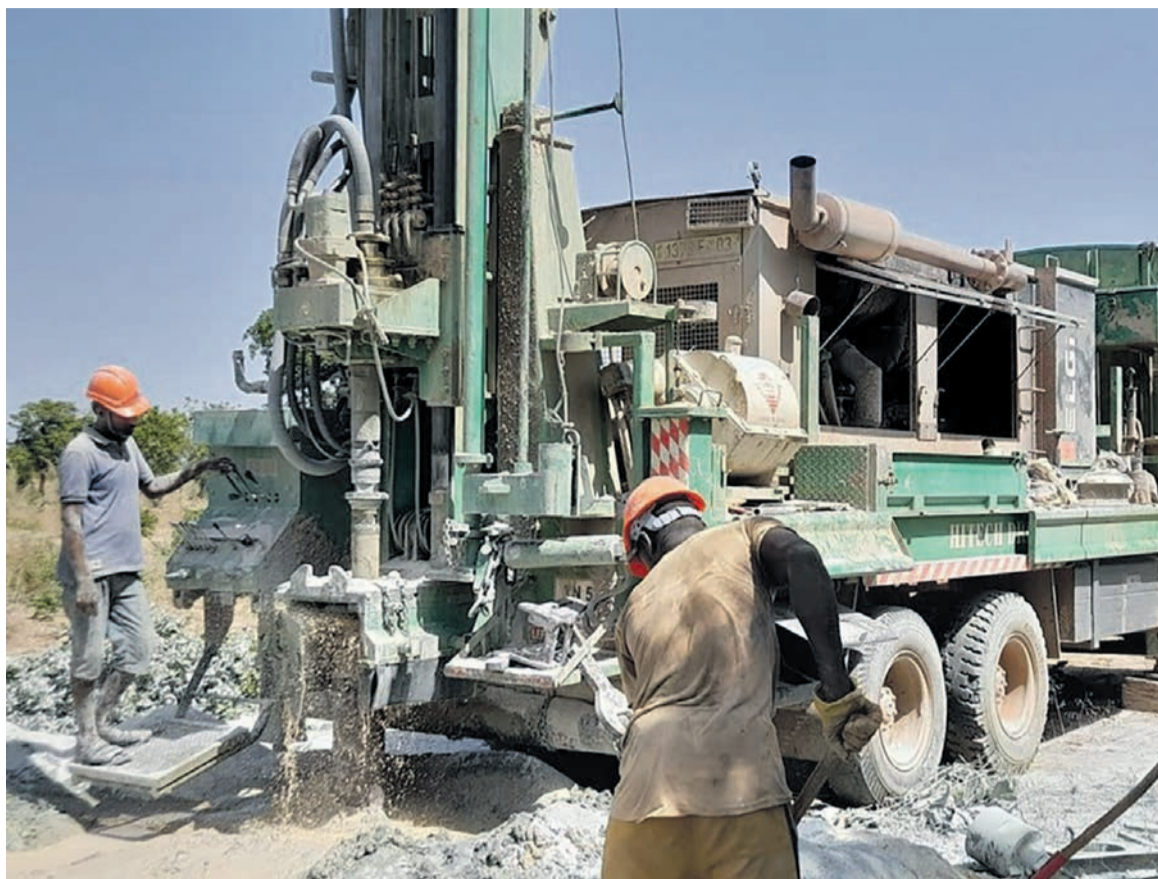
Le forage d'eau à l'Es-pace «Kongo-Burkina» de Dapélogo, au Burkina Faso, réalisé par le Réseau investir en Afrique

«Il a fallu creuser jusqu'à 85 mètres environ pour faire jaillir l'eau pure »,