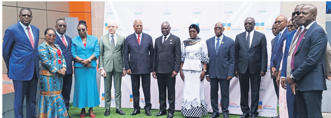
Les officiels après le lancement de l'opération

Le Premier ministre, Anatole Collinet Makosso, a officiellement lancé, le 24 novembre à la direction générale de Congo Télécom, l'opération d'enrôlement biométrique des assurés de la Caisse d'assurance maladie universelle (Camu) de Brazzaville pour une durée estimée à trois mois.