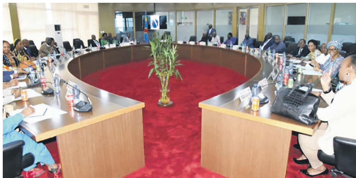
Une vue de la réunion restreinte du Conseil des ministres du 22 novembre 2023

« Le Premier ministre, chef du gouvernement, a présidé, le mercredi 22 novembre 2023, la troisième réunion restreinte du Conseil des ministres. Quatre points étaient inscrits à l'ordre du jour de cette réunion restreinte, à savoir; communication du Premier ministre, chef du gouvernement; point d'information; examen et adoption des dossiers; puis examen et adoption des textes. Dans sa communication, le Premier ministre, chef du gouvernement, est revenu sur la nécessité d'assurer la continuité des services publics, parce que cette réunion était la