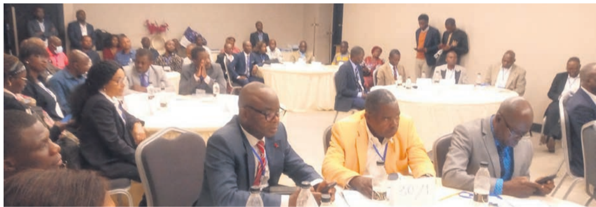
Les acteurs de mise en œuvre du FBP/Adiac

Les membres des Conseils départementaux et des districts sanitaires sont en formation, du 24 au 29 novembre à Kintélé, sur le financement ayant pour base la performance (FBP).