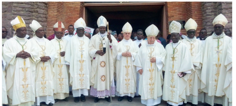
Les évêques du Congo

A l'instar d'autres conférences épiscopales d'Afrique et d'ailleurs, l'épiscopat du Congo récuse le « Fiducia Supplicans » proposé par le Saint-Père, le pape François, concernant les bénédictions des couples de même sexe.