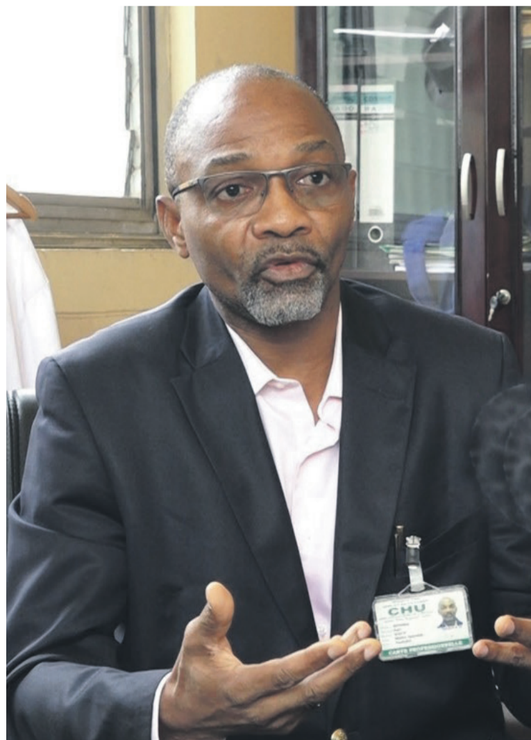
Le nouveau président de l'Ordre national des médecins du Congo DR

Pour bien mener son action à la tête du Conseil national de l'Ordre des médecins du Congo, le Pr Alain Mouanga a promis s'appuyer sur les fondations bâties par ses prédécesseurs qu'il considère comme ses maîtres. « C'est sur la base de ces fondations-là que nous allons construire la réforme et le