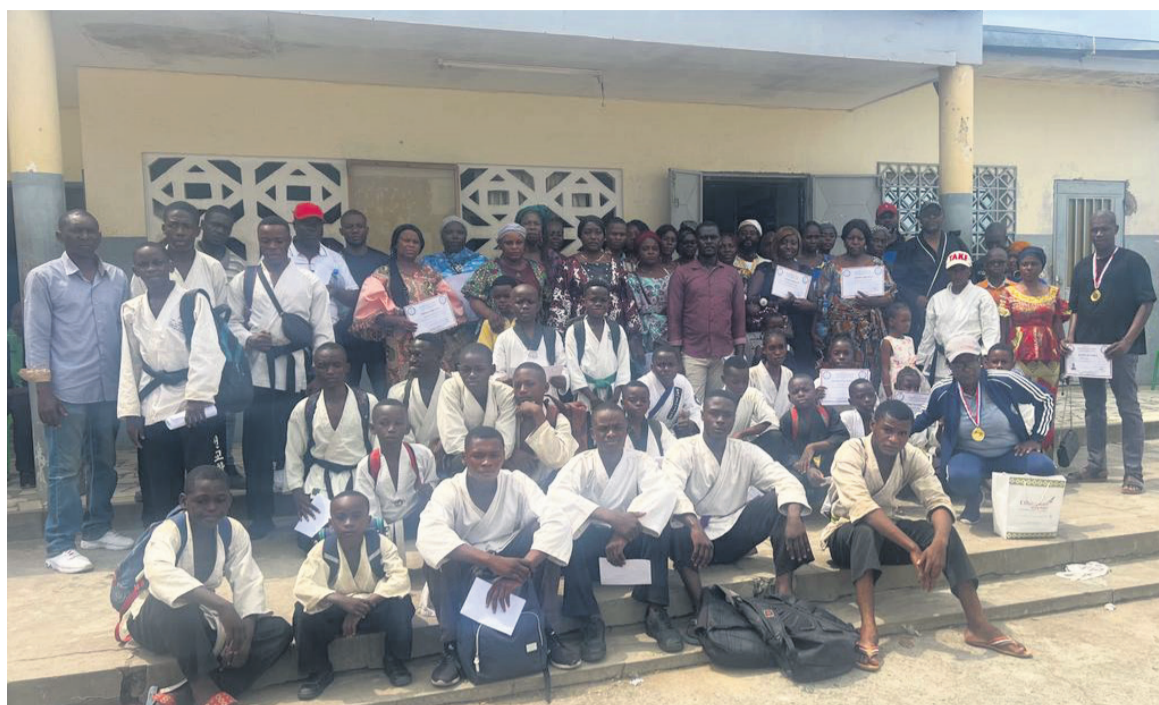
Les membres du CSF/Adiac