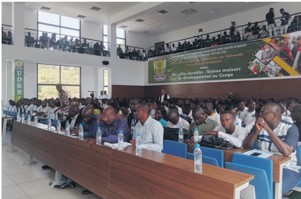
Echanges entre les étudiants de l'UDSN et ceux de l'UMNG/Adiac

Dans leur ronde, les étudiants de l'UMNG sont allés jusqu'au centre médical de l'UDSN où les apprenants malades prennent les premiers soins. Ensuite, ils se sont