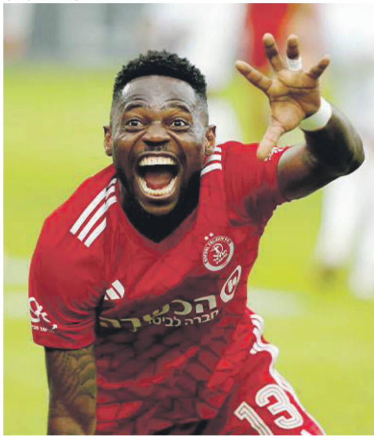
Une passe décisive et un but: la panthère a contribué à la victoire de l'Hapoel Haifa sur Petah Tikva