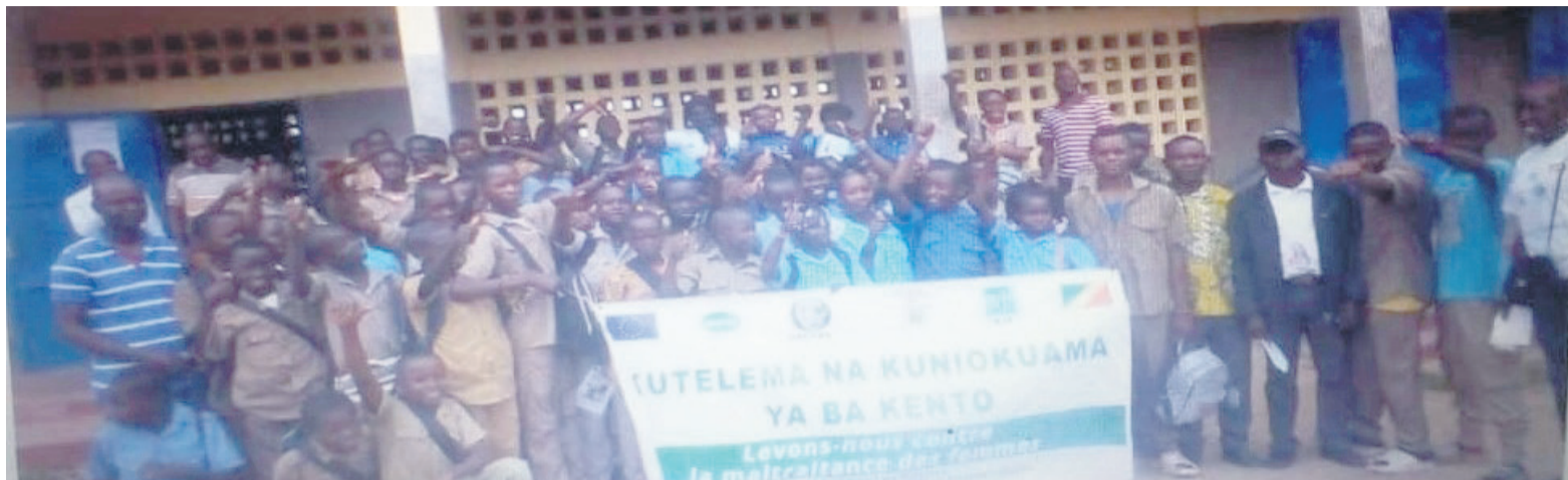
L'ambiance après la sensibilisation à La Loémé

L'activité a été organisée dans le cadre de la mise en œuvre du projet « Kutelema na kuniokama ya ba kento », entendez, « Levons-nous contre la maltraitance des femmes », mis en œuvre par l'AJS en collaboration avec la fondation Avsi, demandeur principal du projet financé par l'Union européenne. Elle a eu lieu dans les villages de Makola et la Loémé en raison de plusieurs facteurs socio-culturels non négligeables qui exposent les jeunes filles de ces contrées à plusieurs dangers, à savoir l'éloignement du collège les obligeant à vivre loin des parents en louant des maisons avoisinantes ou ense faisant héberger par des tiers, précarité des parents, vulnérabilité, harcèlement de toutes sortes... Autant de facteurs défavorisant qui les exposent à l'inceste et à la pédophilie.