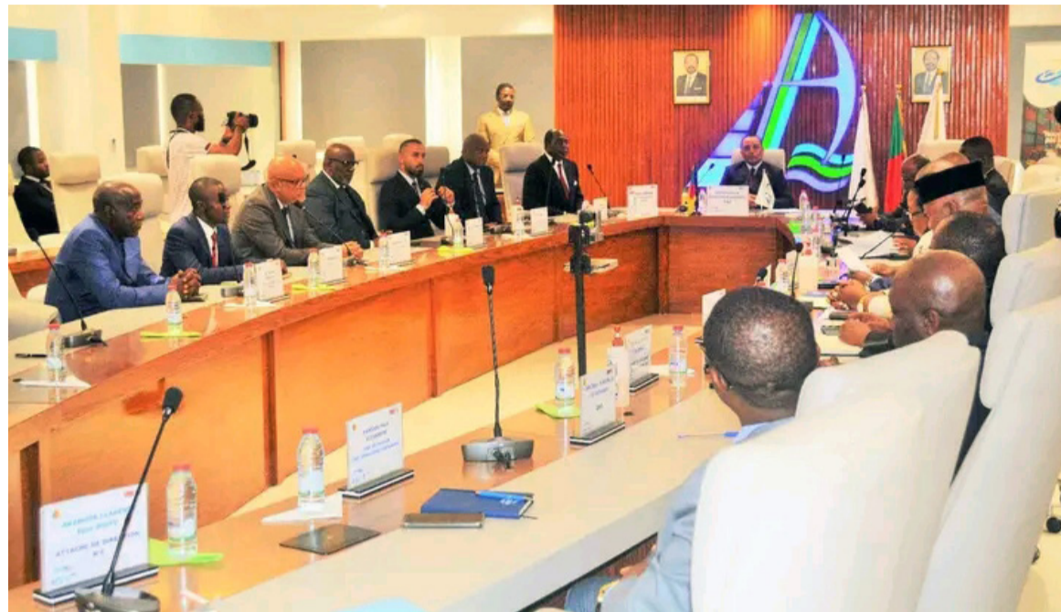
Les deux parties lors de la signature de la convention

Prévus pour une durée de trois ans, les travaux d'aménagement du PAD seront exécutés