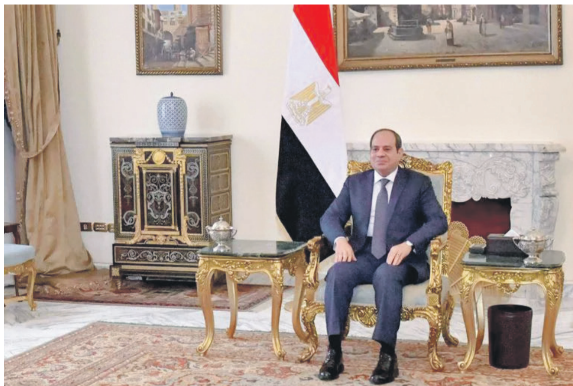
Le président égyptien Abdel Fattah al-Sissi (illustration)

AVIS À MANIFESTATION D'INTÉRÊT (SERVICES DE CONSULTANTS) REPUBLIQUE DU CONGO