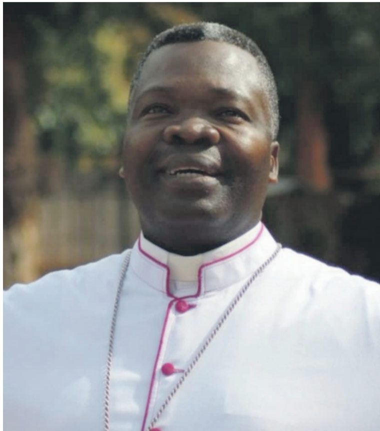
Le président de la Conférence épiscopale du Congo-Brazzaville, DR

Par ailleurs, archevêques et évêques du Congo-Braz-