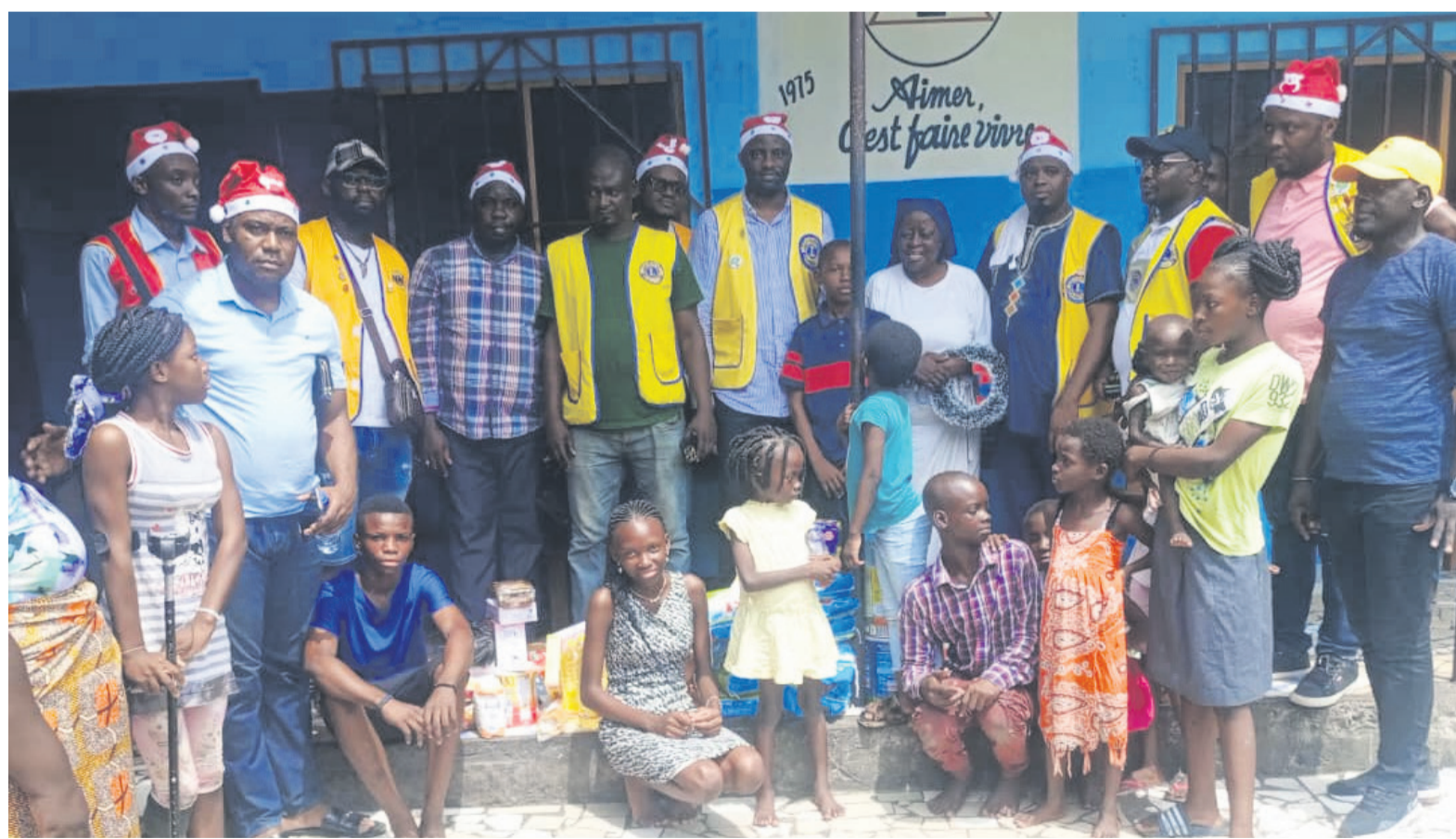
Les membres de Lions club de Brazzaville posant avec les enfants

Partout, la joie était visible sur les visages des bénéficiaires. Ils ont énormément apprécié l'initiative et souhaité qu'elle soit pérenne. « Une maison sans père est une maison malheureuse. Vous êtes des pères, lorsque vous n'êtes pas là, nous sommes tristes, merci beaucoup