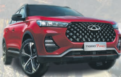
TIGGO 7 PRO