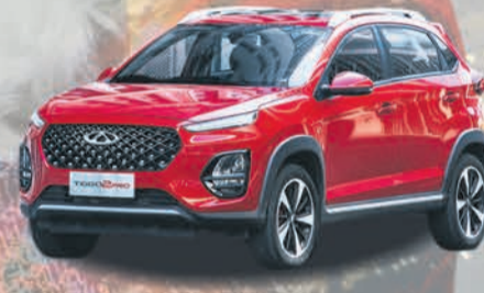
TIGGO 2 PRO