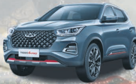
TIGGO 4 PRO