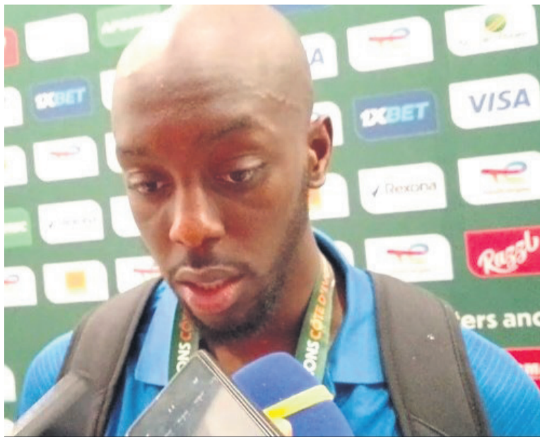
Yoane Wissa, buteur congolais contre la Zambie

Réagissant sur Canal + à la fin de la partie, Sébastien Desabre a, pour sa part, souligné: « Je n'ai rien à reprocher à mes joueurs. Par rapport à la physionomie du match, on devait gagner, mais on ne l'a pas fait. J'ai le sentiment d'avoir vu mon équipe bien travailler mais ne pas être récompensée avec le résultat qu'on attendait ». Se projetant déjà sur le prochain match contre le Maroc, le technicien français a laissé entendre: « Contre le Maroc, on mettra en place une stratégie de jeu pour