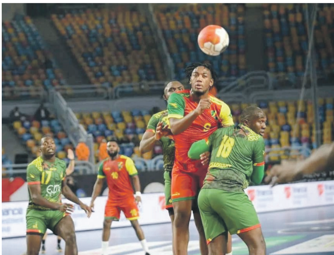
Une attaque du Congo neutralisée par le Cameroun/Adiac

De retour sur la scène continentale, quatre ans après, le Congo a payé cash son manque de matches amicaux. Le Cameroun a, en effet, marqué son empreinte dès les premières secondes de la rencontre en utilisant la force. Les Congolais n'ont pas eu le temps d'observer leurs adversaires jusqu'à la 10e minute, l'écart était de cinq buts (8-3). A la mi-temps, les Camerounais avaient creusé l'écart de plus belle. Si la première période était troublante pour les Congolais, la seconde a permis au sélectionneur, Younes Tatby, de leur parler afin qu'ils déroulent enfin leur jeu. Malheureusement, les échecs du début ont joué en faveur de leurs adversaires. De 13-9 à la pause, le Congo a tenté de remonter jusqu'à 18 buts partout, à la 21e minute. Le savoir-faire des Congolais a fait douter les Camerounais mais