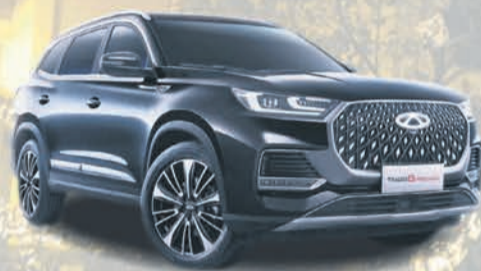
TIGGO 8 PRO 4x4