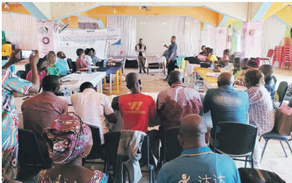
Des participants à l'atelier

Pour les organisateurs et les facilitateurs, toutes ces notions abordées concourent à la lutte contre la malnutrition sous toutes ses formes. Ils se devaient alors d'en faire un rappel ou un briefing à l'intention des prestataires des soins avec lesquels les équipes du projet PMNS-NAC sont ap-