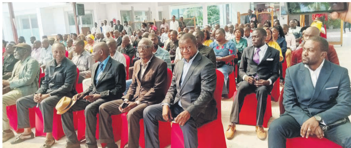
Les membres et sympathisants des partis du centre/Adiac

L'actuelle loi électorale va être révisée dans les tout prochains mois, ont confié les partis politiques du centre à leurs militants, le 15 mars à Brazzaville, lors de la restitution des conclusions de la réunion qu'ils ont tenue avec le ministre de l'Intérieur, de la Décentralisation et du Développement local, Raymond Zéphirin Mboulou.