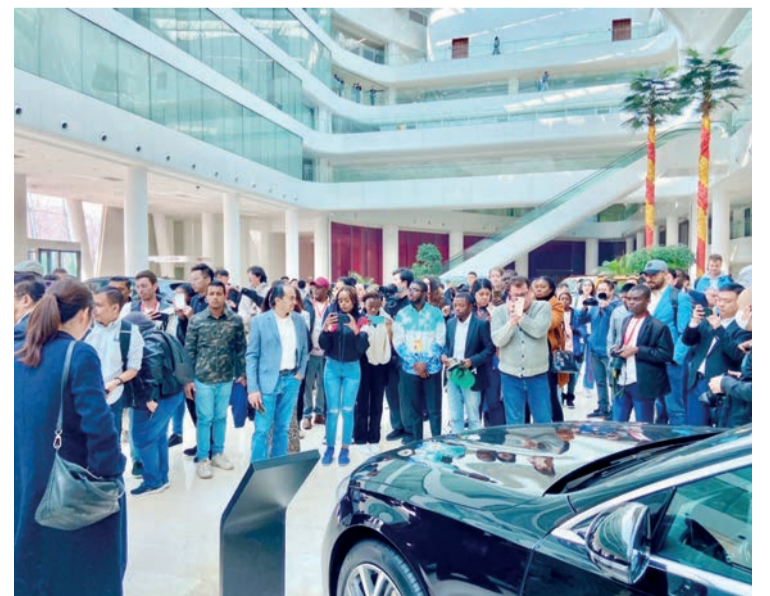
Des journalistes visitant le groupe automobile BAIC/Adiac