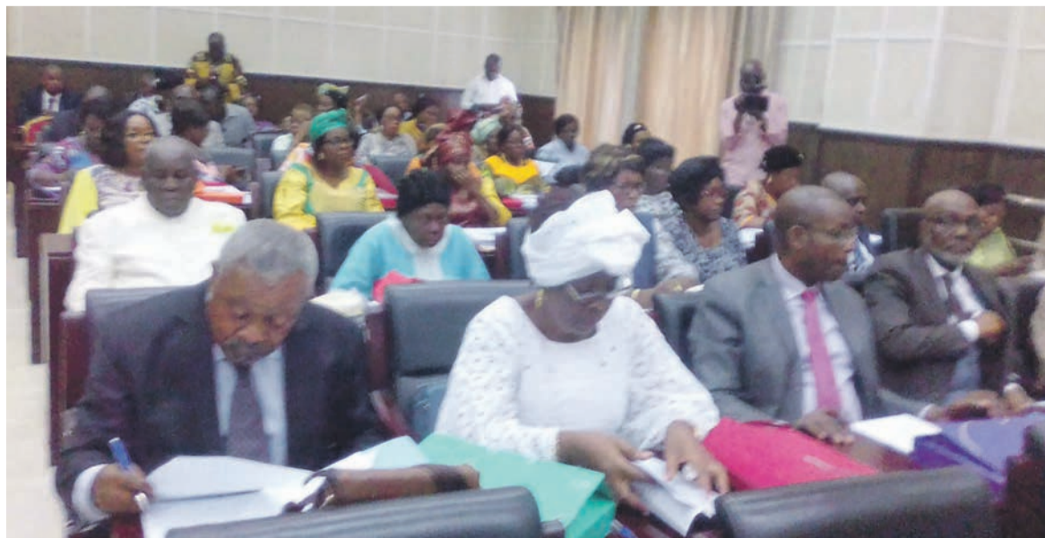
Des membres du CESE/Adiac