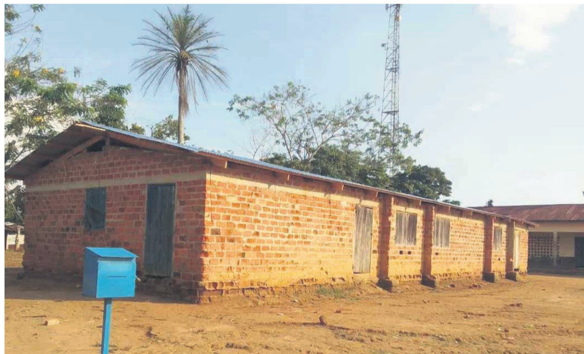
La toiture de l'école primaire Liele-Nkama totalement restaurée

Cette école abrite également les provisions essentielles destinées à la cantine scolaire du Programme alimentaire mondial, fournissant des repas nutritifs à de nombreux enfants et favorisant ainsi l'éducation et leur bien-être. Grâce à l'engagement et à la générosité d'Espace Opoko, la toiture endommagée a été réparée entièrement, offrant ainsi un environnement sûr et sécurisé aux élèves et au