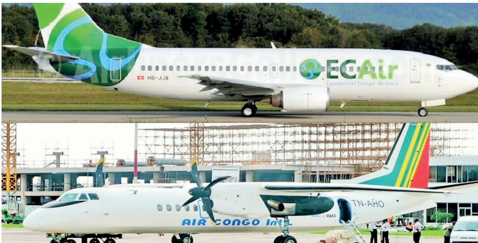
Les aéronefs appartenant aux trois anciennes compagnies DR

Le rapport de mars sur la note de conjoncture économique du Congo concernant le transport aérien relève un déclin du trafic commercial national à -35,2% et une baisse des mouvements d'avions de -7,3% en glissement annuel.