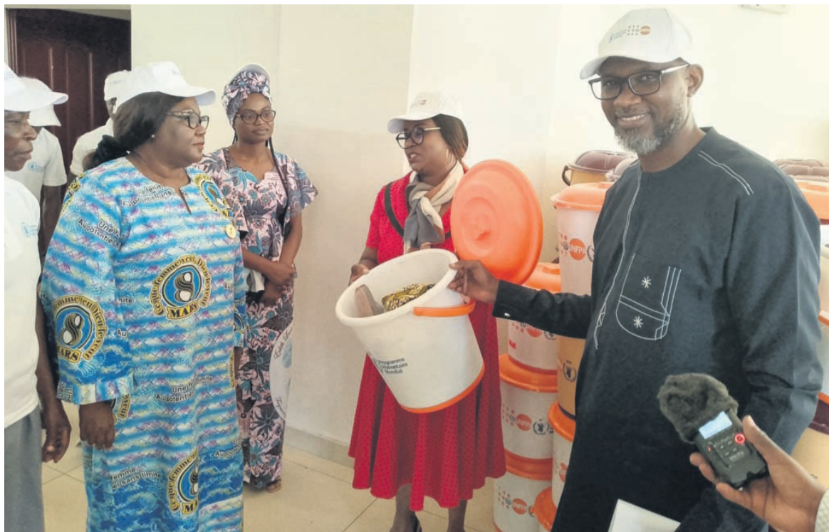
La remise des kits dits de la dignité à l'hôpital de base de Kinkala/Adiac

Si le changement de comportement est considéré comme la clef de la lutte, celui-ci passe par la révision de certains sté-