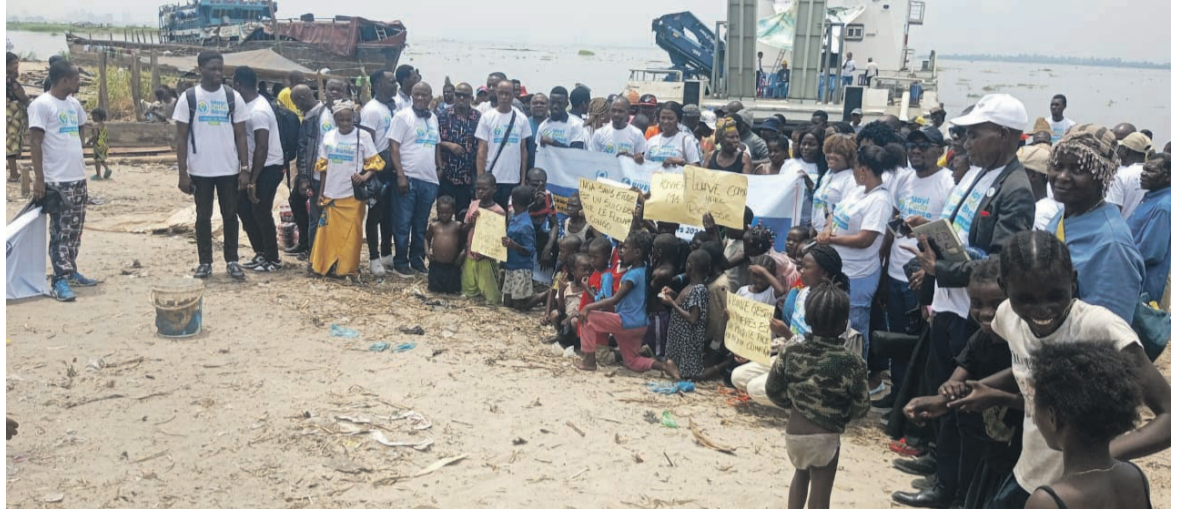
Des acteurs de la société civile sur l'île Mongole/Adiac

Les participants à ces échanges ont également relevé l'insuffisance de l'actuel cadre légal du secteur de l'eau sur la problématique de la gestion durable des ressources en eau. Ce constat les a conduits à recommander au gouvernement d'identifier les sites les plus sécurisés où il peut déplacer la population et les ménages qui occupent encore les sites inondables. Ils ont également