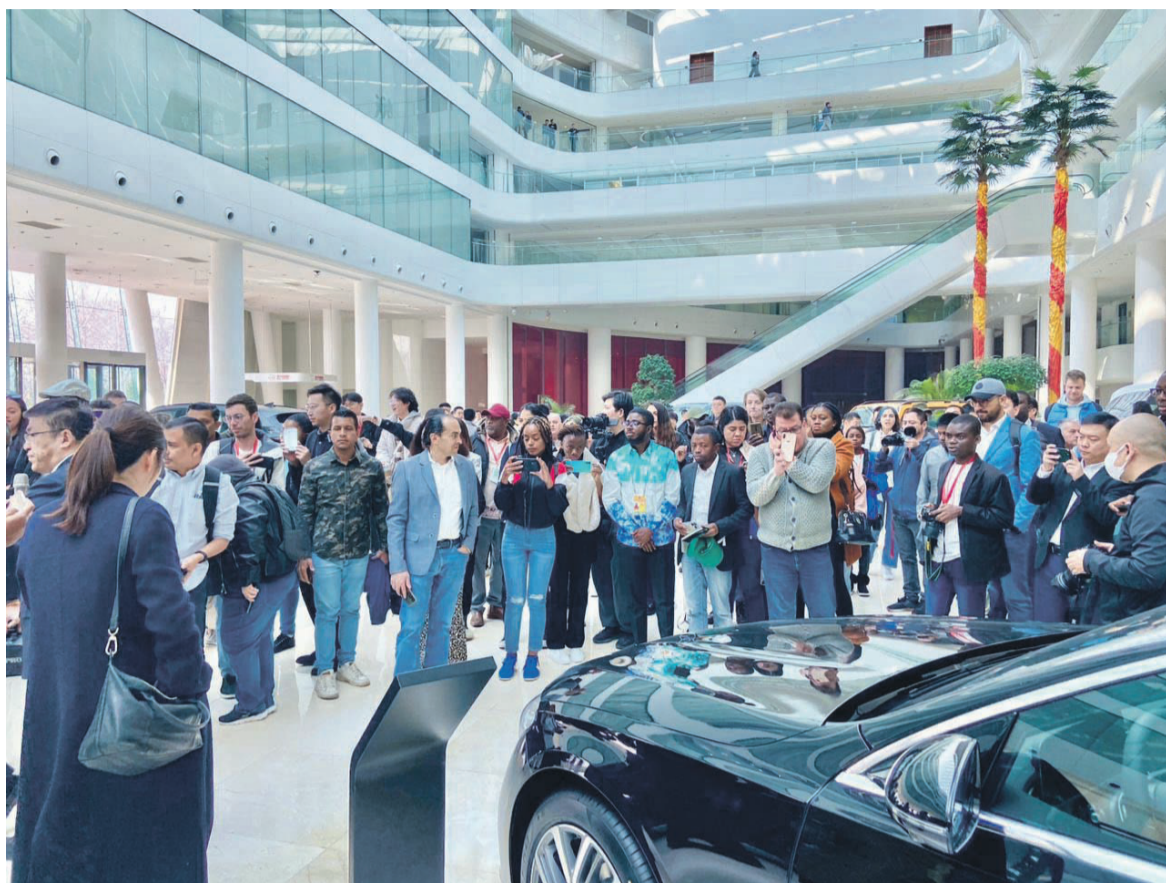
Des journalistes visitant le groupe automobile BAIC/Adiac

Après s'être imprégnés du Parc industriel Chine-Allemagne de Pékin, les journalistes ont mis le cap sur la zone économique de l'aéroport de Beijing. Située à Shunyi de Pékin, elle est le berceau et la source de l'économie aéroportuaire chinoise