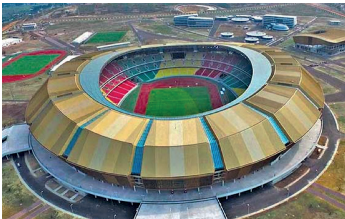
Vue aérienne du stade de Kintélé

Le parcours du sport dans le pays est étroitement lié à son histoire. De son passé à son présent, il est manifeste que le sport a su s'adapter et évoluer, devenant un symbole d'identité nationale et de fierté collective. À mesure que le pays se projette vers l'avenir, il est