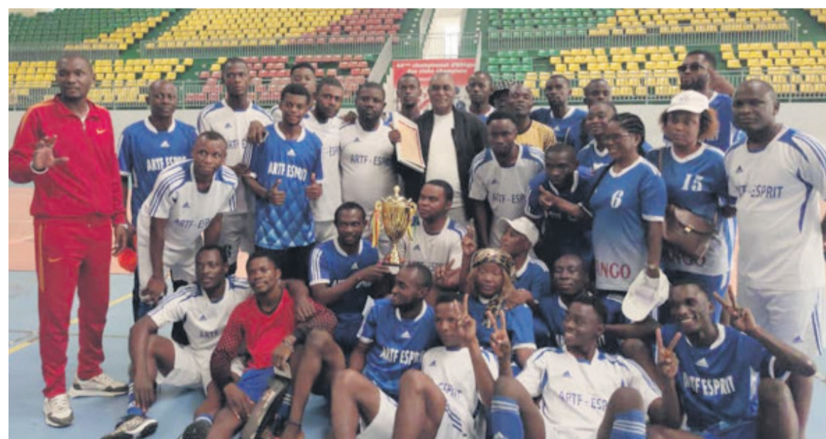
L'équipe de l'ARTF football, championne de Brazzaville

Notons que les études scientifiques sur le sujet du sport en milieu professionnel démontrent les bienfaits de la pratique sportive sur l'élimination de l'absentéisme, la diminution du stress au travail, la prévention des troubles musculo-squelettiques, la cohésion des équipes, ou encore la productivité de l'entité publique