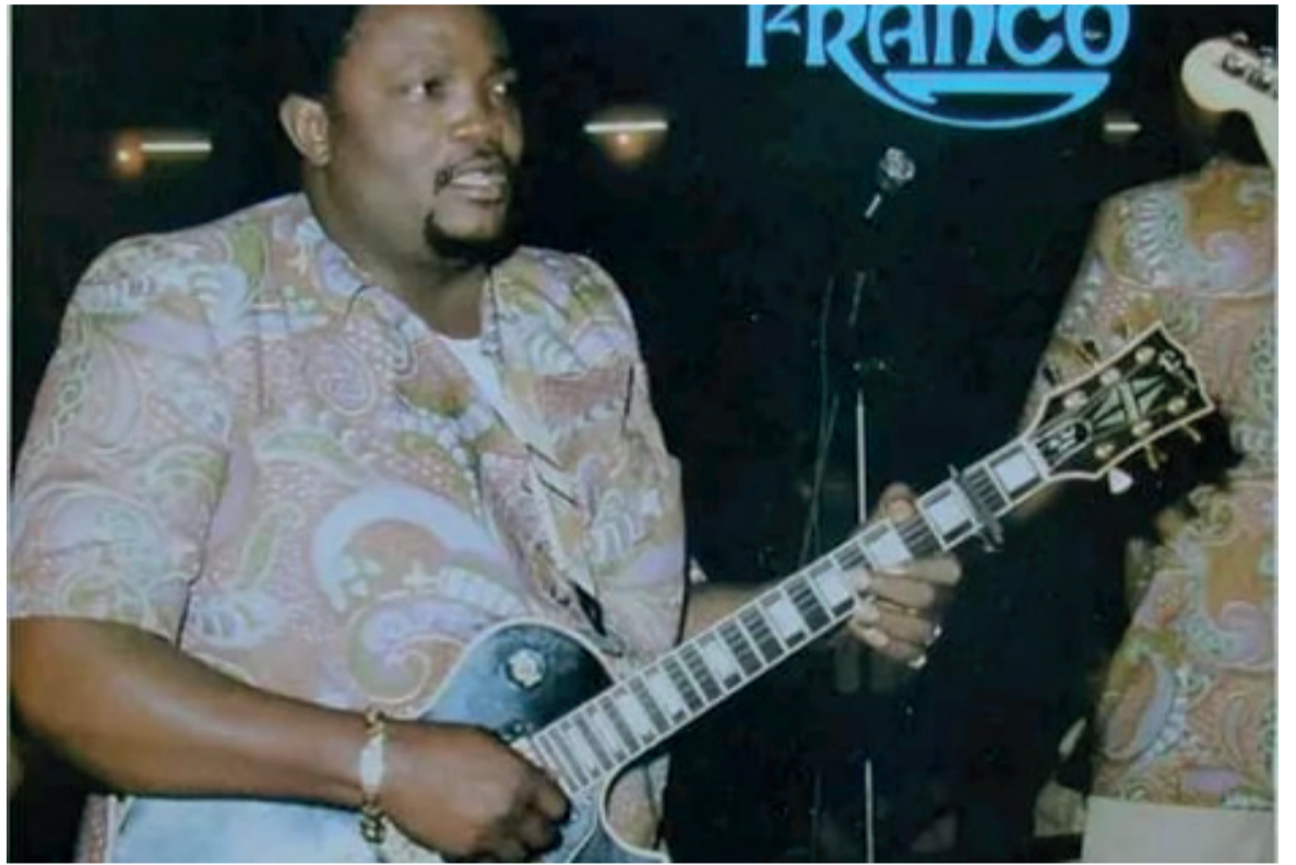
Franco Luambo Makiadi