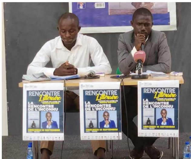
L'auteur s'exprimant durant la rencontre littéraire autour de son premier roman/Adiac vit et nous couchons cela sur du papier afin que ceux qui lisent prennent conscience et qu'ils agissent en

Dans cet ouvrage, l'auteur a abordé une panoplie de sujets de notre ère, à savoir la démission de l'Etat face à ses promesses, la démagogie, les difficultés de l'emploi, la corruption, les relations amoureuses et familiales, le développement personnel, le VIH-sida, etc. « Dans mon roman, La rencontre de l'inconnu, il est question de plusieurs choses. Et donc, si quelqu'un peut s'approprier toutes ces choses, je pense que cela pourrait contribuer d'abord à son changement individuel, parce que la littérature c'est aussi le témoignage de ce que le monde