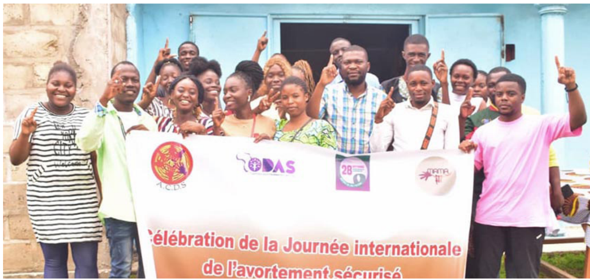
Les participants au focus de l'ACDS posant en famille

L'humanité a commémoré, il y a quelques jours, la Journée internationale de l'avortement sécurisé. Au Congo, l'Association congolaise pour les droits et la santé (ACDS) a organisé un focus au cours duquel elle a alerté sur la hausse des avortements clandestins chez les jeunes.