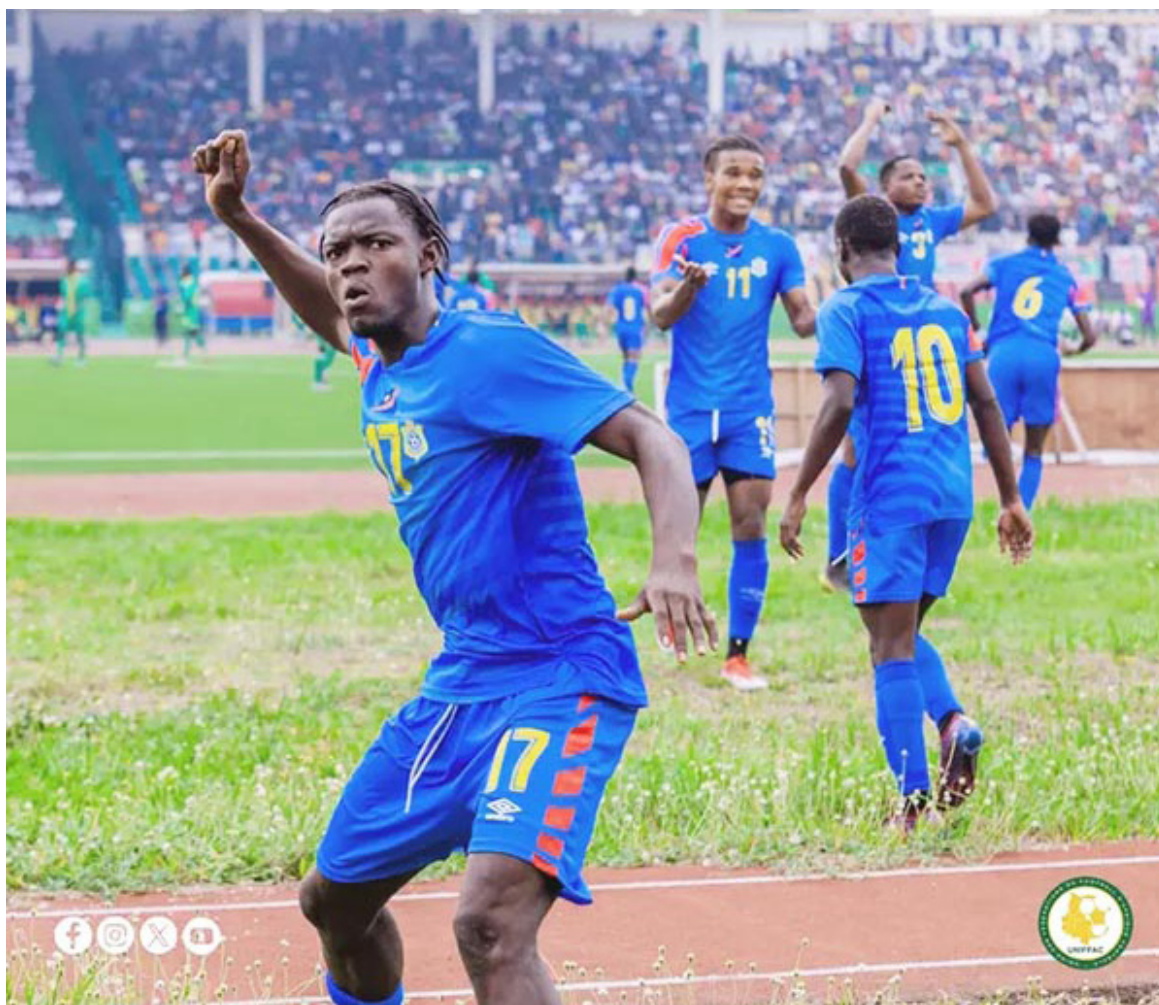
Les Léopards U20 vainqueurs de la 5 e édition du tournoi U20 de l'Uniffac à Brazzaville.

Les Diabes rouges ont ensuite réduit l'écart, à la 89 e minute par Bonaventure Lendambi, sans faire mieux. Grâce à cette victoire, les Jeunes Congolais remportent pour la première fois le titre de ce tournoi qualificatif à la Coupe d'Afrique des nations (CAN) U-20. Notons que les Léopardeaux congolais avaient déjà composté leur ticket pour la CAN U20, qui pourrait se jouer en Egypte, à l'issue de leur victoire en demi-finales sur les Lionceaux du Cameroun au tirs au but, après