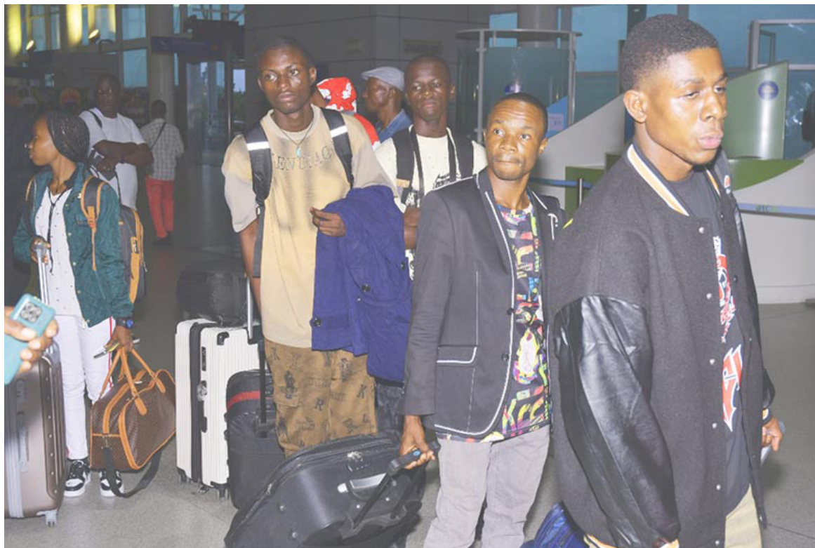
Départ des étudiants congolais pour l'Algérie DR

Ces étudiants ont promis défendre le pays en Algérie par le travail. « Je suis fier de bénéficier d'une bourse d'études, mais je reviendrai au pays pour travailler dans une entreprise financière », a confié une étudiante. La formation a une durée de deux ans. Elle s'inscrit dans le cadre du renforcement de la coopération bilatérale entre le Congo et l'Algérie dans le domaine de l'enseignement technique et professionnel. Les étudiants ont été accompagnés dès les premières heures de la matinée par les responsables du ministère de