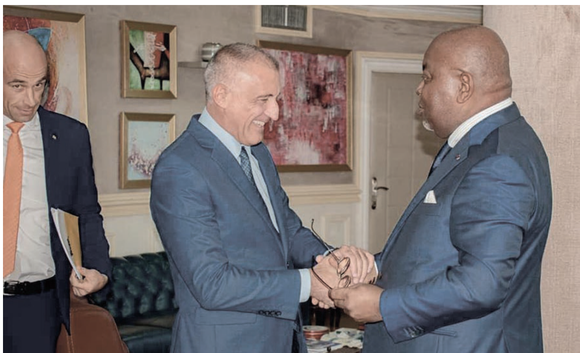
La délégation d'ENI reçue par le ministre des Hydrocarbures

Deuxième opérateur pétrolier du pays après le Français TotalEnergies, ENI Congo opère,