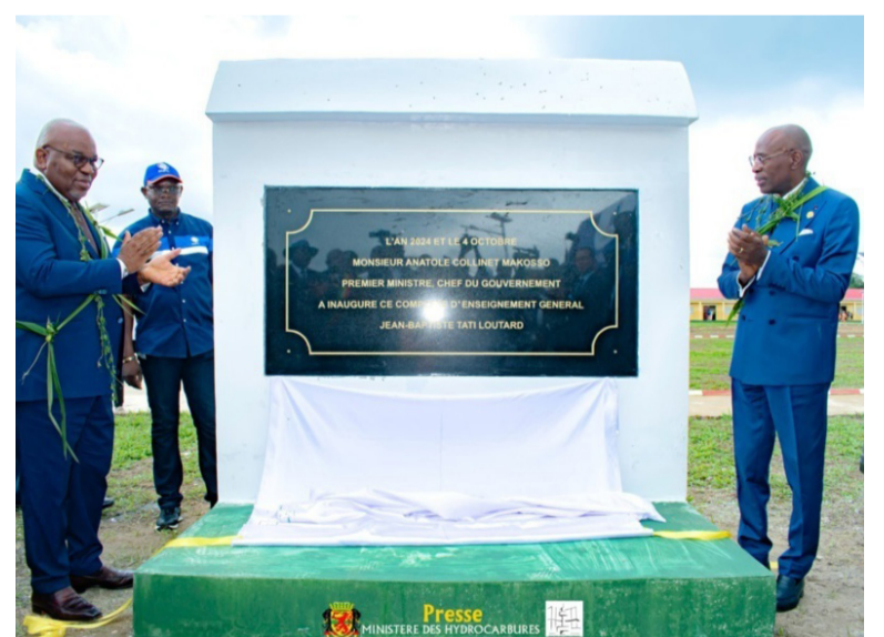
Les membres du gouvernement dévoilant la plaque du complexe scolaire Taty-Loutard/Adiac

Les portes du complexe scolaire de Tchiminzi, situé à 87km de Pointe-Noire, qui porte le nom du défunt écrivain congolais Jean-Baptiste-Taty-Loutard ont été officiellement ouvertes aux élèves le 4 octobre. Construite par la Société nationale des pétroles du Congo dans le but de rapprocher l'école des apprenants, cet établissement d'enseignement général comprend le préscolaire, le primaire et le collège.