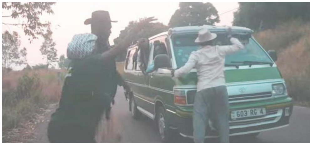
Clip -séquence Bu diama ntangu/DR

Après un lancement en juin dernier à l'occasion de la Fête de la musique, les amateurs de la musique de Ladis Arcade ont à leur disposition le produit de l'association film et musique du single «Bu diama ntangu»