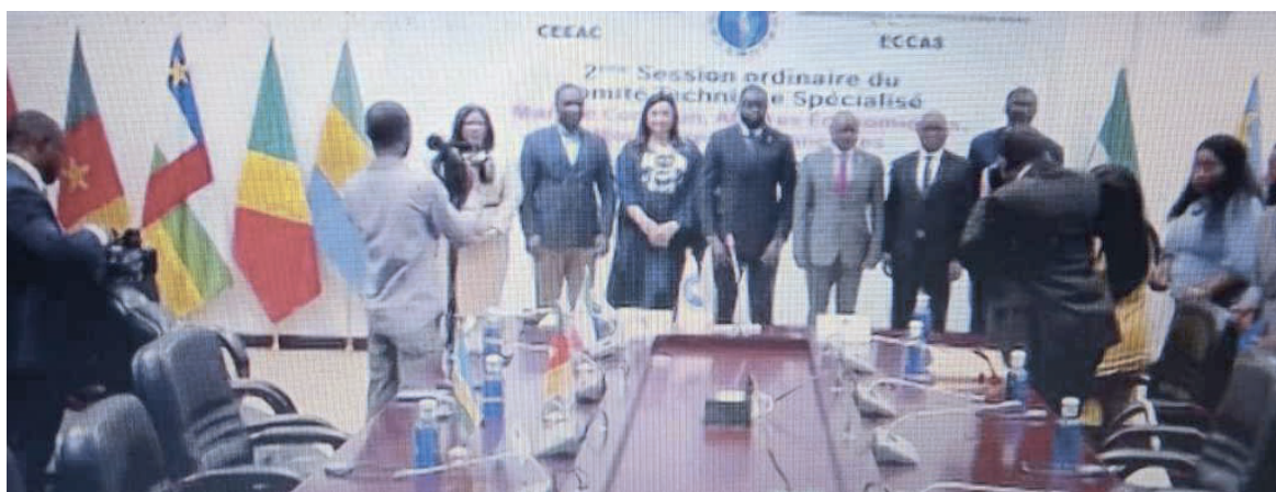
Les participants à la deuxième session du comité technique DR

La deuxième session du Comité technique spécialisé Marché commun, Affaires économiques, monétaires et financières de la Communauté économique des Etats de l'Afrique centrale (CEEAC) s'est ouverte, le 5 octobre, au Centre international des conférences de Sipopo (Guinée équatoriale).