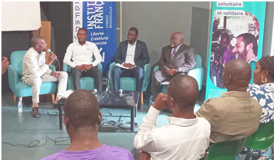
Panel de l'AUF-Congo/Adiac

« Le Campus numérique francophone contribue au renforcement des capacités des étudiants sur le numérique tout en assurant la formation continue »