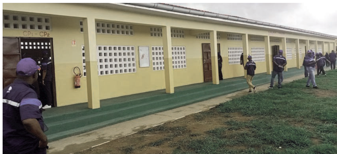
L'un des bâtiments abritant les salles de classe

Le complexe scolaire Jean-Baptiste-Taty-Loutard de Tchiminzi est doté d'un bloc administratif et de cinq bâtiments entièrement équipés, composés de quatre appartements chacun, servant de logements d'astreinte pour les responsables de chaque cycle. Il y est prévu aussi des latrines modernes, un système d'adduc-