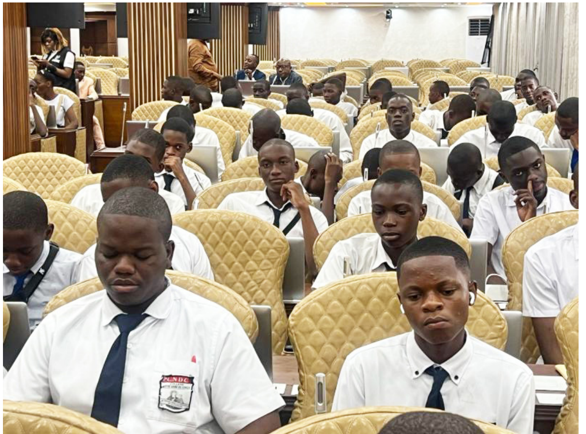
Les élèves de Notre Dame du Congo et Boyokani

Il a également répondu aux questions des élèves, avant d'annoncer que l'IGF va octroyer des fournitures scolaires à ces élèves, en soutien à la politique de la « Gratuité de l'enseignement de base » lancée par le président de la République, Félix Tshisekedi, en 2019, et portée à bras-le-corps par le ministère de l'Éducation nationale et Nouvelle citoyenneté dirigé par la ministre d'État Raïssa Malu.