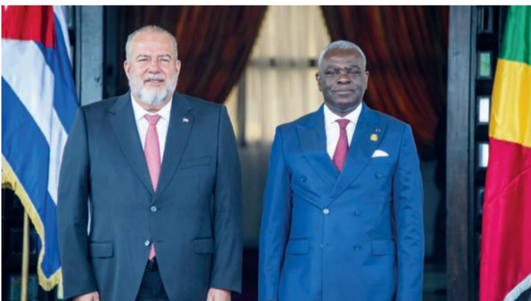
Le Premier ministre congolais, Anatole Collinet Makosso, et son homologue cubain, Manuel Marrero Cruz, ont évoqué hier au cours d'un tête-à-

tête la nécessité pour les deux pays de relancer leur coopération, 60 ans après l'établissement des relations diplomatiques.