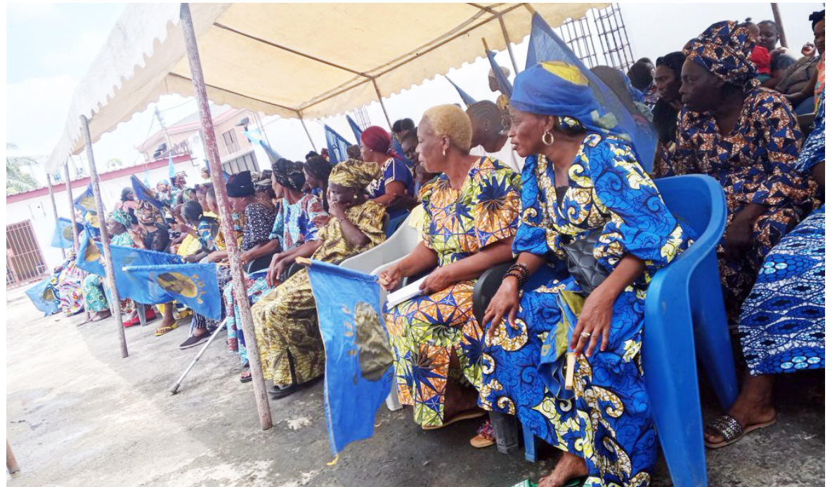
Une vue des femmes du Pulp/Adiac

Le président du Pulp a, par ailleurs, inscrit cette démarche politique dans le cadre d'une nouvelle stratégie visant à préparer les femmes de son parti à mieux affronter les grands