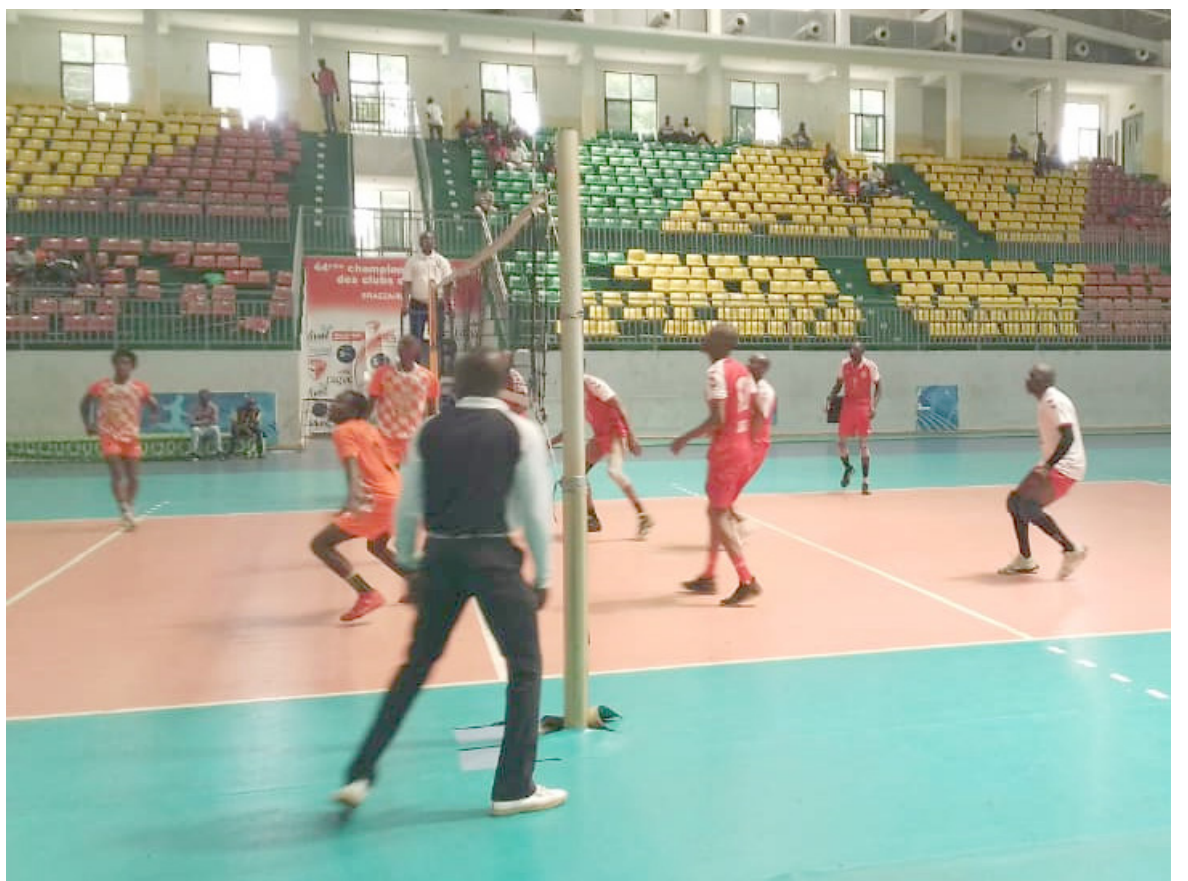
Une séquence du match Adiac